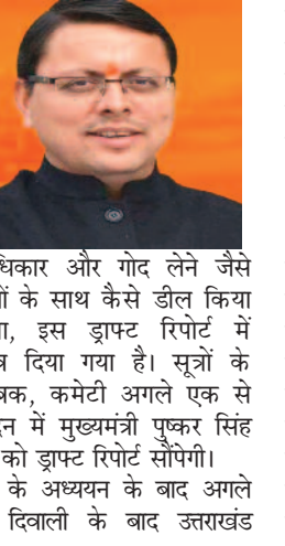
उत्तराधिकार और गोद लेने जैसे मामलों के साथ कैसे डील किया जाएगा, इस ड्राफ्ट रिपोर्ट में सुझाव दिया गया है। सूत्रों के मुताबिक, कमेटी अगले एक से दो दिन में मुख्यमंत्री पुकर सिंह धामी को ड्राफ्ट रिपोर्ट सौंपेगी। रिपोर्ट के अध्ययन के बाद अगले हफ्ते दिवाली के बाद उत्तराखंड

देहरादून, 11 नवंबर 2023 (ए।)। उत्तराखंड में समान नागरिक संहिता यानी यूनिफॉर्म सिविल कोड का ड्राफ्ट तैयार हो गया है। अब राज्य की पुकर सिंह धामी सरकार इसे कानूनी अमलीजामा पहनाने की तैयारी में है। अगर सब कुछ ठीक रहा तो अगले हफ्ते यूसीसी लागू करने वाला उत्तराखंड, देश का पहले राज्य बन जाएगा। उत्तराखंड की बीजेपी सरकार ने यूसीसी को लेकर जस्टिस (रिटायर्ड) रंजना प्रकाश देसाई के नेतृत्व में एक कमेटी गठित की थी। इस टीम ने लोगों की राय-मशविरा के बाद एक ड्राफ्ट रिपोर्ट तैयार कर ली है। राज्य में शादी, तलाक,