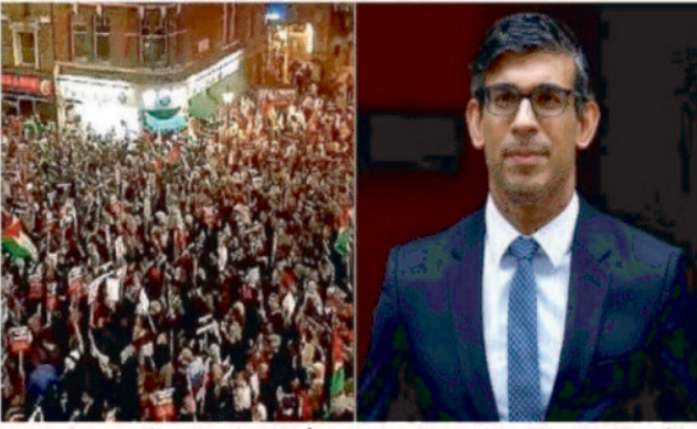
लंदन में फलस्तीन समर्थक विरोध प्रदर्शन भी इसी अवधि में

लंदन, 11 नवम्बर 2023। लंदन की सड़कों पर फलस्तीन समर्थक विरोध प्रदर्शन हो रहे हैं। मेट्रोपॉलिटन पुलिस ने शनिवार को लंदन में एक बड़ा पुलिस अभियान शुरू किया। बता दें कि ब्रिटेन में विश्व युद्ध के शहीदों की याद में युद्धविराम दिवस (रिमेंबरेंस वीकेंड) मनाया जाता है। इस साल ब्रिटिश नागरिकों ने दो मिनट का मौन रखा। इसी दिन इस्राइल और हमास के हिंसक संघर्ष का विरोध कर रहे हजारों प्रदर्शनकारियों ने सड़कों पर मार्च