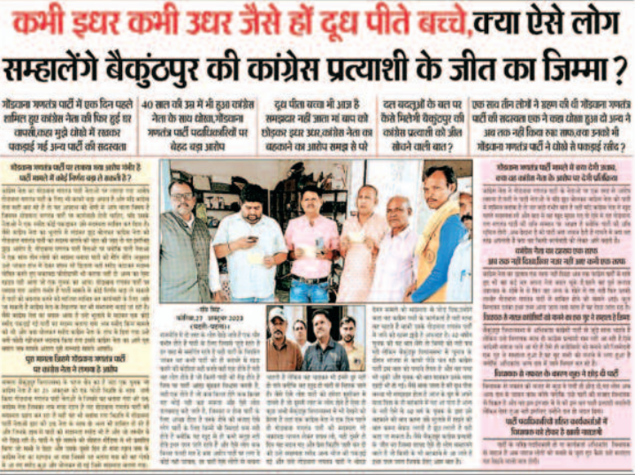
कभी इधर कभी उधर जैसे हों दूध पीते बच्चे, क्या ऐसे लोग सम्हालेंगे बैकुण्ठपुर की कांग्रेस प्रत्याशी के जीत का जिम्मा?

-रवि सिंह- बैकुण्ठपुर, 09 नवम्बर 2023 (घटती-घटना)। राजनीति का कोई धर्म नहीं होता सिर्फ राजनीति का उद्देश्य होता है सत्ता पाना, सत्ता पाने के लिए क्या नहीं किया जाता यह किसी से छुपा नहीं है, सत्ता पाने की चाह इतनी अधिक होती है कि कोई भी प्रत्याशी किसी भी हद तक जा सकता है या कहे तो उनके समर्थक अपने प्रत्याशी के लिए कुछ भी कर सकते हैं, ताकि वह जीतने के बाद उनके करीबी बनकर 5 साल रेवडी खा सकें, पर इस बीच प्रत्याशी को जीताने के लिए जो भी हथकण्डे अपनाए जाते हैं वह कहीं ना कहीं नियमों पर खरे नहीं उतरते, कुछ ऐसा ही एक वाक्या बैकुण्ठपुर विधानसभा के राजनीति में भी देखने को मिला कांग्रेस से प्रत्याशी का नाम तय होने के बाद कुछ कांग्रेसी गोंडवाना गणतंत्र पार्टी में चले गए जैसे ही वह गोंडवाना गणतंत्र पार्टी में गए तत्काल प्रत्याशी के करीबी