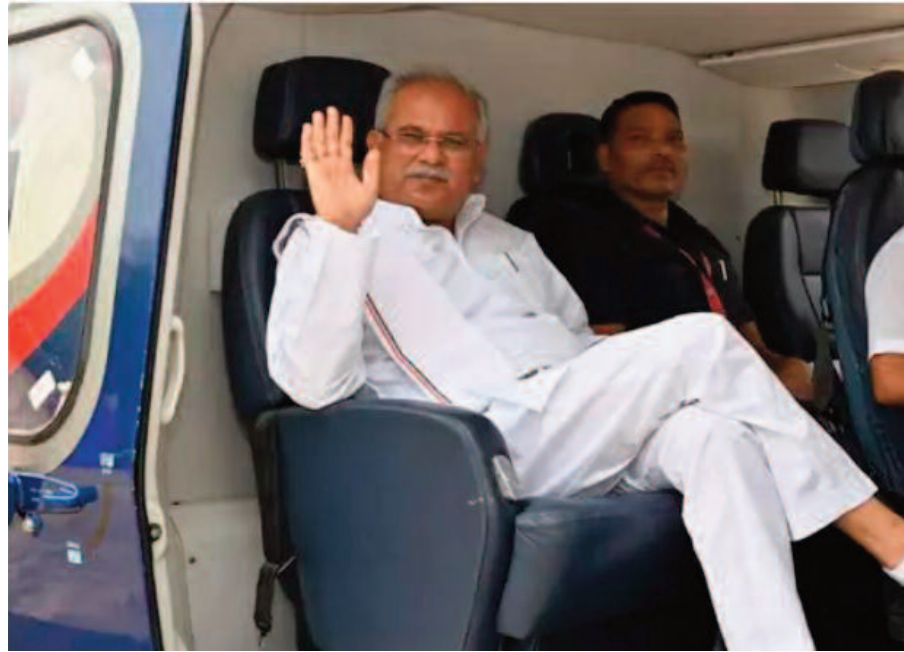
योजनाएं लेकर आई है। प्याज के रेट देखकर भी आसू आने लगे हैं। कांग्रेस ने घोषणा पत्र में गैस सिलेंडर 500 सब्सिडी देने की बात कही है। 107 रुपए उज्ज्वला योजना के तहत लोगों को पड़ेगा।

रायपुर, 09 नवम्बर 2023 (ए)। छत्तीसगढ़ में चुनावी माहौल के बीच सियासी पारा चढ़ता ही जा रहा है। भाजपा और कांग्रेस के नेताओं के बीच आरोप प्रत्यारोप का दौर जारी है। इस बीच सीएम भूपेश बघेल ने महंगाई और भाजपा नेताओं के बयान पर निशाना साधा है। उन्होंने सांसद रवि किशन के बुलडोजर वाले बयान पर कहा, पूरी स्क्रिप्ट लिखी जा रही है। रमन सिंह के साथ पहले दो अधिकारी थे, वह अडानी के संपर्क में हैं। वही लोग स्टोरी प्लान कर रहे हैं और इसी हिसाब से कार्रवाई हो रही है। बदनाम करने की साजिश और गिरफ्तारी भी चल रही है। ईडी और आईटी के माध्यम से चुनाव लड़ा जा रहा है। असम के सीएम के बयान पर भी पलटवार करते हुए सीएम ने कहा कि नया मूह्व है ज्यदा प्याज खाएगा। अभी-अभी कांग्रेस छेड़कर भाजपा में गया है। निर्वाचन आयोग में