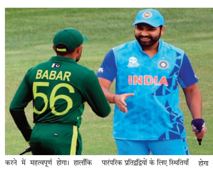
करने में महत्वपूर्ण होगा। हालांकि पारंपरिक प्रतिद्वंद्वियों के लिए स्थितियां

नई दिल्ली, 09 नवम्बर 2023। शानदार अजेय प्रदर्शन की बदौलत भारतीय क्रिकेट टीम ने पहले ही क्रिकेट विश्व कप 2023 के सेमीफाइनल में अपनी जगह पक्की कर ली है। दूसरी ओर, कड़क प्रतिद्वंद्वी पाकिस्तान ने टूर्नामेंट में अब तक अपने आठ मुकाबलों में चार जीत और चार हार के साथ मिश्रित फॉर्म का आनंद लिया है। जहां नीदरलैंड के खिलाफ भारत का आखिरी मैच ओपचारिकता भर है तो वहीं इंग्लैंड के खिलाफ पाकिस्तान का मैच प्रतियोगिता में उनके भविष्य को तय करने में महत्वपूर्ण होगा। हालांकि पारंपरिक प्रतिद्वंद्वियों के लिए स्थितियां