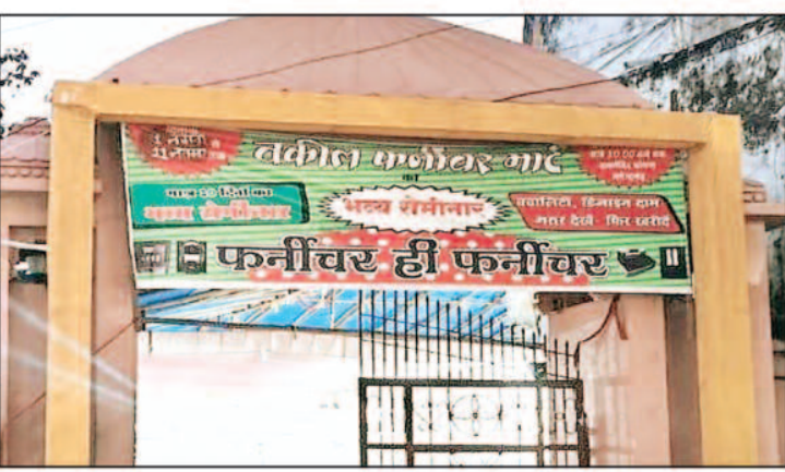
फर्नीचर मार्ट मनेन्द्रगढ़ को किराये पर दे दिया है जो विधि विरुद्ध है, साथ ही पूर्व में

मनेन्द्रगढ़, तहसील- मनेन्द्रगढ़, जिला एमसीबी छ.ग. ने कलेक्टर एमसीबी को ज्ञापन सौंपते बताया कि श्रीराम मंदिर परिसर में निर्मित प्रांगण का मंदिर के ट्यूटी एवं पुजारी के मध्य विवाद चल रहा है, विवाद के कारण उक्त प्रांगण में माननीय न्यायालय अनुविभागीय अधिकारी (रा.) महोदय मनेन्द्रगढ़, जिला- एमसीबी छ.ग. के द्वारा स्थान आदेश जारी कर यथास्थिति बनाये रखने का आदेश जारी किया गया था, परन्तु स्थान आदेश के उपरांत भी माननीय न्यायालय के आदेश की अवमानना करते हुए नगरपालिका परिषद द्वारा विवादित प्रांगण को फर्नीचर विक्रय हेतु वफील