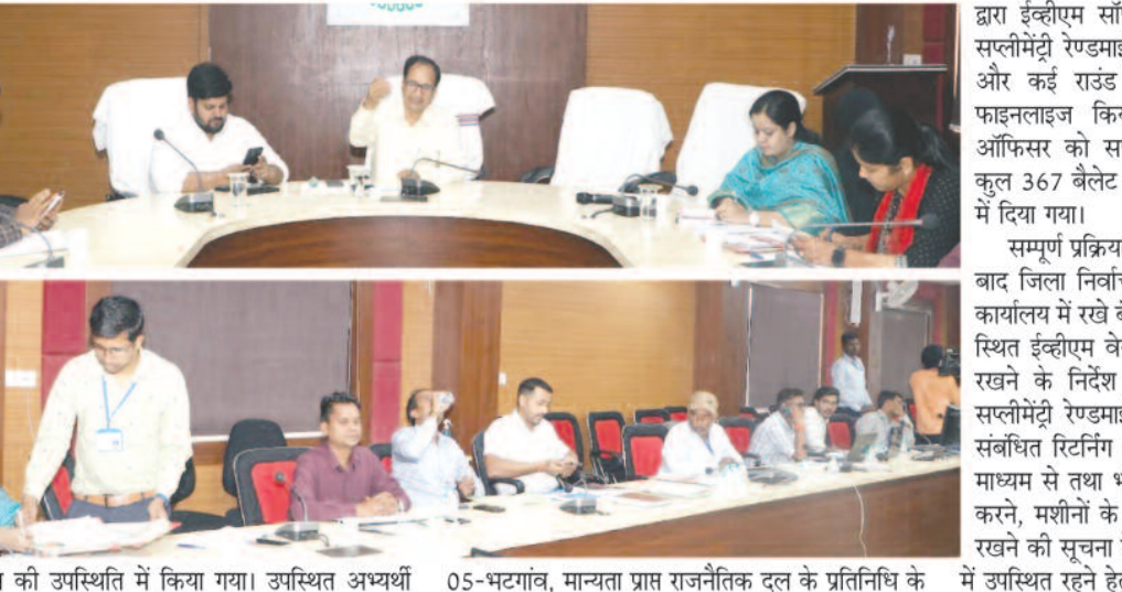
प्रतिनिधि की उपस्थिति में किया गया। उपस्थित अर्थी

विधानसभा क्षेत्र क्रमांक-05 भटगांव में कुल 17 अर्थियों द्वारा चुनाव लड़ने के कारण प्रति मतदान केन्द्र 01 अतिरिक्त बैलेट यूनिट एवं रिजर्व 20 प्रतिशत बैलेट यूनिट कुल 367 बैलेट यूनिट की आवश्यकता है, जिस कारण विधानसभा क्षेत्र क्रमांक-05 भटगांव हेतु बैलेट यूनिट मशीनों का सप्लीमेंट्री रेण्डमाईजेशन किया गया। कलेक्टर एवं जिला निर्वाचन अधिकारी संजय अग्रवाल के द्वारा सप्लीमेंट्री रेण्डमाईजेशन के संबंध में विस्तृत जानकारी सर्व अर्थी विधानसभा क्षेत्र क्रमांक-05 भटगांव के मान्यता प्राप्त राजनैतिक दल के प्रतिनिधि को दिया गया। बैलेट यूनिट मशीनों का अर्थी, विधानसभा क्षेत्र क्रमांक-05 सप्लीमेंट्री रेण्डमाईजेशन की सम्पूर्ण कार्यवाही भटगांव, मान्यता प्राप्त राजनैतिक दल के