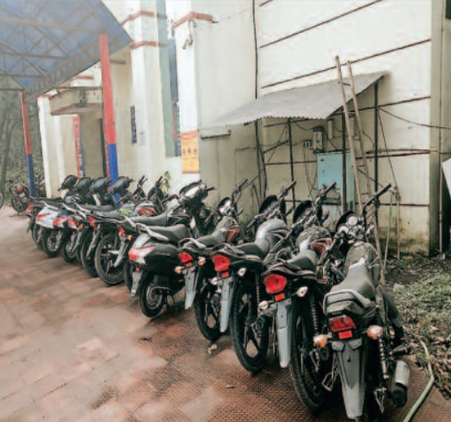
सीसी मोटर सायकल, 05 नया होण्डा एक्टिवा स्कूटी मिला कीमत लगभग 13,00,000 रुपये है, जो लावारिस हालत में मिला। पुलिस ने उक्त टून्हीलरों को चोरी का माल होने के संदेह पर मौके पर धारा