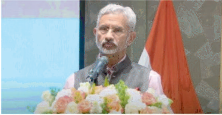
रूप से देख रहे हैं कि आने वाला समय बहुत कठिन है। आने वाला समय बहुत अशांत है। बता दें कि पिछले साढ़े चार साल में विदेश

रोम (इटली), 03 नवम्बर 2023। इटली दौर पर पहुंचे विदेश मंत्री जयशंकर ने हिंद-प्रशांत क्षेत्र में इटली और यूरोपीय संघ की अधिक रुचि का स्वागत किया। उन्होंने शुक्रवार को रेखांकित किया कि दुनिया के हर कोने में रुचि लेना वैश्विक दुनिया में महत्वपूर्ण है। विदेश मंत्री ने इटली दौर के दौरान सीनेट के विदेश मामलों और रक्षा आयोग के संयुक्त सत्र को संबोधित किया। उन्होंने देश की विदेश नीति का जिक्र करते हुए बताया कि भारत आज दुनिया को कैसे देखता है।