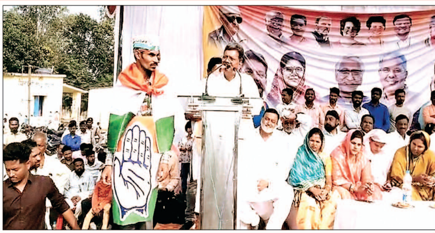
शासन काल में जितनी भीड़ बैकूणपुर आने पर रेस्ट हाउस में होती थी उतनी भीड़ भी नहीं दिखी आम सभा में

सांसद चुनावी सभा को संबोधित करते हुए एक बात कही की आप मेरा चेहरा देखकर कांग्रेस प्रत्याशी को जीत दिलाएं जिस पर सवाल यह उठता है क्या सांसद जी को भी बैकूणपुर के कांग्रेस प्रत्याशी पर भरोसा नहीं है? जिस वजह से वह अपने चेहरे पर बैकूणपुर प्रत्याशी के लिए वोट मांग रही हैं? क्या कांग्रेस प्रत्याशी का चेहरा कहीं ना कहीं विवादों से घिरा हुआ है जिस वजह से उन्हें यह बात बोलना पड़ा? पटना क्षेत्र के लोग सांसद को पहली बार अपने सामने देखकर सबसे पहले उन्हें पहचानने में लगे रहे वहीं उन्होंने प्रत्याशी के समर्थन में मतदान की अपील करते हुए कहा की प्रत्याशी की जगह उनका चेहरा देखकर प्रत्याशी को जिताना है, इस पर कुछ लोग चुटकियां भी लेते सुने गए और उनका कहना था सांसद को ही जब पहली बार देख रहे हैं तो उनका चेहरा कैसे देखकर मतदान करें जबकि उनका चेहरा ही याद नहीं वहीं यह भी बात लोगों के बीच से सामने आई की क्या सांसद मान चुकी हैं की कांग्रेस प्रत्याशी वर्तमान विधायक को अपने चेहरे अपने कार्यकाल के कारण जनता नहीं चुनने जा रही है। वैसे बता दें क्षेत्र से लोकसभा चुनाव में वर्तमान सांसद खुद कई हजार मतों से पीछे रह चुकी हैं और ऐसे में क्या वह अपना चेहरा सामने रखकर उसी तरह का समर्थन मांग रही हैं। उन्होंने पुराना चावल नया चावल की भी परिभाषा दी, उन्होंने कहा की पुराना चावल गीला नहीं होता नया गीला होता है इसलिए पुराना चुनना है नया नहीं, इसपर भी लोगों की प्रतिक्रिया आई की ऐसे में क्या वह क्या कहना चाहती हैं समझ में नहीं आया क्योंकि माना जाता है की चावल जितना पुराना होता है वह उतना गीला होने की प्रवृत्ति छोड़ देता है ऐसे में क्या वह कितना पुराना चुनने को कह गईं कहीं पुराने वाले की तरफ तो उनका इशारा नहीं था।