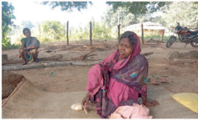
पण्डे महिला ने कहा कि सड़क नहीं होने के कारण सड़क नहीं होने के कारण घरातल पर विकास कोसों दूर है।

एंबुलेंस पहुंच नहीं पाती और कांवर के सहारे गर्भवती महिलाओं और मरीजों को 2 किलोमीटर मुख्य मार्ग में ले जाना पड़ता है। बच्चों को स्कूल आने-जाने प्रार्थमिक शाला में पदस्थ शिक्षकों को स्कूल आने-जाने में काफी परेशानियों का सामना करना पड़ता है। जिससे बच्चों के पढ़ाई भी प्रभावित होती है। कुछ ग्रामीणों को तो यह भी नहीं पता कि उनका विधायक कौन है आज तक उन्होंने अपने विधायक को देखा तक नहीं है। तो गांव का विकास बहुत दूर की बात है। क्षेत्रीय विधायक तो अपने क्षेत्र में विकास कार्य की बात तो करते हैं परंतु घरातल पर विकास कोसों दूर है।