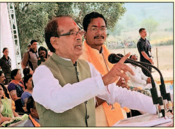
-अरविन्द द्विवेदी- अनुपपुर, 02 नवम्बर 2023 (घटती-घटना)।

प्रदेश के मुख्यमंत्री शिवराज सिंह चौहान के द्वारा 1 नवंबर को पुष्पराजगढ़ विधानसभा क्षेत्र के ग्राम पंचायत लीला टोला में आयोजित चुनावी सभा को संबोधित करते हुए कहा कि हम सरकार नहीं परिवार चलते हैं। भाजे भाजियां, बेटा बेटियों, बुजुर्गों, माता बहनों का भैया हूं। कांग्रेस के किसी मुख्यमंत्री ने आज तक एक पैसा नहीं दिया, जिसके दिल में प्यार है वही चिंता करता है। बहनों को कभी पैसों की जरूरत पड़ जाए तो उन्हें हाथ फेरलाना पड़ता था हमने भाई होने का फर्ज निभाया है। 1000 से शुरुआत की और 1250 रुपए अभी दे रहा हूं आगे इस राशि को बढ़कर 3000 करने