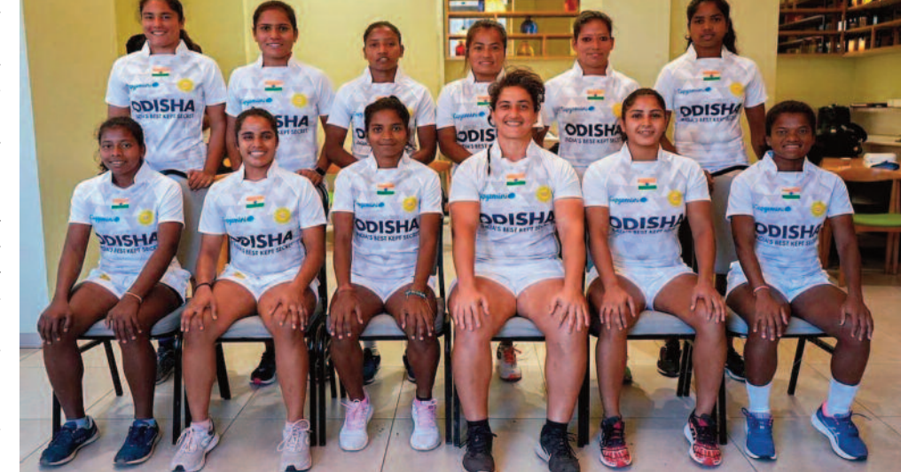
है, सर्वोत्तम संभव परिणाम एशिया रग्बी सेवर्स सीरीज के लिए योग्यता सुनिश्चित करेगा। हम टीमों की तैयारी और महिलाओं दोनों को अपना को लेकर आधस्त हैं। और पुरुषों सर्वश्रेष्ठ प्रदर्शन करने के लिए समर्थन

मुंबई, 02 नवम्बर 2023। भारतीय रग्बी पुरुष और महिला टीम 3 और 4 नवंबर को दोहा, कतर में होने वाली एशिया रग्बी सेवर्स ट्रॉफी में प्रतिस्पर्धा करेंगी, जहां महिलाएं पिछले साल के अपने रजत पदक को स्वर्ण में बदलना चाहेंगी क्योंकि वे शीर्ष स्तर पर होंगी। टूर्नामेंट में एशियाई टीमों में दूसरी ओर, पिछले साल नौवें स्थान पर रही पुरुष टीम इस बार अपना प्रदर्शन बेहतर करने की कोशिश में है। पुरुष और महिला दोनों टीमों में विशेष रूप से एशिया रग्बी सेवर्स ट्रॉफी की तैयारी के लिए एएसएआइ, कोलकाता में आयोजित एक कठोर प्रशिक्षण शिविर के बाद 29 अक्टूबर को दोहा के लिए उड़ान भरी। एशिया रग्बी सेवर्स ट्रॉफी इस साल भारतीय रग्बी के लिए सबसे महत्वपूर्ण प्रतियोगिता है। चूंकि महिला टीम को पोल पोजिशन पर रखा गया