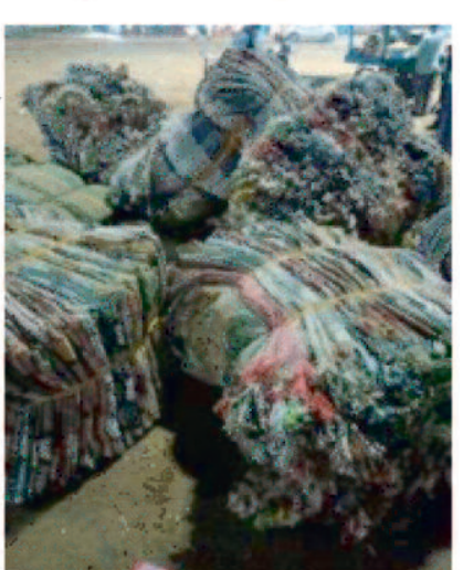
चालकों से उक्त रुपए के संबंध में कोई संतोषजनक जवाब नहीं दिए जाने पर उड़न दस्ता दल ने जब्त की कार्रवाई की है। वहीं रामानुजगंज कन्हर नाका के पास से जांच के दौरान एक वाहन से 400 नग कंबल जब्त किया गया है। जिसकी कीमत 1 लाख 36 हजार रुपए बताई जा रही है।

वाहन चेकिंग के दौरान उड़न दस्ता दल ने बलरामपुर जिले के धनवार बेरियर से दो वाहनों से कुल 3 लाख 91 हजार रुपए जब्त किया है। वहीं रामानुजगंज कन्हर बेरियर से वाहन चेकिंग के दौरा 400 नग कंबल जब्त किया है। जिसकी कीमत 1 लाख 36 हजार रुपए बताई जा रही है। विधानसभा चुनाव के दौरान आदर्श आचार संहिता को पालन कराने के लिए उड़न दस्ता टीम का गठन किया गया है। वहीं उड़न दस्ता टीम व जिला पुलिस द्वारा जिले के बेरियरों के पास व्हाइट लगाकर दूसरे जिले व प्रदेश से आने वाले वाहनों की सघन जांच की जा रही है। इसी क्रम में बलरामपुर जिले के धनवार बेरियर के पास वाहन चेकिंग के दौरान उड़नदस्ता टीम ने वाहन क्रमांक सीजी 15 डीटी 2300 से 1 लाख 30 हजार व डीएल सीजी 4727 से 2 लाख 61 हजार 5 सौ रुपए जब्त किए गए हैं। वाहन