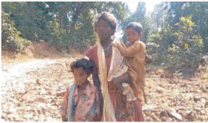
भी नहीं पहुंचे जिसे लेकर ग्रामीणों में महिलाओं ने वोट नहीं देने की बात कही की बात कही है। विकास नहीं होने पर तो वहीं अन्य ग्रामीणों ने विधायक बदलने की बात कही है।

लुण्डा विधानसभा क्षेत्र के लखनपुर विकासखंड में विकास कार्य नहीं होने पर ग्रामीण महिलाओं ने वोट नहीं करने की बात कही है। तो वहीं इस बार अन्य ग्रामीणों ने विधायक बदलने की बात कही है। पूरा मामला लुण्डा विधानसभा क्षेत्र के लखनपुर विकासखंड के ग्राम चोडेया के आश्रित ग्राम तुरगा के साचरघाट का है। पण्डे और डांडव समाज के लगभग 30 परिवार निवास रथ हैं। जहां के ग्रामीणों के द्वारा बताया गया कि पूर्व विधायक के द्वारा पिछले पंचवर्षीय चुनाव के समय सड़क सहित मूलभूत समस्याओं से निजात दिलाने का आश्वासन दिया था। चुनाव जीतने के बाद समस्याओं से निजात दिलाना तो दूर ग्रामीणों से मुलाकात करने