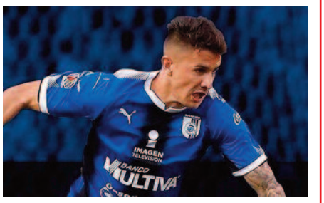
इस बीच, फ्लुमिनेंस अपने पिछले चार मैचों में से तीन हारकर आठवें स्थान पर खिसक गया। रियो डी जनेरियो के दिग्गज अब अपना ध्यान शनिवार को माराकाना स्टेडियम में अर्जेन्टीना के बोका जूनियर्स के खिलाफ कोपा लिबर्टाडोरेस फाइनल पर लगाएंगे।