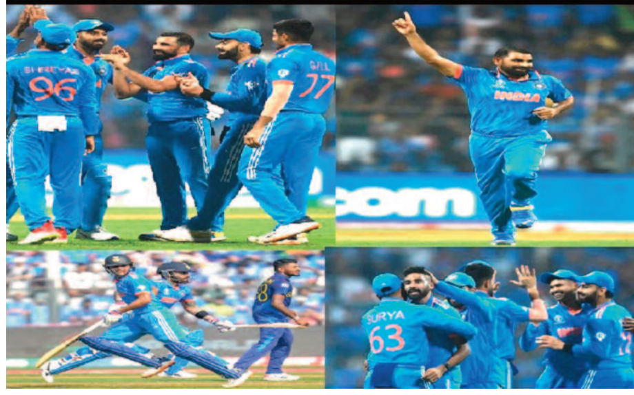
इसके साथ ही शमी को प्लेयर ऑफ द मैच चुना गया। वहीं श्रीलंका की पारी की शुरुआत बेहद खराब रही। पहले ओवर की पहली ही गेंद पर जसप्रीत बुमराह ने श्रीलंका टीम को पहला झटका दिया।

2023 में भारतीय टीम अजेय बढ़त के साथ सेमीफाइनल में पहुंचने वाली पहली टीम बन गई है। वहीं फाइनल टैबल में 14 अंकों के साथ भारतीय टीम टॉप पर काबिज हो गई है। जबकि रनों के लिहाज से वर्ल्ड कप इतिहास की दूसरी सबसे बड़ी जीत हासिल करने वाली टीम बन गई है। वहीं भारतीय टीम ने पहले बल्लेबाजी करते हुए 50 ओवर में 8 विकेट के नुकसान पर 357 रन का पहाड़ खड़ा किया था। जिसके जवाब में श्रीलंकाई टीम महज 19.4 ओवर में 55 रन पर ही सिमट गई। इस दौरान मोहम्मद शमी ने धमाकेदार गेंदबाजी करते हुए 5 विकेट अपने नाम किए। उन्होंने 5 ओवर में महज 18 रन देकर 5 विकेट चटकाए। इसके अलावा मोहम्मद सिराज ने तीन जबकि जसप्रीत बुमराह और रविंद्र जडेजा ने एक-एक विकेट हासिल किया।