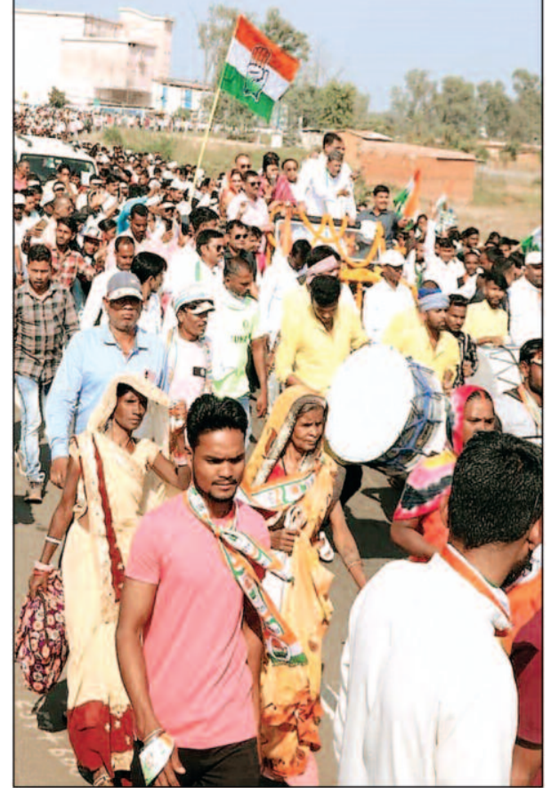
रैली में छोटी सी जीप में चढ़ने परेशान दिखे नेता, दो प्रत्याशी विधानसभा अध्यक्ष के चढ़ते ही भी नजर आई जीप-

सीमित लोग इस दौरान पहुंचे थे उन्हे काफी कम समर्थन मिलता दिखा क्षेत्र से यह भी चर्चा सुनी गई वहीं यह भी बताया जा रहा है की भरतपुर सोनहट विधायक साथ ही कांग्रेस प्रत्याशी की जुटाई गई संख्या में मनेन्द्रगढ़ के कांग्रेस प्रत्याशी की संख्या बल को लेकर दिखी कमजोरी छिप गई और उनका भी नामांकन एक अच्छी भीड़ के बीच ही संपन्न हो सका। भरतपुर सोनहट विधायक सहित कांग्रेस प्रत्याशी की नामांकन रैली काफी विशाल थी जैसा बताया जा रहा है तस्वीरों से भी नजर आ रहा है वहीं यह भी सूत्रों का कहना है की यह रैली ऐसे ही विशाल नहीं हुई इसमें केवल भरतपुर सोनहट विधानसभा के ही लोग शामिल नहीं थे इस रैली को सफल बनाने में बैकुंठपुर के लोगों का काफी सहयोग भरतपुर सोनहट विधायक और कांग्रेस प्रत्याशी को मिला यह भी बताया जा रहा है वहीं बैकुंठपुर से कर्मचारियों ने भी जाकर रैली को वृहद बनाने में मदद की यह भी सूत्रों का दावा है। वैसे बैकुंठपुर से एमसीबी कांग्रेस प्रत्याशियों की