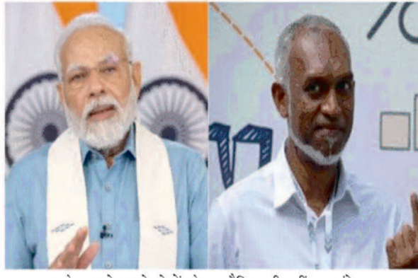
भारत के बदले दूसरे देशों के सैनिक भी नहीं बुलाए

सैनिकों की संख्या कम नहीं जीरो करने की नीति उन्होंने कहा, मैं मालदीव से सैन्य कर्मियों को जल्द से जल्द वापस भेजने के विवरण पर काम करने के लिए भारत के साथ स्पष्ट और विस्तृत राजनयिक परामर्श करूंगा। उन्होंने कहा, यहां ध्यान सैन्य कर्मियों की वास्तविक संख्या पर नहीं है। मालदीव में भारत की सेना बिल्कुल भी नहीं होने पर है। हम भारत सरकार से चर्चा करेंगे और इसके लिए आगे का रास्ता निकालेंगे।