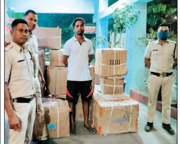
हरदी बाजार पुलिस ने अवैध पटाखों के विरुद्ध की कार्रवाई