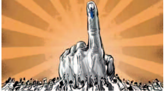
वह फौनिक्स तो नहीं, कांग्रेस की उत्तर प्रदेश में है।

कांग्रेस की उत्तर प्रदेश में है। दोनों मेले में बिछड़े भाई नजर आते हैं। उत्तर प्रदेश में कांग्रेस की बहुत बढाई भी जा रही है। यही कारण है कि अखिलेश जी को अखिलेश वखिलेश सुनना पड़ा।