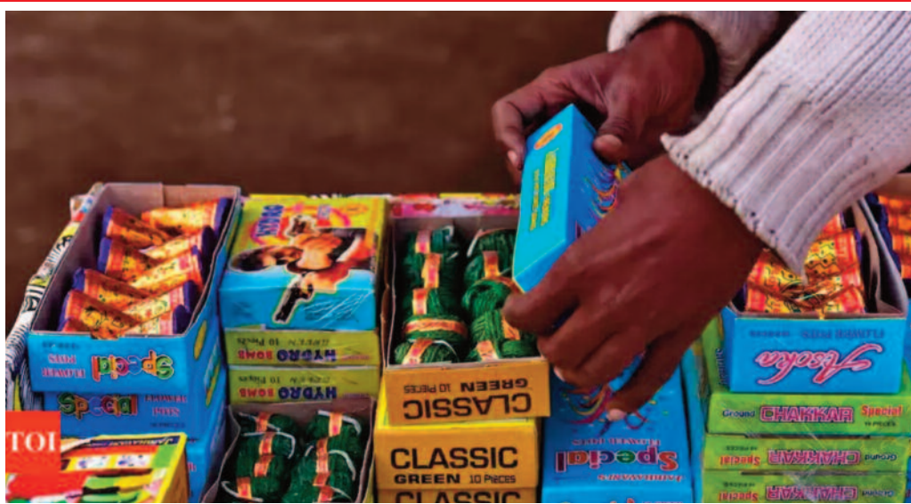
अधिकारियों को निर्देशित किया है। दीपावली, छठ पूजा, गुरु पर्व, नया वर्ष/क्रिसमस के मौके पर दो घंटे की

रायपुर, 26 अक्टूबर 2023 (ए)। राज्य में केवल हरित पटाखों का उपयोग एवं विक्रय ही हो सकेगा। साथ ही दीपावली, छठ, गुरु पर्व, नया वर्ष/ क्रिसमस के अवसर पर पटाखों को फेड़ने के लिए दो घंटे की अवधि निर्धारित की गई है। उच्चतम न्यायालय तथा नेशनल ग्रीन ट्रिब्यूनल की मार्गदर्शिका के मुताबिक पटाखों के उपयोग के संबंध में निर्देशों का कड़ाई से पालन करने जिला प्रशासन के