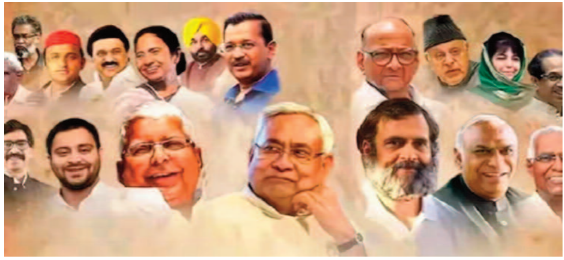
कमलनाथ, अखिलेश यादव, अरविंद केजरीवाल, विपक्षी गठबंधन के नेताओं का एक बैठक का दृश्य।

गठबंधन बनाने की पहल की थी और पहली बैठक पटना में कराई थी। तभी से वे उम्मीद कर रहे हैं कि उनको विपक्षी गठबंधन का