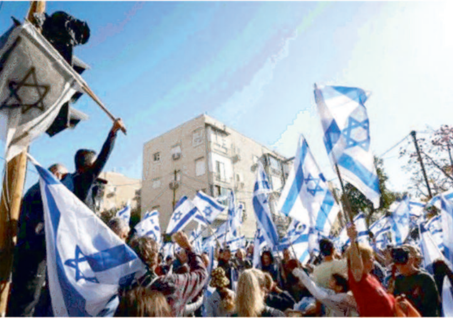
इजरायली सेना ने 'एक्स' में लिखा, इजरायली सेना आपको आरक्षण देती है कि वह आपको