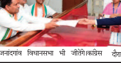
राजनांदगांव विधानसभा भी जीतेगी कांग्रेस

राजनांदगांव जिले के चारों विधानसभा सीटों में कांग्रेस की जीत का दावा करते हुए मुख्यमंत्री भूपेश बघेल ने कहा कि जिले की तीन सीटों पर कांग्रेस के विधायक हैं, तो वहीं अब