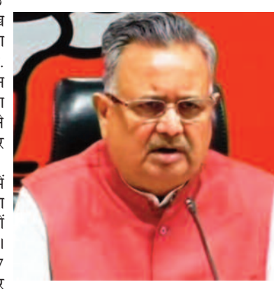
मतदान की तारीखों में बदलाव की मांग की है। पूर्व सीएम रमन सिंह ने टवीट कर लिखा है कि

छत्तीसगढ़ में होने वाले द्वितीय चरण की तारीख में बदलाव की मांग करते हुए पूर्व सीएम डा. रमन सिंह ने निर्वाचन आयोग को टवीट किया है। इसके पीछे उन्होंने छठ पूजा पर्व को लेकर कारण दिया है। ज्ञात हो कि छत्तीसगढ़ में दो चरणों में विधानसभा चुनाव के लिए तारीखों का ऐलान हो चुका है। निर्वाचन के लिए 7 नवंबर को सीटों पर मतदान किया जाएगा और दूसरे चरण में 17 नवंबर को बची हुई 70 सीटों पर वोटिंग होगी। लेकिन चुनावी सरगामी के बीच पूर्व सीएम रमन सिंह ने दूसरे चरण के