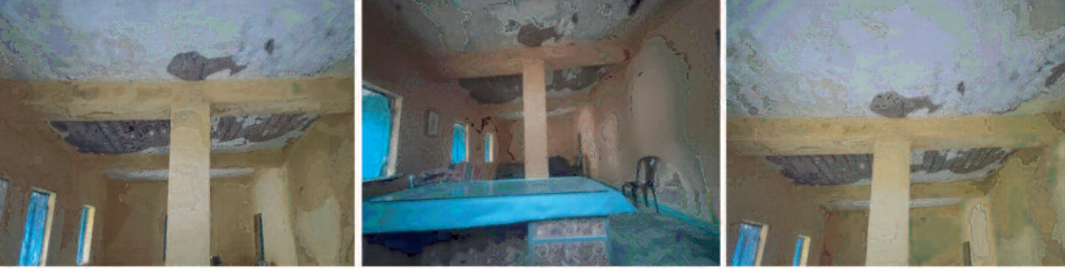
जर्जर ग्राम पंचायत भवन

पंचायत भवन का हाल देखते हुये पंचायत प्रतिनिधि इसे बंद रखते हैं और कोई बैठक आयोजित नहीं की जाती है। पंचायत भवन की खतरनाक स्थिति को देखते हुए पंचायत प्रतिनिधि वेबस हैं। कई बार नया पंचायत भवन बनाने के लिए आवेदन भी दिये, नए भवन की स्वीकृति नहीं मिली और