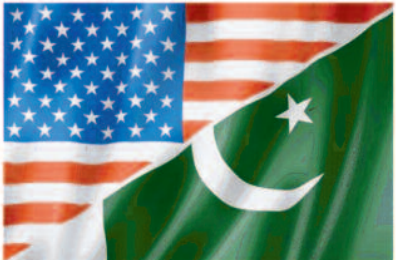
पाकिस्तान के जियो न्यूज द्वारा जारी रिपोर्ट के मुताबिक यह दूसरी बार है जब दोनों शीर्ष अधिकारियों ने फोन पर बातचीत की। आखिरी बार दोनों के बीच जनवरी माह में बात हुई थी। हालांकि पाकिस्तानी सेना की मीडिया शाखा इंटर-सर्विसेज पब्लिक रिलेशंस ने अभी तक इस बातचीत के संबंध में कोई बयान जारी नहीं किया है।