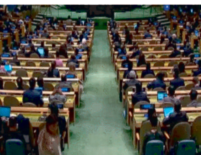
गायब करने और पेशान करने जैसी हरकतें भी होती हैं।