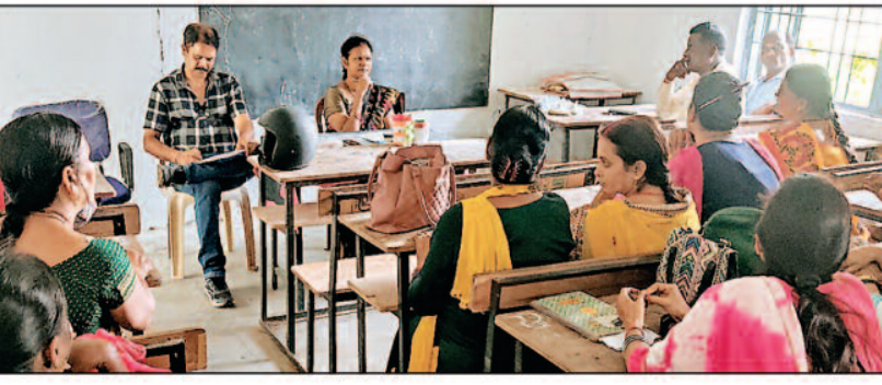
-संवाददाता- सूरजपुर, 04 अक्टूबर 2023 (घटती-घटना)।

बेहतर प्रदर्शन के लिए शिक्षकों को प्रेरित एवं प्रोत्साहित करने हेतु संकुल स्तरीय शिक्षा गुणवत्ता समिति का हुआ गठन