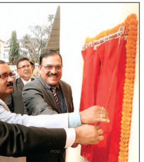
पेश होने वाले बर्दियों, अधिवक्ताओं एवं न्यायिक अधिकारियों कर्मचारियों को प्रत्येक कार्य दिवस में निःशुल्क चिकित्सा सुविधा उपलब्ध होगी। इसके अतिरिक्त माननीय न्यायमूर्ति द्वारा जिला एवं सत्र न्यायालय परिसर सूरजपुर स्थित नवनिर्मित लोक अभियोजक, शासकीय