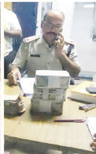
रोक कर चेक किया गया जो वाहन में एक व्यक्ति बैठा मिला नाम पता