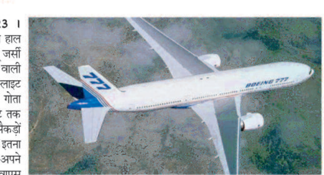
बजे नेवाका लिबर्टी इंटरनेशनल एयरपोर्ट से उड़ान भरी और मध्य रात्रि 12:27 वापस एयरपोर्ट पर उतरी।

नेवाका, 15 सितंबर 2023 | अमेरिका में एक फ्लाइट के साथ हाल ही में डरावना घटनाक्रम हुआ। न्यू जर्सी के नेवाका एयरपोर्ट से उड़ान भरने वाली यूनाइटेड एयरलाइंस की एक फ्लाइट महज 10 मिनट के अंदर ही गोता लगाते हुए हवा में 28,000 फीट तक नीचे आ गई। इतना ही नहीं, सैकड़ों यात्रियों को ले जा रहा यह विमान इतना नीचे आने के बाद अचानक अपने रास्ते से पलटा और यात्रियों को वापस नेवाका एयरपोर्ट पर ले गया।