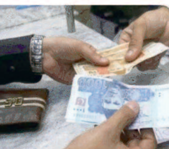
डॉलर के मुकाबले पाकिस्तानी रुपये की कीमत में रिकॉर्ड गिरावट सहित जीवन यापन की बढ़ती लागत के विरोध में व्यापारियों की हड़ताल के बाद हुई थी। मौजूदा आर्थिक संकट के कारण बड़े पैमाने पर महंगाई बढ़ी

आतंकवाद को रोकने के लिए क्या कर रही है। सरकार को आईबी की रिपोर्ट महत्वपूर्ण है क्योंकि इस महीने की शुरुआत में पाकिस्तान में सेना की महत्वपूर्ण भूमिका का संकेत देते हुए सेना प्रमुख जनरल असीम मुनीर ने कारोबारी समुदाय के साथ कई बैठकों की थीं और नकदी संकट से जुड़े देश में अरबों डॉलर का विदेशी निवेश लाने के लिए हरसंभव प्रयास करने का वादा किया था। यह बैठक ईंधन और बिजली बिलों में भारी वृद्धि और अमेरिकी