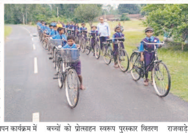
बच्चों को प्रोत्साहन स्वरूप पुरस्कार वितरण राजवाड़े व नान दईया सक्रिय रहे।

अपनाने हेतु शपथ ग्रहण, विद्यालय परिसर की स्वच्छता, सार्वजनिक हेडपंप, प्राथमिक स्वास्थ्य केंद्र व विद्यालय के बाह्य परिवेश, फुटबॉल मैदान की साफ सफाई, व्यक्तिगत स्वास्थ्य परिचर्चा, स्वच्छता को प्रेरित करता चित्रकला, पेंटिंग-पोस्टर निर्माण कार्य, हस्त प्रशालन कार्य, सायकल रैली निकालकर आमजन को स्वच्छता अपनाने, स्वच्छ रहने हेतु प्रेरित करने का कार्य किया गया। स्वच्छता पखवाड़ा के समापन कार्यक्रम में