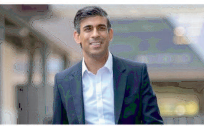
द्वारा देखे गए वीडियो पर देश की भयावहता को साझा कर रहा है। कल हमने एक और संदिग्ध एक्सएल बुली कुत्ते के हमले को

कुत्ते की नस्ल को परिभाषित करने और प्रतिबंधित करने के लिए तत्काल काम करने का आदेश दिया है। यह मुद्दा पिछले हफ्ते तक से सुर्खियों में है जब बर्मिंघम में इसी नस्ल के कुत्ते के हमले में 11 साल की एक लड़की गंभीर रूप से घायल हो गई थी। 10 डार्जनिंग स्ट्रीट पर रिकॉर्ड किए गए संदेश में सुनक ने कहा, अमेरिकी एक्सएल बुली वाला कुत्ता हमारे समुदायों, विशेष रूप से हमारे बच्चों के लिए खतरा है। उन्होंने कहा, मैं हाल ही में हम सभी