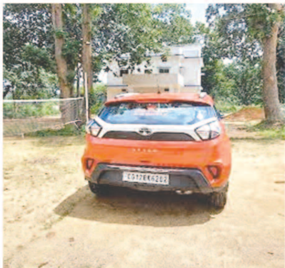
6202 को थाना उदयपुर के सामने मुख्य मार्ग पर पहुंचने पर वाहन को