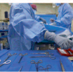
प्रत्यारोपण भी किया था। उनके अनुसार, अध्ययन के दौरान एकत्र किए गए ऊतक ने संकेत दिया कि एक हल्की अस्वीकृति प्रक्रिया शुरू हो गई थी, जिसके लिए इम्यूनोसप्रेसन दवा की आवश्यकता थी। अल्फा-गैल नामक बायोमोलेक्यूल के लिए जिम्मेदार जीन को बाहर निकालकर - मानव एंटीबॉडी को घुमाने के लिए एक प्रमुख लक्ष्य - एनवाइयू लैंगोन टीम तत्काल अस्वीकृति को रोकने में सक्षम थी। इस प्रयोग में दाता सूअर वर्जीनिया स्थित बायोटेक कंपनी रैविक्वोर द्वारा खेती किए गए झूंड से आया था।