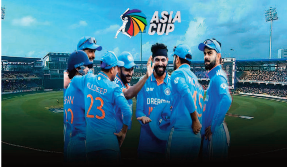
टीम इंडिया के नाम सबसे बड़ा स्कोर बनाने का रिकॉर्ड प्रेमदासा स्टेडियम के वनडे इतिहास में

नई दिल्ली, 07 सितम्बर 2023। एशिया कप के सुपर-4 के मुकाबले में 10 सितंबर को भारत बनाम पाकिस्तान के बीच कड़ी पिंडट होगी। ये मुकाबला कोलंबो के आर प्रेमदासा स्टेडियम में खेला जाएगा। वहीं भारतीय टीम के आर प्रेमदासा स्टेडियम में आंकड़े अच्छे हैं। इस स्टेडियम में भारतीय टीम के नाम वनडे में सबसे बड़ा स्कोर बनाने का रिकॉर्ड भी है। भारत और पाकिस्तान इस टूर्नामेंट में दूसरी बार एक-दूसरे से पिंडट रहे हैं। हालांकि, इससे पहले केंडी में खेले गए दोनों देशों का मुकाबला बारिश की भेंट चढ़ गया था। लेकिन उस मुकाबले में पाकिस्तान गेंदबाज टीम इंडिया के टॉप ऑर्डर पर भारी पड़े थे। वहीं कोलंबो के स्टेडियम में भारतीय टीम का पुराना रिकॉर्ड काफी मजबूत है।