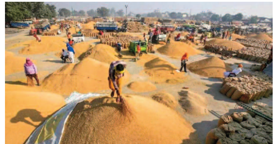
5 साल तक 300 रुपये बोनस देगे, पहले मोदी ने वायदा किया था। 2022 बीत गया किसानों की आय बढ़ने के बजाये घट गयी।

रीढ़ किसान होते है। इस हेतु प्रदेश सरकार किसानों के हितों को लेकर गंभीरता से कार्य कर रही है। जनहितकारी योजनाओं से किसानों को आर्थिक रूप से मजबूत बना रही है। समर्थन मूल्य पर धान खरीदी की सीमा बढ़ाने से छोटे-बड़े सभी किसानों को लाभ होगा। किसानों के आय में वृद्धि होगी, उनका आर्थिक व सामाजिक विकास होगा।