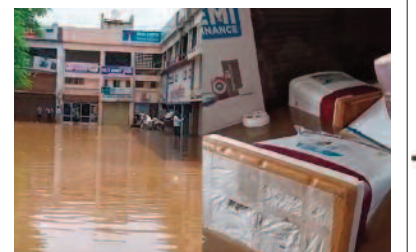
की गुंजाइश देखते हुए कारोबारियों ने निगम को व्यवस्था करने की गुहार लगाई थी। रातभर हुई बारिश कुछ देर के लिए रुक और फिर आज सुबह से रफ़्तार पकड़ ली।

दुर्ग/भिलाई, 07 सितम्बर 2023(ए)। दुर्ग और भिलाई में महज चंद्र घंटों की बारिश में नगर का न्यूनतम परिसर आकाशगंगा जलमग्न हो गया है। शॉपिंग कॉम्प्लेक्स की ग्राउंड फ्लोर की सभी दुकानें पानी में डूब गई हैं। रातभर की तेज बारिश से दुकानदारों को लाखों रुपये का नुकसान पहुंचा है। खासकर इलेक्ट्रॉनिक और हॉम एप्लायंस वाले कारोबारियों ने जब दुकान सभों महंगे सामान पानी में तैरते मिले। दुकान खोलते ही बारिश के पानी में तैरते ऐसी, फ्रिज, टीवी और पंखे समेत अन्य इलेक्ट्रॉनिक आइटम का ख़राब होना तय है। जानकारी के मुताबिक आकाशगंगा कॉम्प्लेक्स में पानी भरने