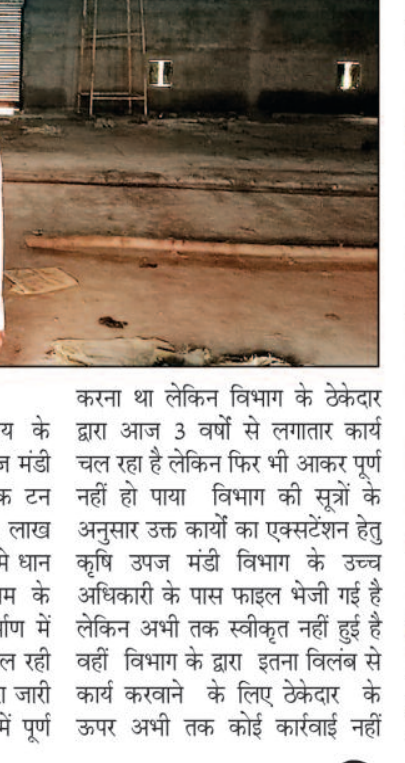
जिम्मेदार खुद भी हैं। प्रतापपुर विकासखंड मुख्यालय के करीब नर्सरी रोड में कृषि उपज मंडी विभाग द्वारा दस हजार मैट्रिक टन क्षमता वाले तीन करोड़ 75 लाख के लागत से वर्ष 2021-22 में धान संग्रहण और एफसीआई गोदाम के चावल रखने वाले गोदाम निर्माण में भारी अनीमियता देखने को मिल रही है कृषि उपज मंडी विभाग द्वारा जारी निविदा में किस कार्य को 9 में पूर्ण

-सोनु कश्यप- प्रतापपुर, 07 सितम्बर 2023 (घटती घटना) जो काम नौ महीने में पूरा करना था वह तीन साल में भी पूरा नहीं हो सका है, हम बात कर रहे हैं कृषि उपज मंडी बोर्ड द्वारा प्रतापपुर में बनाए जा रहे धान संग्रहण और चावल रखने के लिए गोदाम की दूसरी तरफ ठेकेदार द्वारा इतनी लेट लतीफी के बाद भी उसे संरक्षण दिया जा रहा है क्योंकि इसमें जिम्मेदार खुद भी हैं।