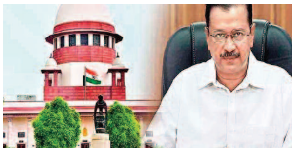
न्यायालय 29 अगस्त को लंबित याचिका पर फैसला करेगा, जबकि गुजरात विश्वविद्यालय का प्रतिनिधित्व करने वाले सॉलिसिटर

की मांग करने वाले आदेशों में हस्तक्षेप करने से इनकार कर दिया गया था। न्यायमूर्ति संजीव खन्ना और एस.बी.एन भट्टी की पीठ ने आदेश दिया, हम वर्तमान विशेष अनुमति याचिका में नोटिस जारी करने के इच्छुक नहीं हैं, क्योंकि मामला अभी भी उच्च न्यायालय के समक्ष विचारार्थ है और 29 अगस्त को सुनवाई के लिए तय है। सुप्रीम कोर्ट ने कहा कि उसे उम्मीद और भरोसा है कि गुजरात उच्च