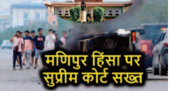
मणिपुर हिंसा पर सुप्रीम कोर्ट सख्त

नई दिल्ली, 25 अगस्त 2023 (ए)। उच्चतम न्यायालय ने मणिपुर हिंसा मामले में निष्पक्ष सुनवाई के मद्देनजर पीठों को अलग गवाह की सुरक्षा सुनिश्चित करने के लिए केन्द्रीय जांच ब्यूरो (सीबीआई) द्वारा की जा रही 21 मामलों की जांच असम में नामित न्यायाधीशों के एक समूह को स्थानांतरित का शुक्रवार को आदेश दिया। मुख्य न्यायाधीश डी वाई चंद्रचूड़ की अध्यक्षता वाली पीठ ने दिल दहलाने वाली मणिपुर हिंसक घटनाओं बाद दायर की गई याचिकाओं को सुनवाई के बाद अंतरिम आदेश पारित किया। पीठ ने गुवाहाटी उच्च न्यायालय से अनुरोध है कि ऐसे न्यायाधीशों का चयन किया जाए जो मणिपुर में प्रचलित एक से अधिक भाषाओं में पारंगत हों।