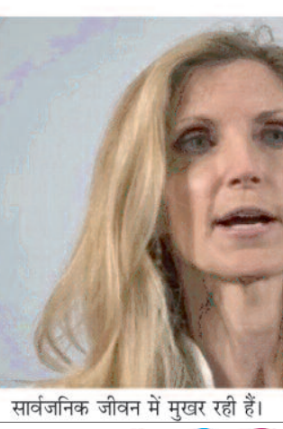
सार्वजनिक जीवन में मुखर रही हैं। मीडिया रिपोर्ट में कहा गया है कि