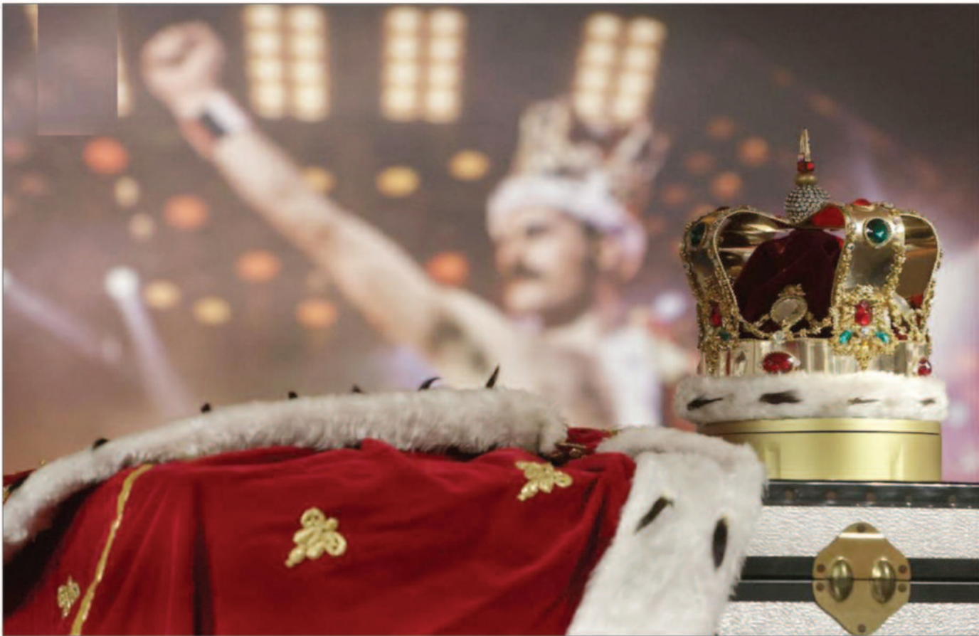
लंदन में फेडी मरक्व्यूरी सिंगेचर क्राउन और केप को एक वर्ल्ड ऑफ हिज ओन के प्री-व्यू में दिखाया गया।