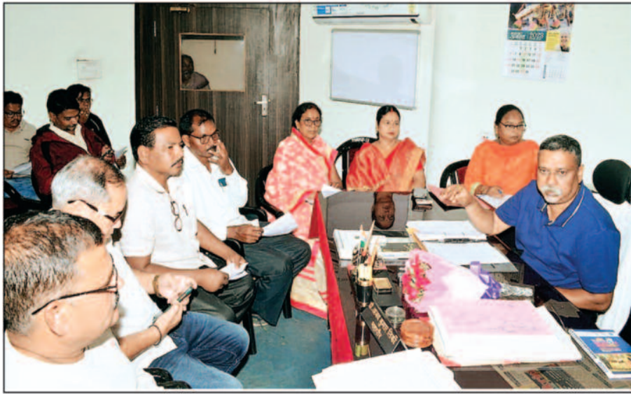
वहीं निकाय के चतुर्थ श्रेणी सांख्येतर पदों के नियमित पद में परिवर्तन करने एवं सफाई कामगार के पदों को ड्राई कैडर घोषित किया गया है। इन पदों को पुनः नियमित वेतनमान में पुनर्जीवित करने को लेकर निर्णय

मेयर इन काउंसिल की बैठक शुरुवार को नगर निगम स्थित महापौर कक्ष में आयोजित हुई। महापौर डॉ. अजय तिकी की अध्यक्षता में आयोजित बैठक में 31 एजेंडों पर विचार विमर्श व निर्णय लिया गया। महापौर डॉ. अजय तिकी की अध्यक्षता में मेयर इन काउंसिल की बैठक शुरुवार को आयोजित की गई। बैठक में इंदिरा गांधी राष्ट्रीय वृद्ध पेंशन, विधवा पेंशन एवं सुखद सहारा पेंशन योजना, राष्ट्रीय परिवार सहायता योजना, मुख्यमंत्री वृद्धजन पेंशन एवं मुख्यमंत्री विधवा पेंशन योजना सहित कुल 31 एजेंडों पर चर्चा व विचार विमर्श किया गया।