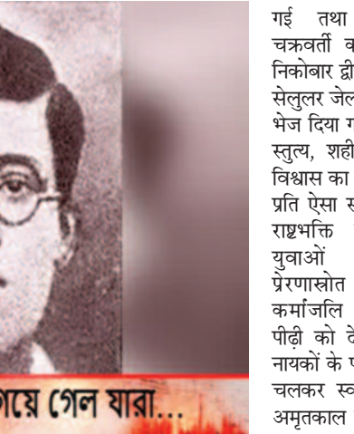
कान्सिर मरके गेये गेन यारा...

प्रोतिलता से उनसे मिलने जाने के लिए कहा गया। वे फाँसी की प्रतीक्षा करते रामकृष्ण विश्वास से उनकी बहन बन कर लगभग 40 वार मिलीं और रामकृष्ण और उनके क्रांतिकारी विचारों से अत्यंत प्रभावित हुईं। इसी संपर्क ने उनके मन में देश की आजादी के लिए सशस्त्र क्रांति का मार्ग अपनाने का विचार उत्पन्न कर दिया। 4 अगस्त 1931 में रामकृष्ण विश्वास को अलीपुर सेन्ट्रल जेल में फाँसी दे दी