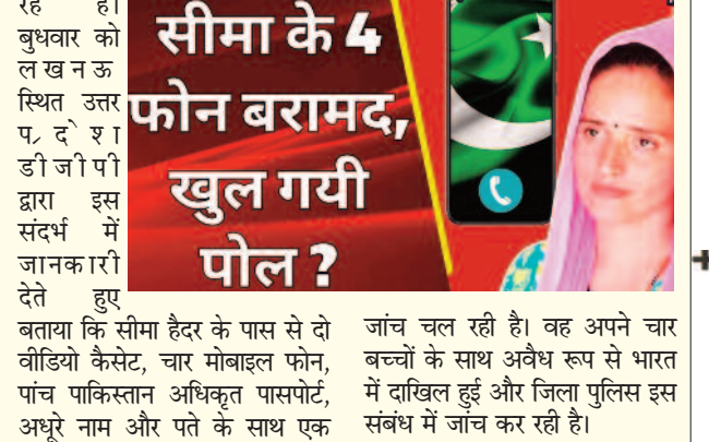
सीमा के 4 फोन बरामद, खुल गयी पोल ?

अप्रयुक्त पासपोर्ट और आईडी कार्ड बरामद किया गया है। उत्तर प्रदेश के डीजीपी कार्यालय ने एक संक्षिप्त नोट जारी करते हुए बताया कि इसकी जांच में हर रोज नए खुलासे हो रहे हैं।