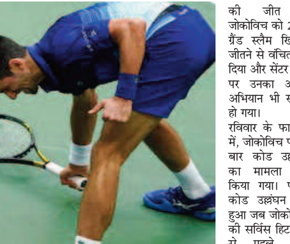
की जीत ने जोकोविच को 24वां ग्रैंड स्लैम खिताब जीतने से वंचित कर दिया और सेंटर कोर्ट पर उनका अजेय अभियान भी समाप्त हो गया। रविवार के फाइनल में, जोकोविच पर दो बार कोड उल्लंघन का मामला दर्ज किया गया। पहला कोड उल्लंघन तब हुआ जब जोकोविच की सर्विस हिट होने से पहले शांट कर दिया। दूसरा उल्लंघन तब आया जब वह पांचवें सेट में ब्रेक से पिछड़ने के बाद उन्होंने अपने रैकेट को नष्ट कर दिया। मैच के बाद, जब जोकोविच से उनके दो कोड उल्लंघनों के बारे में पूछा गया तो उन्होंने कहा, इसके बारे में बात करने के लिए ज्यादा कुछ नहीं है। दूसरा (उनका दूसरा कोड उल्लंघन) निराशा थी। दूसरे गेम में मेरे पास ब्रेक पॉइंट था। हां, बस कुछ कठिन अंक। सर्बियाई खिलाड़ी को 2020 यूएस ओपन से कुख्यात रूप से अयोग्य घोषित कर दिया गया था, जब उन्होंने राउंड 16 के मुकाबले के दौरान हताशा में एक गेंद को मारा था, गेंद गलती से एक लाइन जज के गले में लग गई थी।