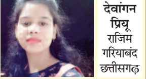
प्रिया देवगन प्रि्यू राजिव गिरियामद छत्तीसगढ़

रिमझिम बारिश की ये बूँदें, धरती पर आती। नयी कोपलें विकसित होतीं, रहती हरियाली। कल कल करती नदिया बहतीं, होकर मत्वाली। झड़ी लगी है ये सावन की, बाँछरें लाती। भोर सूर्य से फैली लाली, छँटती अधीरानी। स्वर्ण चमक ये निर्मल जल की, लाती किन्हीं प्याँटी। ठंडी ठंडी सी पूरवाई, हमें मुदुवाती। कलौ पुष्प की खिलने लगती, रमणीक बगीचे। मिट्टी की वो सौँधी सौँधी, क्याँरी के नीचे। इन अनुपम मोहक फूलों से मस्त महक आती। नमन करूँ ये दृश्य देखकर, मुझे मिला जीवन। देख धरा अनुराग बढ़ा है, धन्य हुआ तन मन। इक दूजे का साथ निभाना, यह हमें सिखाती।