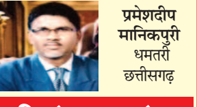
प्रेमशेदीप मांकपुुरी धमरती छत्तीसगढ़

जिसने जन्म दिया उसका मान नहीं है क्या? ममता की कंही सम्मान नहीं है जिसके लिए यह कैसे व्याधिचारी है औरत को औरत होने की लाचारी है खूब लोहार नारीवाद के नारे सभी क्या सम्मान दे पाये न उन्हें अभी क्या? वो जीने के अधिकारी नहीं है औरत को औरत होने की लाचारी है औरत को औरत होने की लाचारी है क्यों खरते उनके प्रति दुर्व्यवहार है घाल लगाकर बैठे क्यों शिकारी है औरत को औरत होने की लाचारी है क्यों उनको सब अधिकार देते नहीं बराबर का अधिकार क्यों देते नहीं क्यों कहलाईं जरा रही वह बेचारी है औरत को औरत होने की लाचारी है अब सम्मान और समता से जीये क्यों जीवन भर वह विष को पिपे स्वाभिमान से जीने के अधिकारी हैं समता, स्वभिमान के वो अधिकारी है।