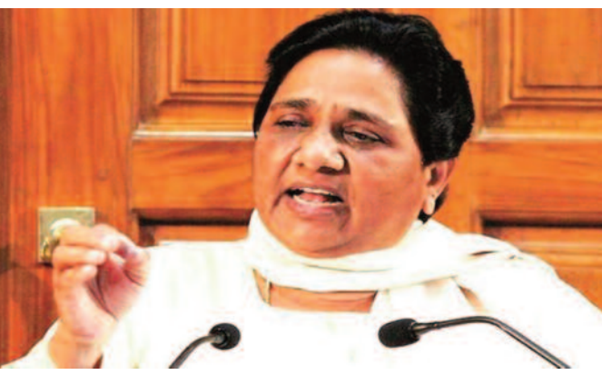
सत्ताधारी पार्टी के कथनी और करनी में ज्यादा अंतर नहीं प्रेस कॉन्फ्रेंस को संबोधित करते हुए

आने का सपना देख रहा। कांग्रेस पर हमला बोलते हुए मायावती ने कहा कि कांग्रेस सत्ता में आने के लिए गठबंधन कर रही है। वह जातिवादी दलों के साथ गठबंधन कर रही है। मगर हम अपने दम पर लोकसभा और विधानसभा का चुनाव लड़ेंगी। बसपा सुप्रीमो ने राजस्थान, मध्य प्रदेश, छत्तीसगढ़, तेलंगाना में अकेले चुनाव लड़ने की बात कही। इसके अलावा उन्होंने कहा कि पंजाब और हरियाणा में हम साथी दलों के साथ चुनाव लड़ेंगे। उन्होंने कहा कि सत्ताधारी पार्टी के कथनी और करनी में ज्यादा अंतर नहीं है।