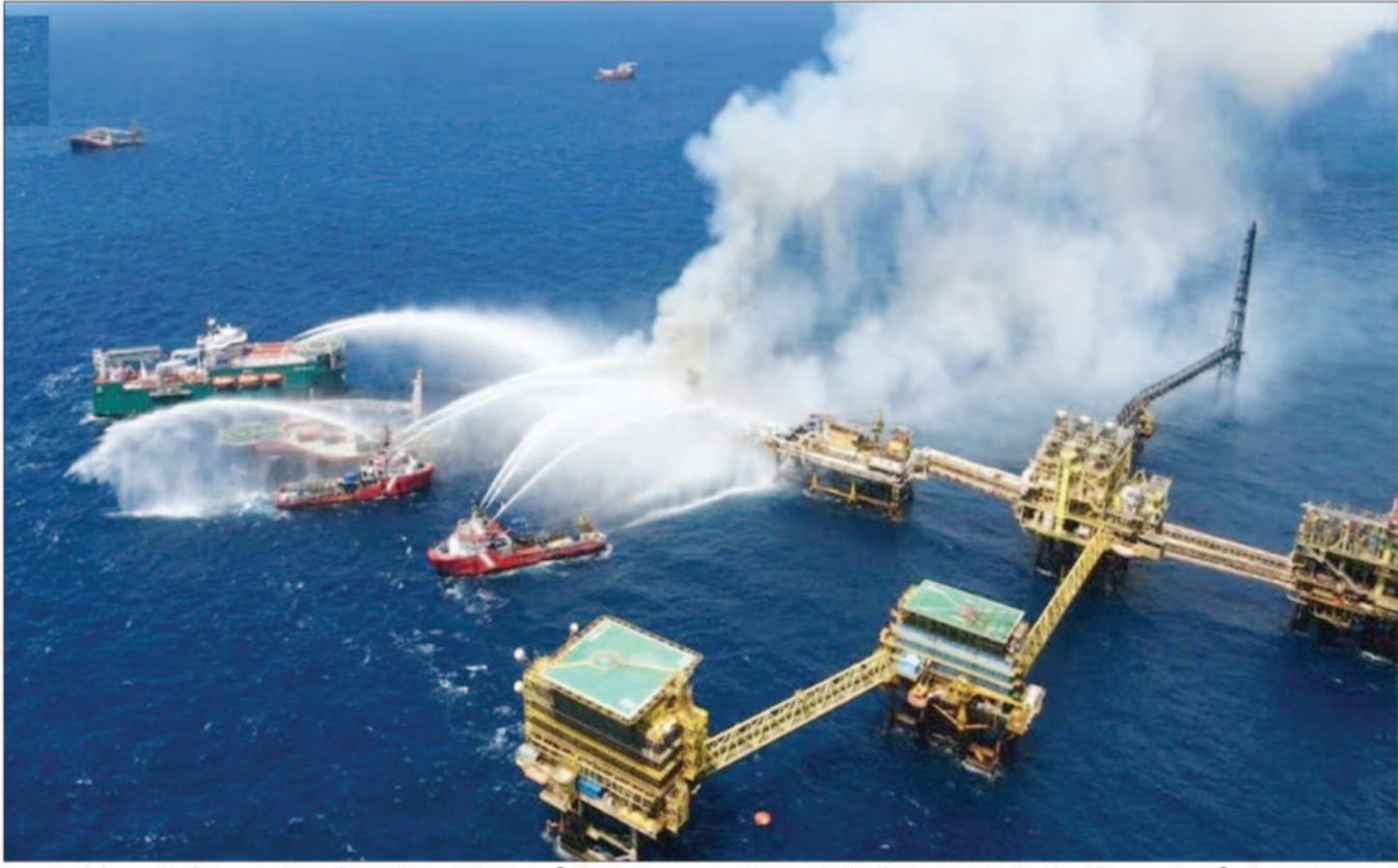
मैक्सिको में एक ऑफशोर ऑयल प्लेटफार्म में लगी आग को बुझाने के लिए पानी की बौछारें करती हुई नौकाएँ।