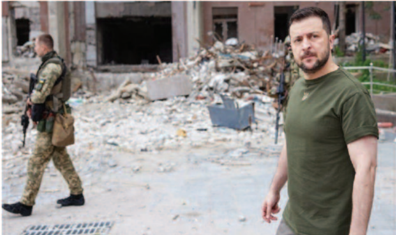
वायरल हो गया जिसमें यूक्रेनी सैनिकों को रूस के हमलावर युद्धपोत के चालक दल से यह कहते हुए सनना गया कि वे अपने आत्मसमर्पण की मांग कर रहे थे। यूक्रेनी सैनिकों को बंदी बना लिया गया लेकिन बाद में उन्हें रूसी बंदी से बदल दिया गया। कोव ने पिछले साल जून में द्वीप पर दोबारा कब्जा कर लिया।

इस्लामाबाद (एजेंसी)। रूस और यूक्रेन के बीच करीब 17 महीने से जंग जारी है। 24 फरवरी 2022 को इस जंग की शुरुआत उस वक्त हुई थी जब रूसी राष्ट्रपति व्लादिमीर पुतिन ने यूक्रेन के खिलाफ अपनी सेनाओं को विश। सैन्य ऑपरेशन करने का आदेश दिया था। व्लोडिमिर जेलैंस्की ने काला सागर द्वीप का दौरा किया जिसके रक्षकों ने आक्रमण की शुरुआत में एक रूसी युद्धपोत को ललकारा था। यूक्रेन पर मास्को का आक्रमण 500वें दिन तक पहुंच गया था। उन्होंने कहा कि आज हम स्नेक आइलैंड पर हैं, जिसे पूरे यूक्रेन की तरह कब्जा करने वाले कभी नहीं जीत पाएगी, क्योंकि हम बहादुरों का देश हैं। उन्होंने कहा कि मैं यहाँ इस विजय स्थल से इन 500 दिनों के लिए हमारे प्रत्येक सैनिक को धन्यवाद देना चाहता हूं।