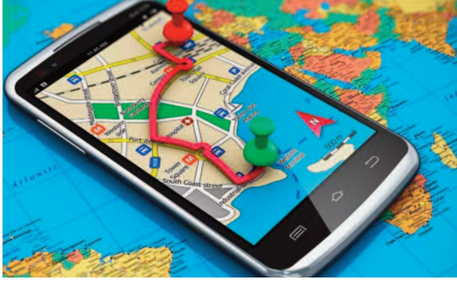
रूट के अलावा कहीं जाये तो ऑटोमैटिक अलर्ट आ जाए। इसके लिए कंट्रोल रूम में शिफ्ट