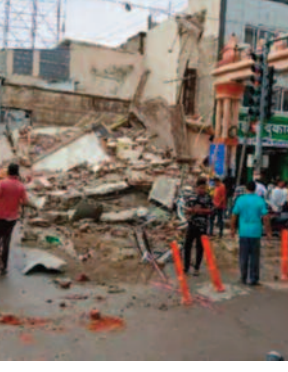
कहना है कि नाला निर्माण के चलते