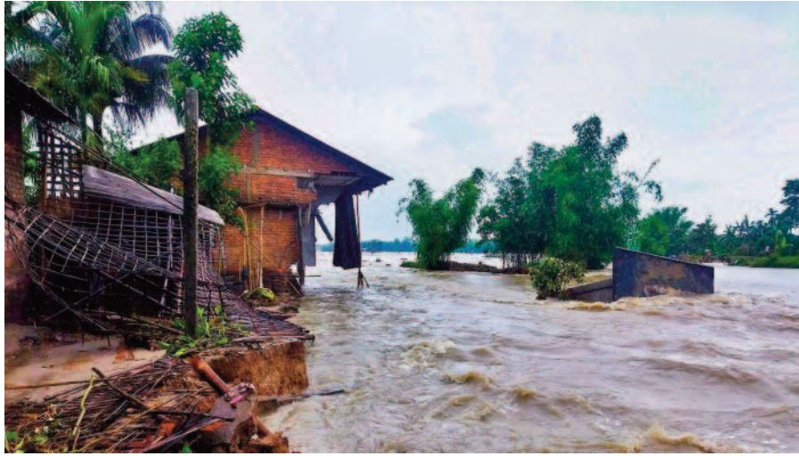
25,000 से अधिक लोग प्रभावित हुए हैं। प्रशासन ने पांच जिलों में 14 राहत शिविर बनाए हैं।

वहीं, असम राज्य आपदा प्रबंधन प्राधिकरण (एएसडीएमए) की बाढ़ रिपोर्ट के अनुसार बक्सा, बारपेटा, भारत मौसम विज्ञान विभाग (आईएमडी) ने 'ऑरेंज अलर्ट' जारी किया है। अगले कुछ दिनों तक असम के कई जिलों में 'अत्यंत भारी' से 'अत्यधिक भारी' बारिश का अनुमान जताया है। वहीं, गुवाहाटी में आईएमडी के क्षेत्रीय मौसम केंद्र (आरएमसी) ने शुक्रवार