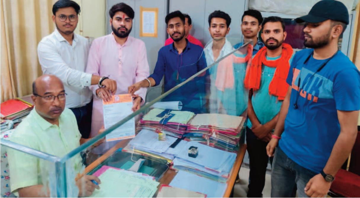
ऑफिशियल वेबसाइट नहीं है, जिसमें परिणाम घोषित किया जाए एक अन्य वेबसाइट के माध्यम से छात्रों द्वारा अपना परिणाम देखा जाता है और प्रत्येक छात्र का परिणाम उसका निजी होता है। पर उस थर्ड पार्टी वेबसाइट के माध्यम से किसी भी छात्र का सिर्फ नाम डालकर परिणाम देखा जाता है। जो कि बिल्कुल भी उचित नहीं है। संघ के द्वारा मांग किया जाता है कि विश्वविद्यालय एक ऑफिशियल परिणाम के लिए वेबसाइट बनाएँ जिस पर जाकर छात्र अपना परिणाम देख सकें। आजाद सेवा संघ द्वारा प्रदर्शन की चेतावनी देते हुए कहा कि जल्द से जल्द पूरे सभाग भर की परीक्षा परिणामों को घोषित किया जाए एवं अंतिम वर्ष के छात्रों का परिणाम पहले घोषित किया जाए और परिणाम घोषित करने के लिए एक ऑफिशियल वेबसाइट बनाया जाए। विश्वविद्यालय के कुलसचिव के द्वारा आश्वासन देते हुए कहा गया है। दोनों मांग पर उचित कवायद किया जाएगा और सोमवार से परिणाम घोषित होना जारी हो जाएगा।