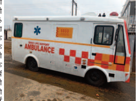
अस्पताल तक पहुंचाएगी। उक्त

-संवाददाता- सूरजपुर, 22 जून 2023 (घटती-घटना)। जिले को एक और लाइफ सपोर्ट एंबुलेंस की सौगात मिली है। एनएचआई नियम के अधीन प्रदत्त की गई है। जो पंचिरा टोल प्लाजा पर खड़ी रहेगी उक्त एंबुलेंस के मिलने से एन एच में गंभीर रूप से घायल व्यक्तियों के लिए मददगार साबित होगा। वाहन में घायलों को न केवल प्राथमिक उपचार होगा बल्कि उन्हें समुचित उपचार हेतु नजदीक के स्वास्थ्य केंद्र या जिला अस्पताल पहुंचाया जाएगा। उल्लेखनीय है की जिला मुख्यालय से महज 6 किलोमीटर की दूरी पर पंचीरा स्थित टोल प्लाजा को एक सर्व सुविधा उक्त लाइफ सपोर्ट एंबुलेंस वाहन की सौगात मिली है जो टोल के दोनों तरफ सड़क दुर्घटना में घायल लोगों की मदद करेगी वहीं गंभीर रूप से घायलों को इलाज हेतु लाइफ सपोर्ट सुविधा के साथ जिला अस्पताल तक पहुंचाएगी। उक्त