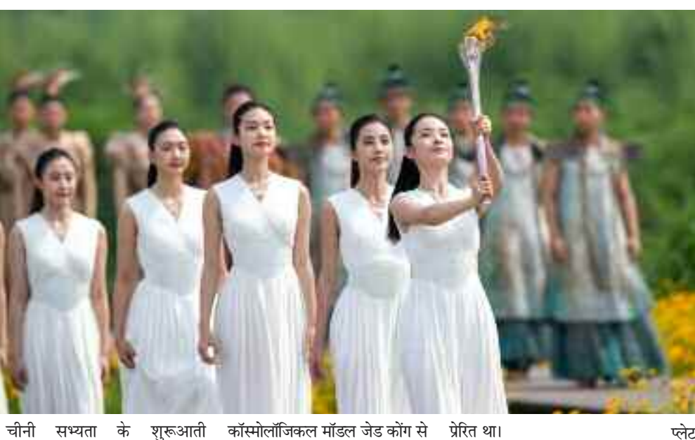
चीनी सभ्यता के शुरुआती कांसोलाईनिकल मॉडल जेड कॉंग से प्रेरित था।