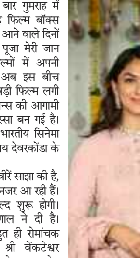
विजय देवरकोंडा की आगामी फिल्म का हिस्सा बनीं मृगाल ठाकुर

मृगाल ठाकुर को पिछली बार गुमराह में देखा गया था, लेकिन यह फिल्म बॉक्स ऑफिस पर औंधे मुंह गिरी। आने वाले दिनों में मृगाल लस्ट स्टोरी 2, पूजा मेरी जान और नानी 30 जैसी फिल्मों में अपनी मौजूदगी दर्ज करवाएंगी। अब इस बीच मृगाल के हाथ एक और बड़ी फिल्म लगी है। वह श्री वेंकटेश्वर क्रिएशंस की आगामी फिल्म एम्बलीसी54 का हिस्सा बन गई है। इसमें उनकी जोड़ी दक्षिण भारतीय सिनेमा के जाने-माने अभिनेता विजय देवरकोंडा के साथ बनी है। मृगाल ने इंस्टाग्राम कुछ तस्वीरें साझा की हैं, जिसमें वह विजय के साथ नजर आ रही हैं। इस फिल्म की शूटिंग जल्द शुरू होगी। इसकी जानकारी खुद मृगाल ने दी है। मृगाल ने लिखा, एक बहुत ही रोमांचक यात्रा में पहला कदम। श्री वेंकटेश्वर क्रिएशंस के साथ काम करने का यह मेरा पहला मौका है और मैं विजय देवरकोंडा के साथ स्क्रीन साझा करने के लिए वास्तव में रोमांचित हूँ। शूट शुरू होने का इंतजार नहीं कर सकती।