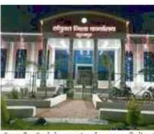
घटिया फर्नीचर मिलने से स्कूल प्रबंधन भी हैरान है और उनका कहना है कि इस तरह की गुणवत्ताहीन सामग्री का बच्चों को कम तक लाभ मिल पायेगा। फर्नीचर खरीदी कामें जो लेकर विभागीय अधिकारियों-कर्मचारियों के द्वारा शसन के किसी भी पार्टीड लाईन का पालन नहीं किया गया है और मानक के विपरीत खरीदी की गई है।

सभी जगहों पर अब भ्रष्टाचार दिखने लगा है केंद्रीय योजना भी शुरू हो गयी है पर वह भी भ्रष्टाचार की भेंट खड़े जाता है जिस वजह से बच्चों को उसका लाभ नहीं मिलता। मिली जानकारी के अनुसार शिक्षा विभाग में भी नियम और कानूनों का पालन किए चहेते फर्म से घटिया फर्नीचर की खरीद तबे दर पर कर शसन को चुन लाने और शोधार्थक समाधानों में घिल्लाड़ किये जाने का आरोप लगा जागियों ने प्रशसन में कार्यवाही को मांग की है। आरोप है कि शैक्षणिक सत्र 2022-23 में बंधित रूप से एक मंत्री के शैक्षणिक अनुसंधान पर चहेते फर्म को फर्नीचर सपलाई का ठेका दे दिया गए और फर्नीचर के बारे गुणवत्ता जांच व शैक्षणिक मूल्यवम के स्कूलों में सपलाई भी जाय दी गई। आरोप है कि जो फर्नीचर खूने जाजार में दो से तीन हजार रूपए में मिल जायंगा, वैसे फर्नीचर की बिलिंग सात से आठ हजार रूपए कर अवेध कमाई भी की गई है।