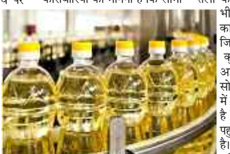
सीमा शुल्क घटाया, सस्ते होंगे खाद्य तेल

घरेलू और विदेशी खाद्य तेलों की कीमतों में पहले से ही चल रही गिरावट के बीच यह कदम उम्मीद से विपरीत है। कारोबारियों का मानना है कि सीमा