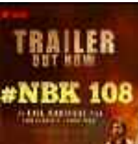
बालकृष्ण होंगे। कथानक के अनुसार, यह अपनी तरह का पहला एक्शन होने की उम्मीद है और कैप्शन आई डेन्ट केयर से प्रमुख व्यक्ति के अनर्गल रवैये का संकेत मिलने की उम्मीद है। घोषणा पोस्टर में, शीर्षक में भारत के राज्य प्रतीक (अशोक की शेर राजधानी) को दिखाया गया है। नायक बालकृष्ण की बात करें तो वह भूरे रंग का कुर्ता पहने हुए, गले में स्टोल के साथ फॉर्मल पैट और नमक-मिर्च वाला लुक पहने हुए दिखाई दे रहे हैं। बालकृष्ण एक एक्शन से भरपूर

अवतार में दिखाई देते हैं क्योंकि वह एक घातक हथियार के साथ पोज देते हैं। फिल्म एक्शन प्रेमियों के लिए एक ट्रिप होगी क्योंकि इसमें कुछ बड़े स्टैंड सीक्वेंस दिखाए जाने की उम्मीद है। फिल्म से जुड़े एक सूत्र ने इसके बारे में खुलासा करते हुए कहा, अनिल रविपुडी बालकृष्ण को फिल्म में पहले कभी न देखे गए गेट-अप और किरदार में पेश करना