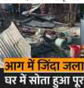
आग में जिंदा जला घर में सोता हुआ पूरा परिवार