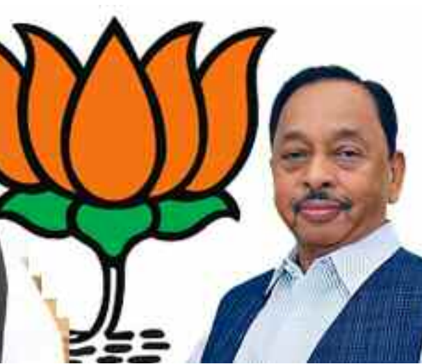
2008 से पार्टी की वरिष्ठ नेता हैं और उन्हें तमिलनाडु से मैदान में उतारा जा सकता है। लेकिन विदेश मंत्री एस. जयशंकर और अधिनी वैष्णव (रेल