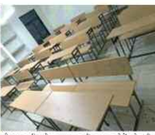
न इन फर्नीचरों का किसी राधम अधिकारी के द्वारा शैक्षणिक सप्लायायन किया गया है और न ही जिले के स्कूलों में मांग पत्र के अनुसार फर्नीचर सपलाई किया गया है। जानकारों का कहना है कि शासकीय विभागों में इस तरह के सपधानों की खरीदी या विक्री करने के लिए सबसे पहले बकाया अखबारों में प्रकाशित कर जान

मिलीभागत कर लखों रूपए का कमीशन वंदर कर लियो बताया जा रहा है कि जिले के प्राथमिक शालाओं के माध ही पूर्व मायामिक शालाओं में शैक्षणिक सत्र 2022-23 में फर्नीचर सपलाई करने के लिए खरीदसमूह शसन द्वारा 50 लाख से अधिक रूपए की स्वीकृति प्रदान की गई थी। जिसके तहत स्कूलों में कार्यालयीन व गैर कार्यालयीन कामों के लिए फर्नीचरों का सपलाई किया जाया था, लेकिन जिला शिक्षा अधिकारी कार्यालय में परदस्थ तत्कालीन अधिकारी-कर्मचारियों ने मिलीभागत कर घटिया सामग्री की खरीदी की और शसन को लखों रूपए का चुना लगा दिया। नाचिकों ने जिला प्रशासन से मांगते की सुधता में जांच कर लंबीकियों के विरुद्ध राधक्यायक कार्रवाही किए जाने को मांग की है। ऐसे तरह से हुआ अवेध कमाई का खेल आरोप है कि जिले के कई स्कूलों में