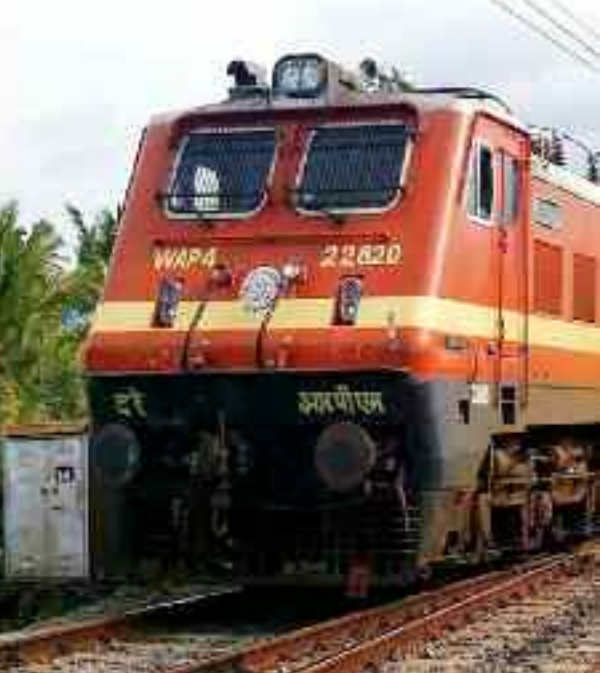
टीआरडी स्टाफ को अलर्ट किया जा रहा है। अरब सागर में उठे बिपरजॉय चक्रवात को लेकर गुजरात से लेकर मुंबई तक प्रशासन सतर्क है।

जोसीबी की व्यवस्था भी रहेगी। पुलों व ओवरब्रिज की निगरानी की जा रही है। बिपरजॉय चक्रवात तूफान को देखते हुए संरक्षा एवं सुरक्षा को ध्यान में रखते हुए रेलवे द्वारा रेलसेवा को आवागमन में 14 जून तक जोधपुर से व 15 जून तक गांधीधाम से रद्द किया गया है।