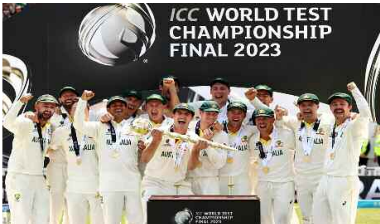
ऑस्ट्रेलिया में होगा।

ऑस्ट्रेलिया घर से दूर इस चक्र में नौ मैच खेलेंगी जिसमें न्यूजीलैंड और श्रीलंका के खिलाफ दो टेस्ट मैचों की श्रृंखला शामिल है। घर में, वे कुल 10 टेस्ट के लिए भारत (पांच), पाकिस्तान (तीन) और वेस्टइंडीज (दो) के खिलाफ खेलेंगे। भारत 2023-25 चक्र में 19 मैच खेलेंगी। टेस्ट के लिए मेन इन ब्लू का प्रभार वेस्टइंडीज में दो मैचों की श्रृंखला के साथ शुरू होगा। इसके बाद भारतीय दिसंबर 2023 और जनवरी 2024 में दो मैचों की प्रतियोगिता के लिए दक्षिण अफ्रीका की यात्रा करेंगे। इसके बाद जनवरी और फरवरी 2024 में इंग्लैंड के खिलाफ पांच मैचों की घरेलू श्रृंखला खेले जाएगी। भारत दो और तीन मैचों में बांग्लादेश और न्यूजीलैंड की मेजबानी करेगा। मेन इन ब्लू की अंतिम श्रृंखला अक्टूबर/नवंबर 2024 में ऑस्ट्रेलिया के खिलाफ