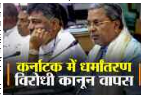
कर्नाटक में धर्मांतरण विरोधी कानून वापस

फिर से लागू करा सकते हैं। ये लोग अल्पसंख्यकों को वोट हासिल करने के लिए कुछ भी कर सकते हैं और सब चीजों को राजनीति से जोड़ देते हैं।' चर्चा है