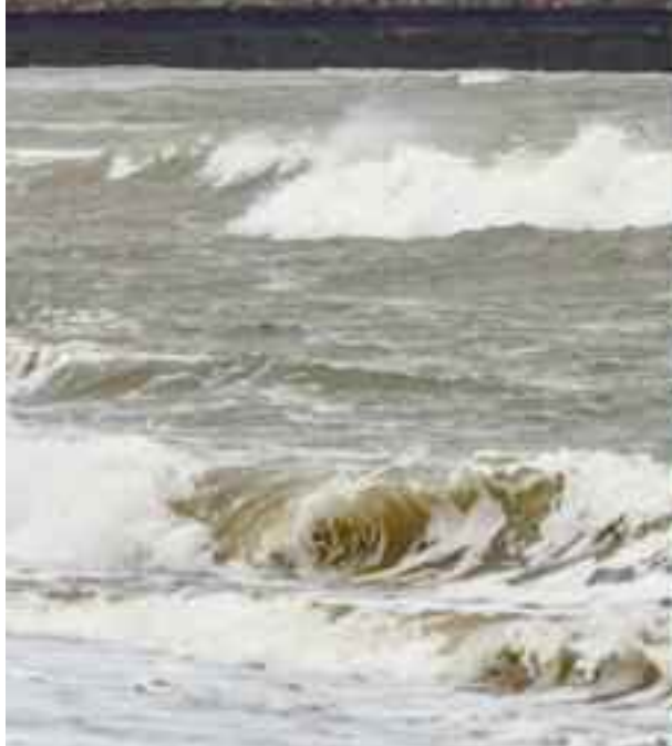
चक्रवात के कारण गांधीधाम एक्सप्रेस रद्द विशेष परिस्थितियों के मद्देनजर टीआरडी स्टाफ को अलर्ट किया जा रहा है। अरब सागर में उठे बिपरजॉय चक्रवात को लेकर गुजरात से लेकर मुंबई तक प्रशासन सतर्क है।

डीआरएम ने बताया कि आपदा प्रबंधन हेतु आरपीएफ, एनडीआरएफ व स्काउट एवं गाइड सक्रिय मोड पर रहेंगे तथा यात्रियों के लिए खानपान की स्टॉलें खुली रहेंगी और जरूरत पड़ने पर उनके गंतव्य स्थानों तक पहुंचाने के लिए रोडवेज से भी सहायता ली जा सकेगी। यात्रा के दौरान तेज हवाएं चलने पर यात्रियों से खिड़कियां खुली रखने और अतिरिक्त सावधानी