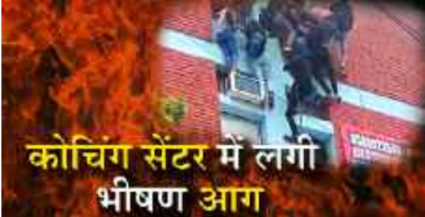
कोचिंग सेंटर में लगी भीषण आग

नई दिल्ली, 15 जून 2023(ए)। दिल्ली के मुखर्जी नगर इलाके के संस्कृति कोचिंग में आग लगने से अफरा-तफरी मच गई। बता दें कि मुखर्जी नगर में बत्रा सिनेमा के पास स्थित ज्ञान बिल्डिंग में आग लगने की सूचना मिलने के बाद दमकल की 11 गाड़ियां मौके पर पहुंचीं। पुलिस और दमकलकर्मियों ने तुरंत राहत एवं बचाव कार्य शुरू कर दिया। आग लगने के बाद छात्रों ने कोचिंग सेंटर की खिड़की से रिसियों के सहारे कूदकर अपनी जान बचाई। अपनी जान बचाते वक्त 4 छात्र घायल हो गए हैं। बताया जा रहा है कि आग शांति सेंटर की बजह से लगी है। आग पर काबू पा लिया गया है।