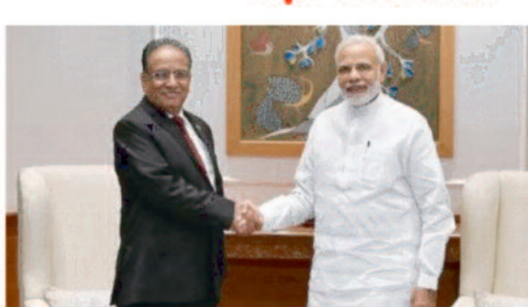
ऐसा संकेत देने से बचना चाहिए कि नेपाल सिर्फ दूसरे देशों से सिर्फ मदद मांगता है। बाकी नेताओं ने जो सुझाव भी दिए, उनमें भी क्लृप्त मिला कर इसी तरह की बातें थीं।

नेपाल के पूर्व प्रधानमंत्रियों ने मांग की है कि प्रधानमंत्री पुष्प कमल दहल अपनी अगली भारत यात्रा के दौरान प्रधानमंत्री नरेंद्र मोदी के सामने इमिग्रेट पर्सनस क्प (इपीजी) की रिपोर्ट को स्वीकार करने और दोनों देशों के बीच सीमा विवाद का मसला जरूर उठाएं। गणमान्य नागरिकों की समिति (इपीजी) दोनों के बीच संबंध की दिशा पर सुझाव देने के लिए 2018 में बनाई गई थी।