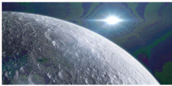
इन मिशन को चंद्रमा में सफलतापूर्वक किया जाएगा पूरा

बीजिंग, 29 मई 2023। चीन ने अंतरिक्ष क्षेत्र में सोमवार को बड़ा दावा किया है। चीन ने कहा है कि 2030 तक चंद्रमा पर अपने एस्ट्रोनॉट्स भेजने की तैयारी कर रहा है। पश्चिमी देशों के साथ अंतरिक्ष की लड़ाई में चीन का दावा काफी अहम माना जा रहा है। परमाणु और सैनिकों के बाद चीन अंतरिक्ष में भी अपनी ताकत दिखाने की तैयारी में जुट गया है।