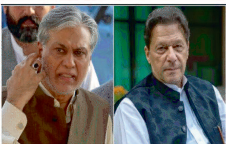
कि बातचीत नेताओं से होती है न कि आतंकवादियों से।

इस्लामाबाद, 29 मई 2023। पाकिस्तान में लगातार सियासी बवाल मचा हुआ है। इस बीच, पाकिस्तान के विरमंत्रि इशाक डार ने संकेत दिया है कि देश में जारी सियासी गतिरोध को दूर करने के लिए पूर्व प्रधानमंत्री इमरान खान से बातचीत कर सकते हैं। हालांकि, उन्होंने इसके लिए शर्त रखी है कि इमरान अपनी गलतियों को ठीक करने के लिए कदम उठाएं और नौ मई को हुई हिंसा के लिए देश से माफी मांगें।