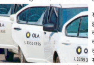
हालांकि, उन्होंने बुकिंग का एक स्क्रीनशॉट जरूर शेयर किया है। इसमें देखकर लगता है कि ओला की नई सर्विस के तहत ट्रिप की कीमत मिनी और प्लेटफॉर्म की दूसरी कैब के मुकाबले कम रह सकती है।