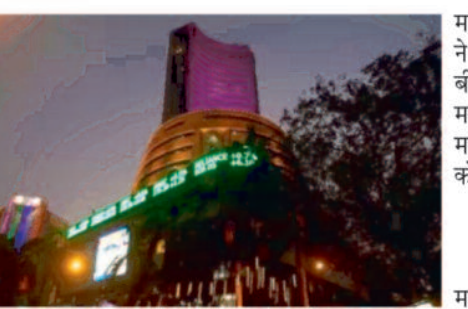
जनवरी में भारत को फ्रांस ने छोड़ा था पीछे दरअसल जनवरी 2023 में अडानी शेयरों की जबरदस्त गिरावट के बाद भारतीय शेयर बाजार को मार्केट कैपिटलाइजेशन में जोरदार गिरावट आई थी जिसके बाद भारतीय बाजार फ्रांस से पीछे हो गए थे। पर हाल में देखी गई अडानी शेयरों की रिकवरी से इंडियन स्टॉक मार्केट ने अपने खोया रूतबा हासिल कर लिया है और फिर से दुनिया का पांचवा सबसे बड़ा स्टॉक मार्केट हो गया है।

नई दिल्ली, 29 मई 2023। भारतीय शेयर बाजार के लिए आज फिर खुशी का दिन है और एक बार फिर बड़ा मुकाम देश के स्टॉक मार्केट ने हासिल कर लिया है। भारतीय शेयर बाजार एक बार फिर दुनिया का पांचवा सबसे बड़ा स्टॉक मार्केट बन गया है। ग्लोबल स्टॉक मार्केट की रैंकिंग में भारत ने फ्रांस को पीछे छोड़कर ये स्थान हासिल किया है। जनवरी में फ्रांस ने भारत को छठे स्थान पर पीछे छोड़ दिया था और पांचवें स्थान पर कब्जा कर लिया था।