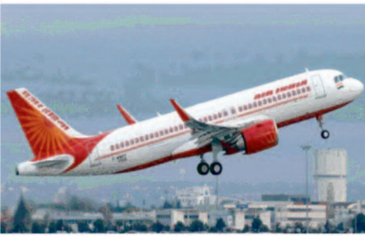
वर्तमान में, एयर इंडिया के पास 122 विमान हैं और वह अपने बेड़े का विस्तार कर रही है। एयरलाइन को इस साल के अंत तक छह A350 और आठ ए320X321 विमान मिलने की उम्मीद है। अब तक कंपनी ने 9 बी777 विमान लीज पर लिए हैं। फरवरी में, एयर इंडिया ने घोषणा की कि वह अलग-अलग सौदों के तहत यूरोपीय विमानन कंपनी एयरबस से 40 वाइड-बॉडी A350 विमानों सहित 250 विमान और

उन्होंने कहा कि भर्ती की यह गति इस वर्ष के अर्धवर्षीय समय तक जारी रहेगी और फिर इस वर्ष के अंत तक कम हो जाएगी। उनका कहना है कि इसके बाद 2024 के अंत तक ये फिर से तेज हो जाएगी।