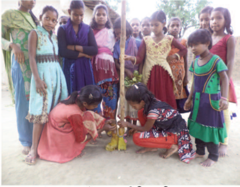
गंगा दशहरा में कठपुतली विवाह विवाह संपन्न कराया जाता है

छत्तीसगढ़ के सरगुजा अंचल में गंगा दशहरा का पर्व धूम-धाम से मनाया जाता है। सरगुजा वासियों की मान्यता है कि गंगा