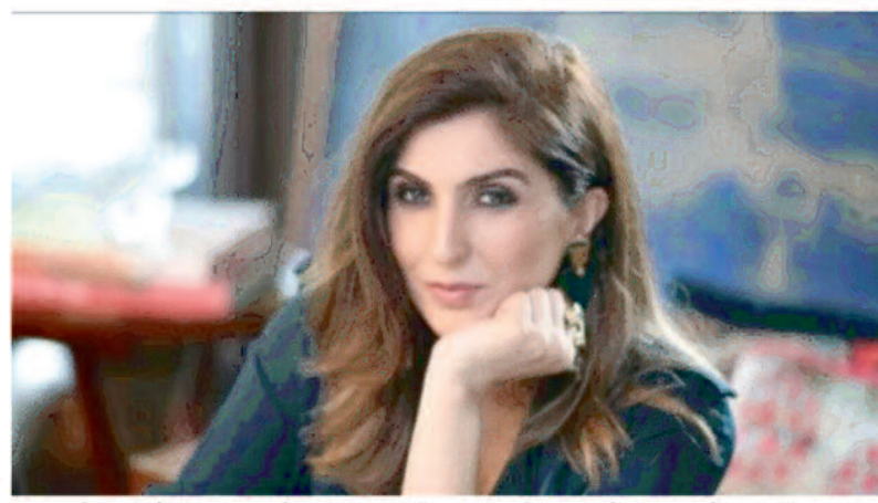
को हिंसा के लिए उकसाने सहित कुछ भी गलत करने से इनकार किया।

लगा दी थी और कई सैन्य प्रतिष्ठानों पर भी हमला किया था। पंजाब के अंतरिम मुख्यमंत्री मोहम्मिन नकवी ने पिछले हफ्ते घोषणा की थी कि सैन्य प्रतिष्ठान पर हमले के मामले में शामिल महिलाओं को हर कोमत पर गिरफ्तार किया जाएगा। 100% एक्सप्रेस टिब्यून 100% की खबर के मुताबिक, आत्मसमर्पण से कुछ दिन पहले सोशल मीडिया पर वायरल एक ऑडियो क्लिप में शाह को यह बताया हुआ सुना जा सकता है कि उनके परिवार को इन दिनों कितनी कठिनाइयों का सामना करना पड़ा है। उन्होंने स्वीकार किया कि वह पीटीआई की समर्थक हैं और लाहौर कोर कमांडर हाउस के बाहर प्रदर्शन का हिस्सा थीं लेकिन उन्होंने लोगों