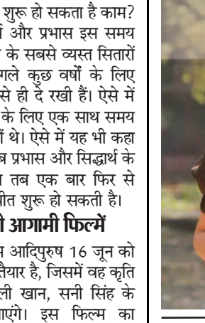
जॉन अब्राहम ने निखिल आडवाणी संग मिलाया हाथ, एवशन फिल्म में शरवरी वाघ संग देंगे दिखाई

प्रभास की आगामी फिल्में प्रभास की फिल्म आदिपुरुष 16 जून को रिलीज के लिए तैयार है, जिसमें वह कृति सैनन, सैफ अली खान, सनी सिंह के साथ नजर आएंगे। इस फिल्म का निर्देशन ओम राउत ने किया है, जिसका ट्रेलर 9 मई को रिलीज होने वाला है। इसके बाद वह प्रोजेक्ट के में दीपिका पादुकोण और अमिताभ बच्चन के साथ दिखेंगे। इस सबके अलावा वह एक फिल्म के लिए दिल राजू के साथ भी बातचीत कर रहे हैं। न्यूजवाइड्स प्लस पठान की सफलता के बाद से सिद्धार्थ अब एक्शन फिल्मों पर ज्यादा ध्यान दे रहे हैं। पीपिंगमून के अनुसार, वह नेटफ्लिक्स के साथ एक एक्शन फिल्म फंडेज की लिए भी हाथ मिला रहे हैं। इसके अलावा वह फाइटर और टाइगर वर्सेज पठान बनाएंगे।