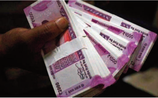
परेशान होने की जरूरत नहीं है। आप इन नोट को बैंक में वापस लौटा सकते हैं। बैंक आपको 2000 के नोट के

चाहिए। भारतीय रिजर्व बैंक के नए फैसले के मुताबिक ये नोट अब चलन में नहीं होंगे। 30 सितंबर 2023 के बाद ये नोट बैंक से जारी नहीं होंगे। अगर आपके पास है 2000 के नोट तो क्या करें? अभी आपको घराने की जरूरत नहीं है। 2000 के नोट को बंद नहीं किया गया है। इन नोटों को सिर्फ चलन से बाहर किया गया है। यानि इन नोट को धीरे-धीरे चलन से खत्म किया जाएगा। अगर आपके पास भी 2000 के नोट हैं तो आपको ज्यादा