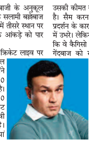
उसकी कीमत के आधार पर आंकना सही नहीं है। सैम करेन अंतरराष्ट्रीय क्रिकेट में अपने प्रदर्शन के कारण सबसे महाने खिलाड़ी के रूप में उभरे। लेकिन पंजाब के साथ समस्या यह है कि वे कैगिसो रबाडा जैसे अनुभवी और सिद्ध गेंदबाज को रख रहे हैं, जिन्हें टूर्नामेंट के अधिकांश भाग में डगआउट में बैठना पड़ा गया। इस बीच, राजस्थान रॉयल्स के स्टार स्पिनर युजवेंद्र चहल इस खेल में खुद को पंपल कैप लीडरबोर्ड के शीर्ष पर रखने का लक्ष्य रखेंगे। भारत के पूर्व क्रिकेटर हरभजन सिंह ने धीमी गेंदबाजी के मास्टर के रूप में भारत के कलाई के स्पिनर की

वह हिमाचल प्रदेश में बल्लेबाजी के अनुकूल ट्रैक पर पहुंचेंगे। बाएं हाथ के सलामी बल्लेबाज - जो ऑरेंज कैप लीडरबोर्ड में तीसरे स्थान पर हैं - सीजन में 600 रन के आंकड़े को पार करना चाहेंगे। सहवाग ने स्टार स्पॉटर्स के क्रिकेट लाइव पर कहा, -यशस्वी जायसवाल भविष्य के सितारे हैं। उन्होंने विराट कोहली से 50 को 100 में बदलने की कला सीखी है। कई बल्लेबाज 13 गेंदों में 50 रन बनाने के बाद अपने विकेट फेंकते हैं, लेकिन यशस्वी आगे बढ़ना चाहता है। उसके पास बड़ी पारियां खेलने का स्वभाव है। - मैच में एक और युवा प्रतिभा पंजाब किंग्स के ऑलराउंडर सैम करेन होंगे, जो आईपीएल 2023 के सबसे महाने खिलाड़ी भी हैं। इंग्लैंड के हरफनमौला खिलाड़ी कीमत पर खरा नहीं उतर पाने के कारण प्रशंसकों के निशाने पर रहे हैं, लेकिन भारत के पूर्व क्रिकेटर मोहम्मद कैफ ने %मूल्य टैग आलोचना को कमतर करके कहा कि पंजाब किंग्स खुद को इस तरह की स्थिति में पा रहा है। अंक तालिका में उनकी स्थिति खराब रणनीति के कारण है। कैफ ने कहा, -एक खिलाड़ी के प्रदर्शन को