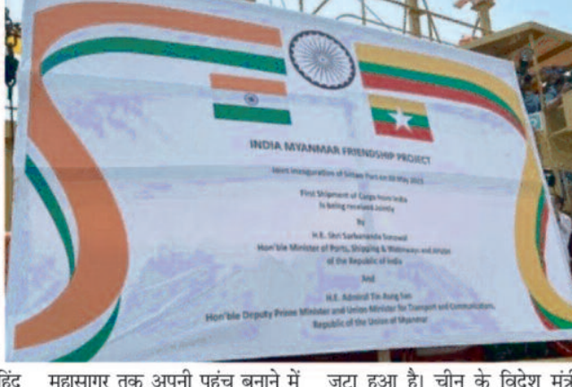
कलादान परियोजना के निर्माण के लिए भारत और म्यांमार के बीच 2008 में समझौता हुआ था। तब इस पर साढ़े 48 करोड़ डॉलर खर्च होने का अनुमान लगाया गया था। बंदरगाह के उद्घाटन के मौके पर भारत के अधिकारियों ने आशा जताई कि इससे देश के उत्तर-पूर्वी इलाके का हिंद महासागर से संपर्क बनेगा और उससे उस पूरे क्षेत्र के आर्थिक विकास का रास्ता खुलेगा। विश्लेषकों ने ध्यान दिलाया है कि चीन भी म्यांमार के रास्ते हिंद महासागर तक अपनी पहुंच बनाने में जुटा हुआ है। चीन के विदेश मंत्री

सितवे पोर्ट भारत के मल्टी-मॉडल ट्रांजिट ट्रांसपोर्ट प्रोजेक्ट का हिस्सा है। इस प्रोजेक्ट के तहत कोलकाता से म्यांमार के पश्चिमी तट तक समुद्री रास्ता तैयार किया गया है। उस जगह से जमीनी मार्ग से म्यांमार के अलग-अलग हिस्सों में माल पहुंचाने के रास्ते तैयार किए जा रहे हैं। इनमें एक रास्ता कलादान नदी के जरीए जाएगा, जबकि एक हाईवे भी बन रहा है। भारत के जहाजरानी मंत्री सर्वोदित सोनेवाल ने कहा है कि इस समुद्री मार्ग के तैयार होने से भारत के उत्तर-पूर्वी क्षेत्र का दक्षिण-पूर्व एशिया से सीधा संपर्क बन गया है।