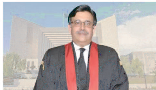
सम्मान सभी के लिए बराबर है। सभी को सम्मान और शिष्टाचार का पाने का पूरा अधिकार है।

नई दिल्ली, 16 मई 2023। पाकिस्तान के चीफ जस्टिस उमर अता बंदियाल के पूर्व प्रधानमंत्री इमरान खान को अभिवादन करने के बाद सुर्खियों में आ गए हैं। दरअसल, मंगलवार को सुप्रीम कोर्ट में इमरान खान को देखकर चीफ जस्टिस ने उन्हें कहा था कि आपको देखकर खुशी हुई। उनके इस बयान के बाद विपक्ष उनकी आलोचना कर रही है। अल-कादिर ट्रस्ट भ्रष्टाचार के मामले में कोर्ट में उनकी पेशी के दौरान चीफ जस्टिस ने ये टिप्पणी की थी। पीएम शहबाज शरीफ की उपस्थिति में एक संघीय कैबिनेट की बैठक के दौरान पीएम ने कहा कि पाकिस्तान तहरीक-ए-इसाफ पार्टी के प्रमुख को लेकर चीफ जस्टिस द्वारा ऐसी टिप्पणी करना देश के न्यायापालिका के ऊपर धब्बा लगाना है। आलोचनाओं के बाद चीफ जस्टिस बंदियाल ने अपनी सफाई में कहा, इमरान खान का अभिवादन करने के बाद मेरी हर तरफ आलोचना हो रही है। हालांकि, मैं हमेशा इसी बोल का उपयोग करता हूँ। उन्होंने आगे कहा, मैं सभी का इसी तरह से सम्मान करता हूँ, क्योंकि