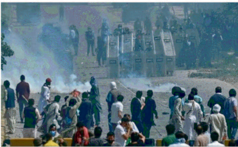
आजीवन कारावास की सजा का कारण बन सकते हैं। पाकिस्तानी सैन्य मुख्यालय हुए

नई दिल्ली, 16 मई 2023। पाकिस्तानी सेना के शीर्ष अधिकारियों ने रावलपिंडी में सेना के मुख्यालय पर हमला करने सहित सैन्य प्रतिष्ठानों पर हमलों के बारे में शामिल 40 उपद्रवियों पर पाकिस्तानी सेना अधिनियम और आधिकारिक गोपनीयता कानून समेत अन्य कानूनों के तहत कार्रवाई होगी। पिछले मंगलवार को इस्लामाबाद उच्च न्यायालय परिसर में रेंजर्स को और से पूर्व प्रधानमंत्री इमरान खान की गिरफ्तारी से पाकिस्तान में अशांति फैल गई थी जो शुक्रवार तक जारी रही। प्रदर्शनकारियों के हमलों के दौरान कई मौतें हुईं और दर्जनों सैन्य और सरकारी प्रतिष्ठानों को नष्ट कर दिया गया। देश के इतिहास में पहली बार खान के समर्थकों ने रावलपिंडी में