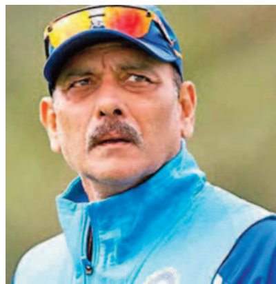
कोहली 2021 में इंग्लैंड के दौरे के दौरान भारत के टेस्ट कप्तान थे। उनकी कप्तानी में, भारत ने आगंतुकों