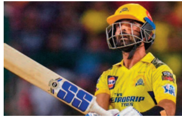
योजना के अनुसार नहीं होती है, और परिणाम से परेशान होना आकर्षक हो जाता है। हालांकि, मैंने सीखा है कि प्रतिक्रिया से चिपके रहना जरूरी है और परिणाम को हमारे ध्यान को प्रभावित नहीं करने देना चाहिए, दबाव को कैसे संभालते हैं और यह भी कि वह प्रशंसकों की अपेक्षाओं से कैसे निपटते हैं। प्रतिक्रिया से चिपके रहना न केवल क्रिकेट में बल्कि किसी भी क्षेत्र में आवश्यक है जो उत्कृष्टता की मांग करता है। यह हमें उन चीजों पर ध्यान केंद्रित करने में मदद करता है जिन्हें हम नियंत्रित कर सकते हैं और अपने कार्यों का स्वामित्व ले सकते हैं। जब हम प्रतिक्रिया पर ध्यान केंद्रित करते हैं, तो हम अभिभूत नहीं होते हैं। परिणाम से, और यह हमें अपने लक्ष्यों की दिशा में काम करते रहने के लिए प्रेरित करता है, अजिंक्य रहाणे ने कहा।

फिर उनके पास चले गए हैं और ऑस्ट्रेलिया के खिलाफ 7 जून, 2023 से खेले जाने वाले डब्ल्यूटीसी फाइनल के 15 सदस्यीय टीम में उनका नाम रखा है। यह महसूस किया है कि यात्रा हमेशा सुनम नहीं होती जैसे ही दाएं हाथ का भारतीय बल्लेबाज भारतीय टीम में लौटा, वह अपने लिंकडन प्रोफाइल पर गया और उसी के बारे में अपने विचार व्यक्त किए, एक पेशेवर क्रिकेटर के रूप में मेरे करियर में, मैंने महसूस किया है कि यात्रा हमेशा सहज नहीं होती है। ऐसे क्षण होते हैं जब चीजें