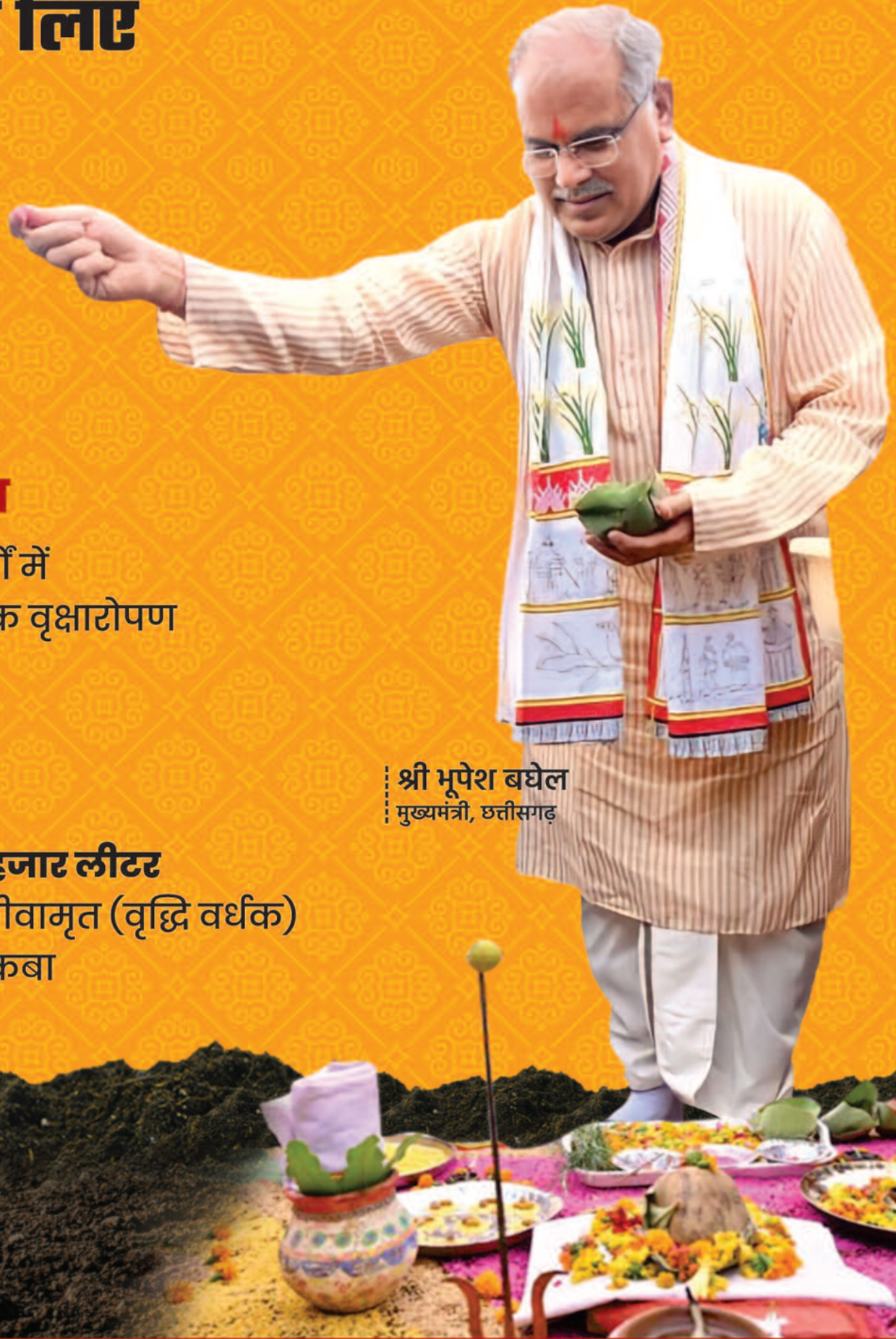
श्री भूपेश बघेल मुख्यमंत्री, छत्तीसगढ़

खरीदे गये गोबर व गौमूत्र से बनाई 23 लाख क्विंटल जैविक खाद और 85 हजार लीटर ब्रह्मास्त्र (जैविक कीट नियंत्रक) और जीवामृत (वृद्धि वर्धक) के विक्रय से बढ़ रहा जैविक खेती का रकबा