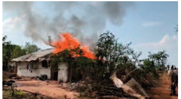
घर में आग लगाने वाले 5 शत्रु गिरफ्तार

पुलिस ने बिस्नपुर में घर को आग लगाने वाले 5 आरोपियों को गिरफ्तार किया है। इस ब्लॉक में आईजी आनंद खड्ग बाल-बाल बचे थे। पुलिस ने बताया कि 10.04.2023 को बीरनपुर गांव के एक मकान में दोपहर करीब 2:00 बजे अज्ञात लोगों ने आग लगा दी थी। इस घटना पर थाना साजा में अपराध क्रमांक 90/23 धारा 436,34 भादवी पंजीबद्ध कर विवेचना में लिया गया। तहकीकात के दौरान 5 आरोपियों की सिलसिला पाए जाने से प्रकरण में धारा 147, 148, 149 भादवी के तहत आरोपियों को गिरफ्तार किया गया है।