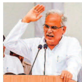
आरक्षण विधेयक पर हस्ताक्षर नहीं, सीएम भूपेश बघेल बोलें - जनता और युवा त्रस्त

रायपुर, 14 अप्रैल 2023 (ए)। आरक्षण बिल में हस्ताक्षर में देरी पर मुख्यमंत्री भूपेश बघेल ने एक बार फिर तीखा तंज कासा है। मुख्यमंत्री भूपेश बघेल ने राज्यपाल की भूमिका पर सवाल खड़े किये हैं। संविधान निर्माता भीमराव अंबेडकर जयंती पर मुख्यमंत्री भूपेश बघेल ने मीडिया के सवाल के जवाब में कहा कि राजभवन की भूमिका की समीक्षा होनी चाहिए? राज्यपाल विधेयक को कितने दिन रोक सकते हैं? जनता से जुड़े मुद्दों को क्यों रोका जा रहा है? युवाओं को नौकरी, भर्तियों में परेशानी हो रही है। इधर राज्यपाल की भूमिका की समीक्षा को लेकर मुख्यमंत्री के बयान पर पूर्व मुख्यमंत्री रमन सिंह ने कहा है कि ऐसा कोई प्रावधान नहीं है भविष्य में ऐसी कोई चर्चा होगी कोई निर्णय होगा तो अलग बात है। वहीं बीजेपी के मतदाता सूची के सर्वे को लेकर आ रही बातों पर मुख्यमंत्री ने कहा कि बीजेपी पहले हिंसा कराई और अब सर्वे कराएगी। मुख्यमंत्री ने कहा कि बीजेपी वोट के खातिर सर्वे करा रही है। उन्होंने कहा कि बीजेपी द्वेष भले फैलाए, लेकिन हम प्रेम बाटेंगे। बीजेपी हमारे पीएम आवास सर्वे का समर्थन दे।