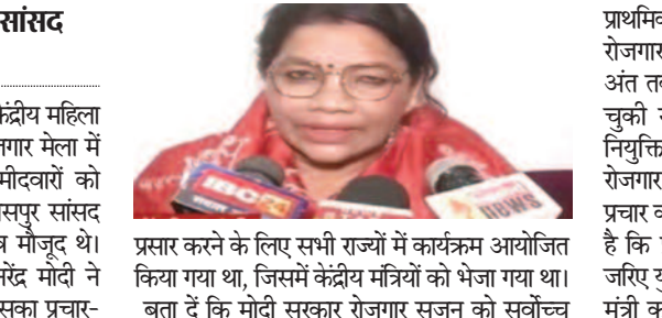
प्रसार करने के लिए सभी राज्यों में कार्यक्रम आयोजित किया गया था, जिसमें केंद्रीय मंत्रियों को भेजा गया था। बता दें कि मोदी सरकार रोजगार सृजन को सर्वोच्च