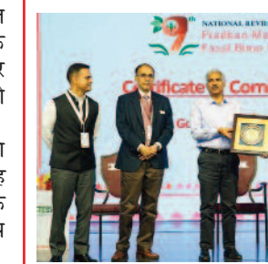
रायपुर, 14 अप्रैल 2023 (ए)। छत्तीसगढ़ में प्रधानमंत्री फसल बीमा योजना के बेहतर एवं सफल क्रियान्वयन के लिए भारत सरकार के कृषि एवं कृषक कल्याण विभाग द्वारा छत्तीसगढ़ को उत्कृष्ट पुरस्कार से सम्मानित किया गया है। मुख्यमंत्री भूपेश

बघेल एवं कृषि मंत्री रविन्द्र चौबे ने इस सम्मान के लिए कृषि विभाग के अधिकारी-कर्मचारी को बधाई एवं शुभकामनाएं दी। गौरतलब है कि प्रधानमंत्री फसल बीमा के क्रियान्वयन में छत्तीसगढ़ देश भर में अग्रणी राज्यों में शामिल है। भारत सरकार के कृषि एवं कृषक