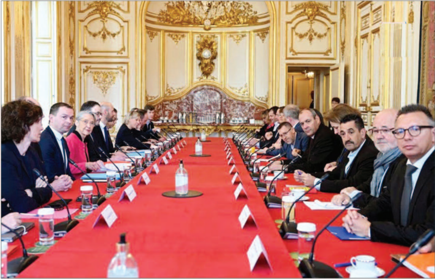
पेरिस में फ्रांस के प्रधानमंत्री एलिसबेथ बॉर्न व इंडर यूनिनयन के प्रतिनिधि एक होटल में पेंशन सुधार विधेयक पर बातचीत करते हुए।