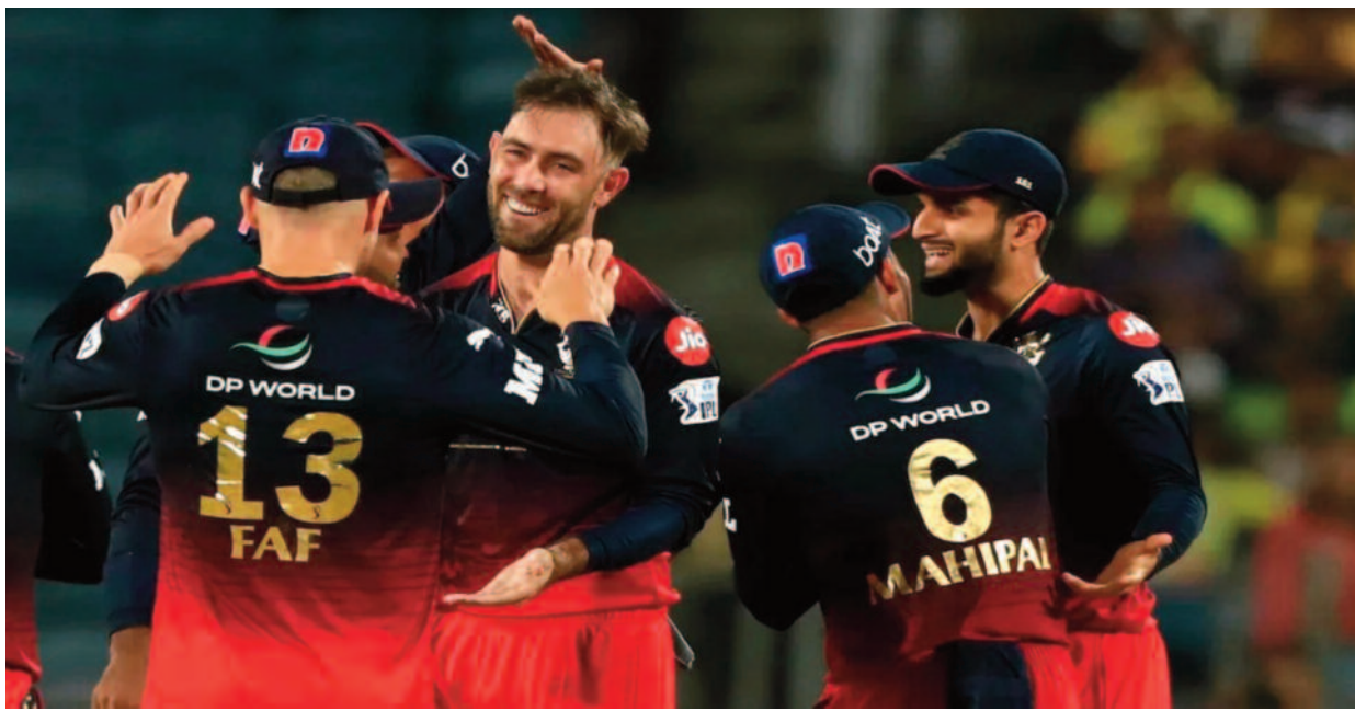
पर छाप छोड़ना चाहेंगे। लखनऊ की पिच ने हालांकि निराश किया है और यह घरेलू टीम के मजबूत पक्षों के अनुसार नहीं है। मोहाली में बल्लेबाजी

डुप्लेसिस के पूर्ण फिटनेस हासिल नहीं करने तक पूर्व भारतीय कप्तान कोहली टीम की अगुआई करते रहेंगे। आरसीबी की टीम डुप्लेसिस का इस्तेमाल 'इंपैक्ट प्लेयर' के रूप में कर रही है। आरसीबी के लिए मोहम्मद सिराज ने शानदार गेंदबाजी की है और उन्हें अन्य तेज गेंदबाजों से समर्थन की जरूरत है। हर्षल पटेल को मुश्किल समय के दौरान गेंदबाजी की जिम्मेदारी दी जा रही है लेकिन उन्हें 9.94 के अपने इकोनॉमी रेट में सुधार करना होगा। दूसरी तरफ लखनऊ की टीम पंजाब किंग्स के खिलाफ बड़ी जीत के बाद इस मुकाबले में उतरेगी। पंजाब के खिलाफ बल्लेबाजी प्रदर्शन दर्शाता है कि जब काइल मायर्स, मार्कस स्टोइनिस् और निकोलस पूरन जैसे बल्लेबाज लय में हों तो कोई भी स्कोर हासिल किया जा सकता है। कप्तान लोकेश राहुल हालांकि दबाव में हैं और लखनऊ के घरेलू मैदान