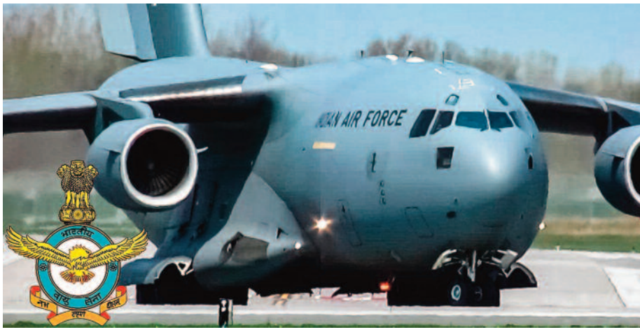
उदाहरण भी मौजूद हैं, लेकिन आज हम सी-17 ग्लोबमास्टर की खूबियों के बारे में चर्चा करेंगे।

निगरानी के लिए सरकार ने विदेश राज्यमंत्री वी. मुरलीधरन को वहां भेजा है। ऐसे में सूडान के अलग-अलग हिस्सों से भारतीयों को राजधानी खार्तूम लाया जा रहा है, जहां से उनकी सुरक्षित वतन वापसी को सुनिश्चित किया जा रहा है। इस निकासी अभियान के लिए वायु सेना के सी-17 ग्लोबमास्टर की तैनाती की गई है। सी-17 ग्लोबमास्टर वायु सेना का वही विमान है, जिसने तमाम बाधाओं को पार करते हुए भूकंपग्रस्त तुर्किये को मानवीय सहायता मुहैया कराई। इसके अलावा युद्धग्रस्त यूक्रेन में फंसे भारतीयों की सुरक्षित वतन वापसी कराई। ऐसे ही कई अन्य