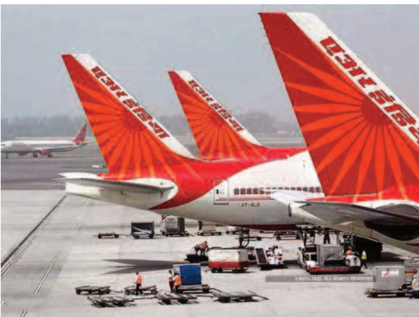
द्वारा महिला मित्र को कॉकपिट में जाने की अनुमति देने के बारे में डीजीसीए में शिकायत दर्ज कराई थी। घटना 27 फरवरी की है।