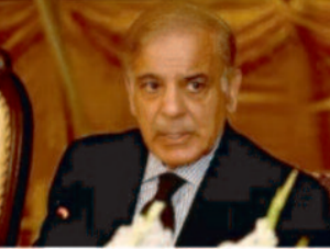
इसलिए शहबाज शरीफ सरकार इस बात को लेकर आशंकित है कि उसके इसमें भाग लेने से चीन नाराज हो सकता है। तुर्किये की भी ये बात संसद नहीं आएगी, जो पाकिस्तान का निकट सहयोगी देश है। दिसंबर 2021 में तत्कालीन सरकार ने यह कहते हुए अमेरिकी न्योता स्वीकार नहीं किया था कि जो बाइडन ने अमेरिका का राष्ट्रपति बनने के बाद से बाकी देशों के नेताओं को फोन किया, लेकिन तत्कालीन प्रधानमंत्री इमरान खान से बात नहीं की थी। इसके अलावा इमरान खान से लाइव भाषण देने के बजाय अपने भाषण की वीडियो रिकॉर्डिंग भेजने को कहा गया था, जिसे तत्कालीन सरकार ने पाकिस्तान के लिए अपमानजनक माना था। तत्कालीन सरकार ने कूटनीतिक भाषा में एक बयान जारी किया था,

वाशिंगटन, 28 मार्च 2023। अमेरिकी राष्ट्रपति जो बाइडन की तरफ से आयोजित लोकतंत्र शिखर सम्मेलन ने पाकिस्तान को गहरे असमंजस में डाल दिया है। पाकिस्तान उन 120 देशों में शामिल है, जिन्हें इस शिखर सम्मेलन में आमंत्रित किया गया है। लेकिन सोमवार रात तक पाकिस्तान सरकार यह तय नहीं कर पाई थी कि वह इसमें हिस्सा लेगी या नहीं। दिसंबर 2021 में हुए पहले लोकतंत्र शिखर सम्मेलन के लिए भी पाकिस्तान को न्योता दिया गया था, लेकिन तत्कालीन प्रधानमंत्री इमरान खान ने हिस्सा लेने से इनकार कर दिया था।