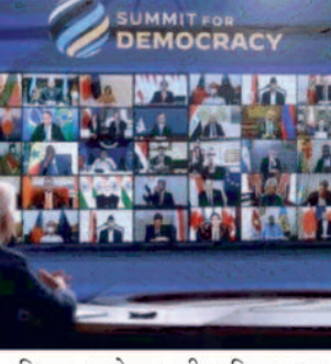
शिखर सम्मेलन की प्रक्रिया अब विकसित चरण में है और इसलिए, पाकिस्तान लोकतांत्रिक सिद्धांतों और मूल्यों को बढ़ावा देने और मजबूत करने और मानवाधिकारों को आगे

किया गया है। शिखर सम्मेलन में पाकिस्तान की भागीदारी पिछले कुछ समय से गहन चर्चा का विषय रही है। अधिकारियों ने कहा कि इस्लामाबाद ने इस कार्यक्रम से बाहर होने का रास्ता चुना ताकि वह अपने सहयोगी- चीन को परेशान न कर सके। पाकिस्तान के विदेश कार्यालय के प्रवक्ता ने मीडिया को बताया कि