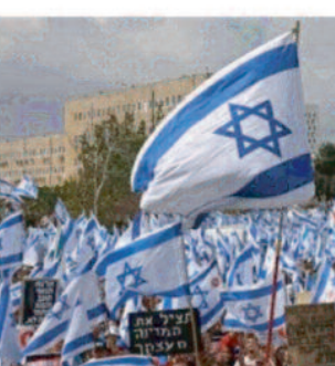
सिलसिला तीन महीने से चल रहा है। विरोध प्रदर्शन आम तौर पर शांतिपूर्ण रहे हैं। गुजरने वाली महीने के दौरान इनमें भाग लेने वाले लोगों की संख्या बढ़ती चली गई। इस्त्राएल के आम जीवन पर खराब असर पड़ा। 'न्यायिक सुधार' कानून की योजना न्याय मंत्री यारिव लिविन ने बीते चार जनवरी को पेश की थी। विपक्ष ने इसे सुप्रीम कोर्ट का गला घोटने की कोशिश बताया। इस्त्राएल में लिखित संविधान नहीं है, इसलिए यहां शासन में संतुलन बनाए रखने में सुप्रीम कोर्ट की महत्वपूर्ण भूमिका मानी जाती है। जबकि प्रस्तावित कानून को लेकर यह राय बनी कि इसके जरिए

नेल अवीव, 28 मार्च 2023। लगातार जारी विरोध प्रदर्शनों के कारण इस्त्राएल के प्रधानमंत्री बेंजामिन नेतन्याहू को अपने 'न्यायिक सुधार कानून' को फिलहाल वापस लेना पड़ा है। विश्लेषकों की राय है कि इस्त्राएल की जमीनी हालत से कट जाने के कारण प्रधानमंत्री को यह शर्मिंदगी झेलनी पड़ी है। कानून को 'अस्थायी रूप से' वापस लेते हुए नेतन्याहू ने सोमवार को कहा कि अपने विरोधियों को 'संवाद का वास्तविक मौका' दे रहे हैं। साथ ही नेतन्याहू ने अपने गठबंधन सहयोगियों को आश्वासन दिया कि अभी भी वे इस कानून को पारित कराने के लिए संकल्पबद्ध हैं। इसके बावजूद सत्ताधारी गठबंधन के समर्थकों की एक बड़ी भीड़ सोमवार रात सड़कों पर उतर आई। वह 'न्यायिक सुधार' वापस लेने की प्रधानमंत्री की घोषणा पर विरोध जता रही थी। इस्त्राएली मीडिया की टिप्पणियों में संदेह जताया गया है कि नेतन्याहू अब सचमुच इस कानून को वापस लागू कर पाएंगे। अगर नेतन्याहू इस स्थिति