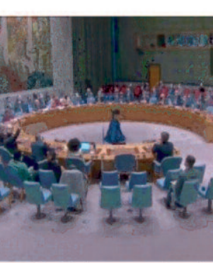
रूस को जिम्मेदार ठहराया है, लेकिन रूस ने इसके लिए पश्चिम पर तबाही का आरोप लगाया है।

रूस को जिम्मेदार ठहराया है, लेकिन रूस ने इसके लिए पश्चिम पर तबाही का आरोप लगाया है। रूस और चीन के प्रस्ताव का सिर्फ तीन देशों ने समर्थन दिया और 12 देशों ने मतदान में भाग नहीं लिया। इस प्रकार, अनुमोदन के लिए आवश्यक नौ वोट प्राप्त करने में यह प्रस्ताव विफल रहा। प्रस्ताव को रूस, चीन और ब्राजील ने समर्थन दिया, जबकि अल्बानिया, ब्रिटेन, गैबॉन, जाम्बा, माल्टा, मोजांबिक, यूएई, अमेरिका, फ्रांस, स्विट्जरलैंड, इंडोनेशिया और जापान मतदान से दूर रहे। प्रस्ताव को बेलारूस, वेनेजुएला, डीपीआरके, निकारागुआ, सीरिया और इरिट्रिया ने भी समर्थन दिया था।