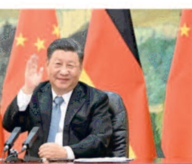
मांच को रूम दौर के दौरान यूक्रेन के साथ चल रहे युद्ध को खत्म कर शांति समझौता करने का रोडमैप तैयार किया है।

अब भी तैयार है। शी ने कहा कि दोनों देशों के बीच सुलह और शांति समझौता बनाए रखने के लिए चीन तैयार है। सऊदी और ईरान के एक साथ आने से विकास तो होगा, लेकिन इससे मध्य पूर्व में क्या फर्क पड़ेगा, ये अब भी सवाल है। रूस-यूक्रेन के बीच शांति समझौते का रोडमैप तैयार रिपोर्ट का कहना है कि मध्यपूर्व