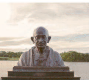
महात्मा गांधी की प्रतिमा को निशाना बनाया गया है। जिस पर वैकुंठ के महावाणिज्य दूत ने नाराजगी जाहिर करते हुए घटना की निंदा की और दोषियों को पहचान कर कड़ी सजा देने की मांग की। भारतीय विदेश मंत्रालय ने भी इस पर बयान जारी किया है। जिसमें कहा है कि कनाडाई अर्थरिजेशन से अपील की गई है कि वह मामले की जांच कर जल्द दोषियों

टोरंटो, 28 मार्च 2023। कनाडा के ब्रिटिश कोलंबिया प्रांत में एक यूनिवर्सिटी कैम्पस में स्थित राष्ट्रपिता महात्मा गांधी की प्रतिमा को क्षतिग्रस्त करने की खबर सामने आई है। महात्मा गांधी की प्रतिमा को निशाना बनाने की एक ही महीने में यह दूसरी घटना है। इससे पहले ऑट्टावा प्रांत में भी महात्मा गांधी की प्रतिमा को क्षतिग्रस्त किया गया था। जिसका आरोप खालिस्तान समर्थकों पर लगा था। ताजा मामले में भी खालिस्तान समर्थकों पर ही आरोप लग रहे हैं। यूनिवर्सिटी कैम्पस में महात्मा गांधी की प्रतिमा की क्षतिग्रस्त खबर के अनुसार, ब्रिटिश कोलंबिया में स्थित साइमन फ्रेजर यूनिवर्सिटी के बनबे कैम्पस में स्थित