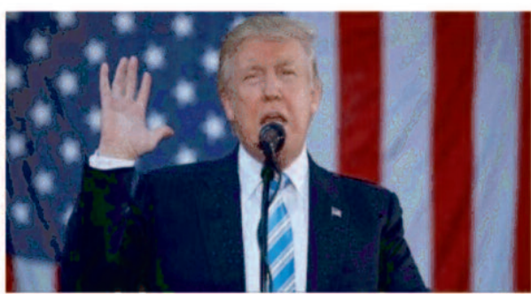
डोनाल्ड ट्रंप ने खुद के खिलाफ हो रही जांच की तुलना रूसी हॉरर शो से की

ट्रंप ने शनिवार को वाको के हवाईअड्डे पर जुटे अपने समर्थकों से कहा कि उनके चारों ओर घूम रही जांच स्टालिनस्ट रूस हॉरर शो का हिस्सा लग रहा है। शुरुआत से एक के बाद एक हास्यास्पद जांच करवाई जा रही है। ट्रंप पर जेल जाने का खतरा मंडरा रहा है। इस बीच, उन्होंने ये बयान दिया। कहा कि साजिश के तहत उनके खिलाफ अभियान चलाया जा रहा है।