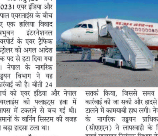
काठमांडू, 26 मार्च 2023। एयर इंडिया और नेपाल एयरलाइंस के बीच हुए एक हलिया विवाद त्रिभुवन इंटरनेशनल एयरपोर्ट के एयर ट्रैफिक कंट्रोलर को अगल आदेश तक पद से हटा दिया गया है।

काठमांडू, 26 मार्च 2023। एयर इंडिया और नेपाल एयरलाइंस के बीच हुए एक हलिया विवाद त्रिभुवन इंटरनेशनल एयरपोर्ट के एयर ट्रैफिक कंट्रोलर को अगल आदेश तक पद से हटा दिया गया है। नेपाल के नागरिक उड्डयन विभाग ने यह कार्रवाई की है। बीती 24 मार्च को एयर इंडिया और नेपाल एयरलाइंस की फ्लाइट्स हवा में आपस में टकराने से बच गई थी। विमानों के वॉर्निंग सिस्टम की वजह से बड़ा हादसा टला था।