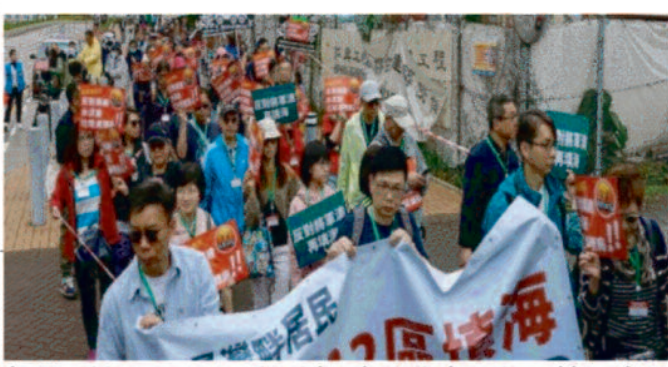
संपर्क किया था। इस पर अधिकारियों ने मार्च में शामिल होने वाले में त्सुंग क्रान ओ साउथ लैंडिंग में