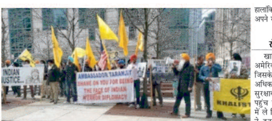
दूतावास पर हमले के लिए उकसाते दिखे।