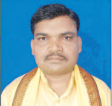
गौठान निर्माण कार्य पूर्व से आरक्षित भूमि जिसका ख. नं. 279 है। उस पर न बनाकर ख. नं. 149 पर नियम विरुद्ध बिना ग्रामसभा का जबरन

फर्जी एफआईआर के तहत शराब के मामले में जेल भेज दिया जाता है। सोनहत भरतपुर विधायक उसमें चुप्पी साधे हुए हैं पर 26 मार्च को विधायक महोदय फिर से धरना में बैठ गए, मरकाम ने कहा गांव की जनता जाग चुकी है कलेक्टर को कई बार आवेदन दिया गया उस पर कार्यवाही आज तक नहीं हो रही है उस पर भी चुप्पी साधे हुए हैं विधायक। अहम विषय तो यह भी है की विधायक गृहग्राम साल्ही में ऐसे कई मामला है जिस पर आज तक वर्तमान विधायक जी कुछ नहीं बोल रहे हैं आखिर वजह क्या है?