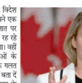
ऑरिंथर हो जाएंगे।%

टोरंटो, 26 मार्च 2023। कनाडा की विदेश मंत्री मेलिनी जॉली ने वहाँ की संसद में अपने एक बयान में कहा कि कनाडा पंजाब के हालात पर करीब से नजर रख रहा है और कनाडा में रह रहे समुदाय को इसके बारे में जानकारी देता रहेगा। वहाँ भारतीय विदेश मंत्रालय ने विदेशी नेताओं के पंजाब को लेकर दिए बयान पर कहा है कि गलत और भ्रामक जानकारी पर विश्वास ना करें। बता दें कि पंजाब पुलिस ने वारिस पंजाब दे संगठन के कट्टरपंथी नेता अमृतपाल सिंह के कई सहयोगियों को गिरफ्तार किया है और फरार अमृतपाल की तलाश की जा रही है।