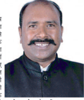
भूपेश बघेल के प्रति एकड़ 20 क्विंटल धान की खरीदी से किसान आर्थिक रूप से और अधिक संपन्न होंगे और किसानों को आर्थिक