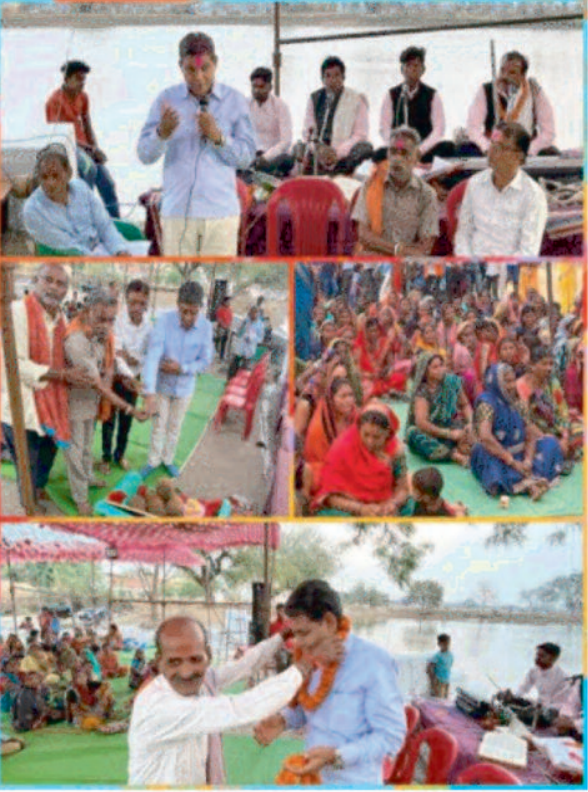
शब्दों में बड़ी ताकत होती है