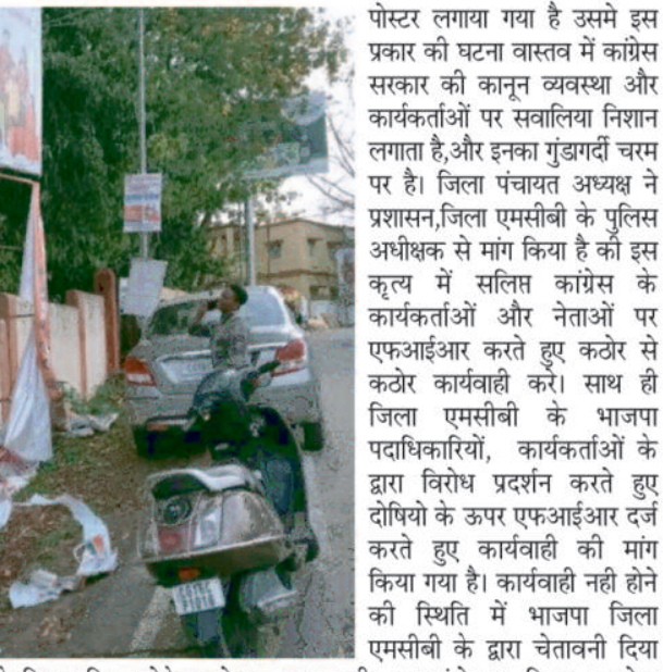
पोस्टर लगाने के लिए अधिकृत ठेकेदार होता है अधिकृत ठेकेदार से शुल्क जमा कर बैनर

पोस्टर लगाया गया है उसमें इस प्रकार की घटना वास्तव में कांग्रेस सरकार की कानून व्यवस्था और कार्यकर्ताओं पर सवालिया निशान लगाता है, और इनका गुंडागर्दी चरम पर है। जिला पंचायत अध्यक्ष ने प्रशासन, जिला एमसीबी के पुलिस अधीक्षक से मांग किया है कि इस कृत्य से सलित कांग्रेस के कार्यकर्ताओं और नेताओं पर एफआईआर करते हुए कटोर से कटोर कार्यवाही करे। साथ ही जिला एमसीबी के भाजपा पदाधिकारियों, कार्यकर्ताओं के द्वारा विरोध प्रदर्शन करते हुए दोषियों के ऊपर एफआईआर दर्ज करते हुए कार्यवाही की मांग किया गया है। कार्यवाही नहीं होने की स्थिति में भाजपा जिला एमसीबी के द्वारा चेतावनी दिया गया की उग्रआंदोलन किया जायेगा जिसका जिम्मेदार शासन प्रशासन होगा।