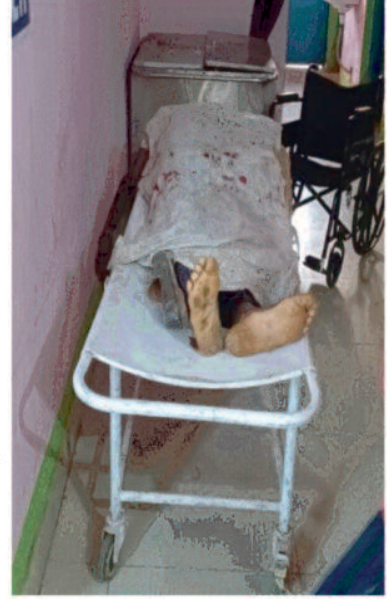
पोस्टमार्टम के लिए तत्काल भेजा है। मामले की जांच पुलिस कर रही है और क?ई अन्य लोगों को चोटें आई है तथा हत्या करने में और कितने लोग शामिल थे इ फिलहाल सभी आरोपी फरार बताया जा रहे है खबर लिखे जाने तक यह स्पष्ट नहीं हों पाया है कि यह हत्या जमीन विवाद है या कुछ जांच उपरान्त ही इस मामले का खुलासा हों पाएगा।