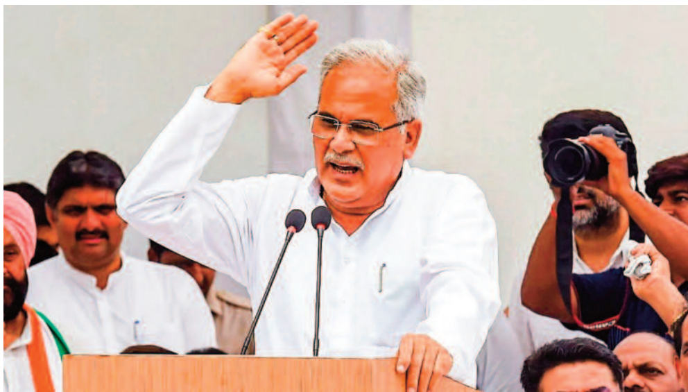
कारोबारी कांग्रेस महाधिवेशन के दौरान अधिवेशन का कार्यभार संभाल रहे थे। सीएम ने लिखा भाजपा हद पार कर रही है। मेरे साथियों के घर ईडी के छापे से

रायपुर, 27 फरवरी 2023 (ए)। पूरे देश भर में इस समय ईडी एनआईए की टीमों लगातार छापेमारी कर रही है। वहीं छत्तीसगढ़ में भी लगातार टीम छापेमारी कर अधिकारी और कारोबारियों के ठिकानों पर दबिश दे रही है। वहीं कांग्रेस के महाधिवेशन के वक्त भी एक कारोबारी के घर पर ध्वज ने दबिश दी है। सीएम भूपेश ने इस पर टवीट करते हुए लिखा कि मेरे साथियों के घर ईडी के छापे से महाधिवेशन नहीं रोक पाए तो शनिवार को अधिवेशन का प्रबंधन संभाल रहे कारोबारी के घर पहुंच गए। बताया जा रहा है कि