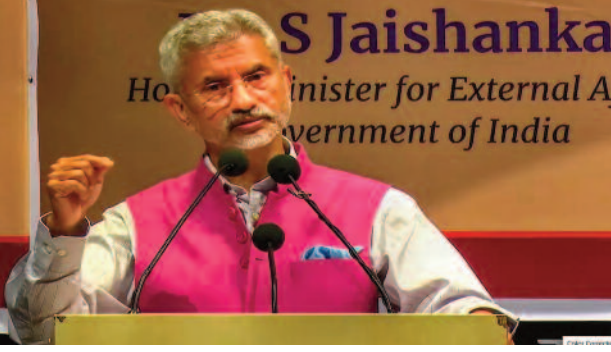
S Jaishankar, Minister for External Affairs, Government of India

में क्या महसूस करते और सोचते हैं। और मुझे लगता है कि इसका जवाब सब जानते हैं।