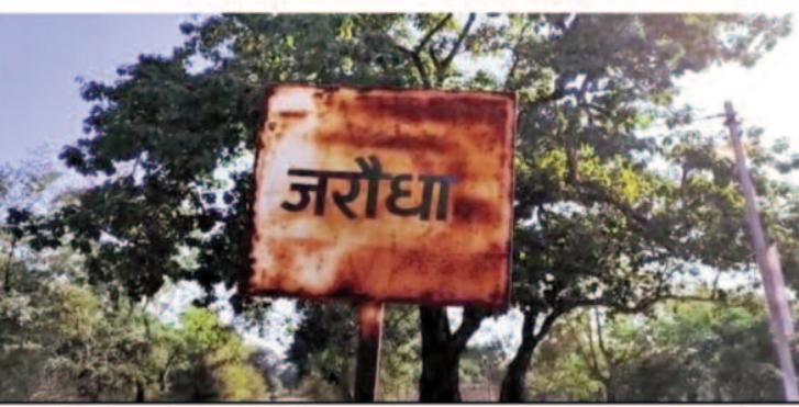
जरींधा में जल जीवन मिशन के तहत हुए कार्य को देखकर आसानी विभाग के पास भी नहीं है। आपको बता दे की ग्राम पंचायत जरींधा में जल जीवन मिशन के तहत हुए कार्य को देखकर आसानी

साथ जल पहुंचाने के लिए जल जीवन मिशन योजना लाई पर यह योजना जमीनी स्तर पर और विभाग की लापरवाही से भ्रष्टाचार की भेंट चढ़ता नजर आ रहा है निर्माण में ठेकेदार कोई है और काम कोई कर रहा. देखरेख करने वाला विभाग के पास देखरेख की फुर्सत नहीं यही वजह है कि जो भी पेंटी में इस काम को ले रहा वह जैसे तैसे घंटिया स्तर के पाइप बिछाकर अपना काम पूरा दिखाते हुए ऐसे निकालने की जुगत में लगा हुआ है पर स्थिति यह है कि यह योजना जिस मकसद से बनाई