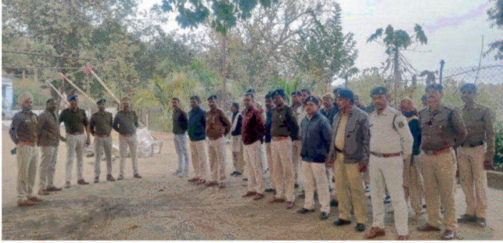
लिया। इस दौरान पुलिस अधिकारियों ने कहा कि मंदिर परिसर तथा मेला स्थल में पर्याप्त संख्या में पुलिस जवानों की ड्यूटी लगाई जायेगी, किसी प्रकार की भगदड़ से बचने के लिए कतारबद्ध होकर जलाभिषेक करने, संदिग्धों व असामाजिक तत्वों पर कड़ी निगरानी के लिए पुलिस के अधिकारी व जवान सादी वर्दी में तैनात रहेंगे। सारासोर पवित्र धार्मिक स्थल के