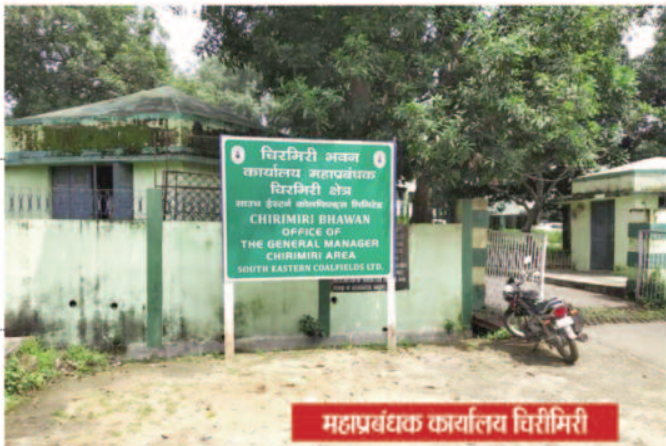
महाप्रबंधक कार्यालय चिरमिरी

8 फरवरी 2023 को प्रकाशित खबर क्या एसईसीएल चिरमिरी क्षेत्र के सिविल विभाग के अधिकारी भ्रष्टाचार में सलिप्त? क्या एसईसीएल चिरमिरी क्षेत्र के सिविल विभाग के अधिकारी भ्रष्टाचार में सलिप्त? यह खबर 8 फरवरी 2023 को प्रकाशित हुई थी। खबर में बताया गया है कि चिरमिरी क्षेत्र के सिविल विभाग के अधिकारियों ने वर्षों से जमे ओवरशियरों को हटाने में देरी की है।