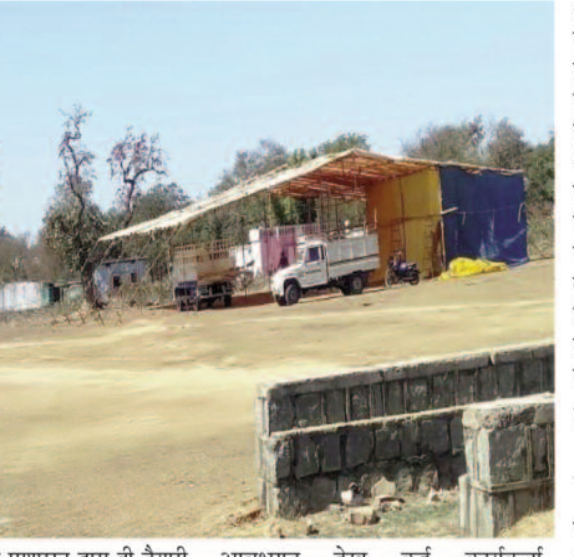
आवभगत देख कई कार्यकर्ता आश्चर्यचकित भी है।