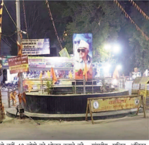
तो वहीं 40 लोगों को भोजन कराने की बात भी हो रही है। विधायक द्वारा सभी को खुद काल करके आमंत्रित किया जा रहा है।