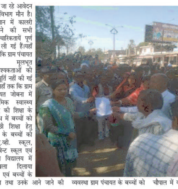
दिये जा रहे आवेदन पर विभाग मौन है। वर्तमान में कालरी खुलने की सभी औपचारिकतायें पूर्ण कर ली गई है। यहाँ तक कि ग्राम पंचायत जोबगा की मूलभूत आवश्यकताओं की भी पूर्ति नहीं की गई है। यहाँ तक कि ग्राम पंचायत जोबगा में प्राथमिक स्वास्थ्य केन्द्र की शिक्षा के संबंध में बच्चों को अच्छी शिक्षा हेतु ग्रामीणों को डी.ए.व्ही. स्कूल, कान्वेंट स्कूल एवं अन्य विद्यालय में दाखिला दिलाया जाये एवं बच्चों के शिक्षा तथा उनके आने जाने की व्यवस्था ग्राम पंचायत के बच्चों को

निकाली रैली, सौंपा ज्ञापन बोले... समाधान के पहले नहीं खुलने देंगे कालरी संवाददाता - सूरजपुर, 07 फरवरी 2023 (घटती-घटना)। नोकरों व मुआवजे की मांग को लेकर जोबगा के ग्रामीणों ने रैली निकाली और कलेक्टर को एक ज्ञापन सौंपा है। ज्ञापन में कहा गया है कि ग्राम पंचायत जोबगा में एस. ई. सी. एल केतकी अण्डर ग्राउण्ड खदान प्रारंभ होने की कागार पर है परंतु ग्रामवासियों की किसी भी मांग को पूरा नहीं किया गया है। जबकि ग्रामवासियों के द्वारा विगत कई वर्षों से आवेदन, निवेदन, धरना हड़ताल एवं चक्का जाम के माध्यम से प्रशासन को समय-समय पर अपनी मांगों से अवगत कराता रहे है। परंतु विगत लगभग 18 वर्षों से ग्रामीणों के द्वारा