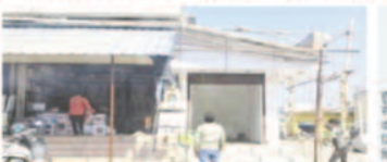
उपर हुई शिवालय तो वनाया वहना

भाजपा जिलाध्यक्ष को कोरिया जिले की भाजपा पार्टी के अध्यक्ष के रूप में चुना गया है। इसी कारण पार्टी के अध्यक्ष के रूप में चुना गया है।