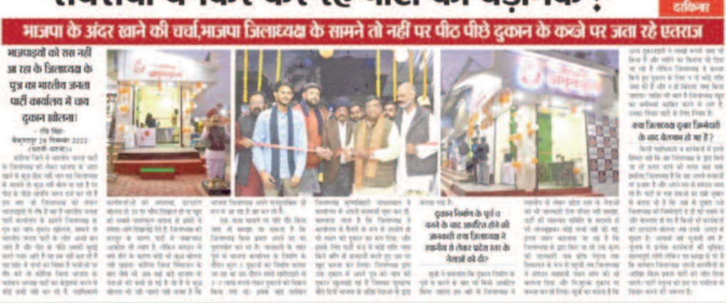
भाजपा के अंदर खाने की चर्चा भाजपा जिलाध्यक्ष के सामने तो नहीं पर पीठ पीछे दुकान के कब्जे पर जता रहे एतराज

भाजपा जिलाध्यक्ष को कोरिया जिले की भाजपा पार्टी के अध्यक्ष के रूप में चुना गया है। इसी कारण पार्टी के अध्यक्ष के रूप में चुना गया है।