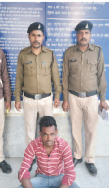
मुखबरी सूचना प्राप्त हुई कि एक सदिध व्यक्त चट्टीमरा बैरियर के पास अवैध मादक पदार्थ रखकर बिक्री करने हेतु ग्राहक की तलाश कर रहा है, नगर पुलिस अधीक्षक के नेतृत्व में पुलिस टीम