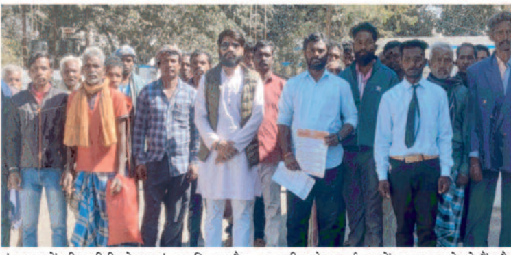
तहसील के कार्यालय में चक्कर लगाते रहे हैं और पूर्व में भी ग्राम वासियों के द्वारा कार्यालय में आवेदन कई बार दिया है पर सचिव और वनरक्षक सूची के द्वारा भोले भाले ग्राम वासियों को बार-बार गुमराह किया जाता है और कहा