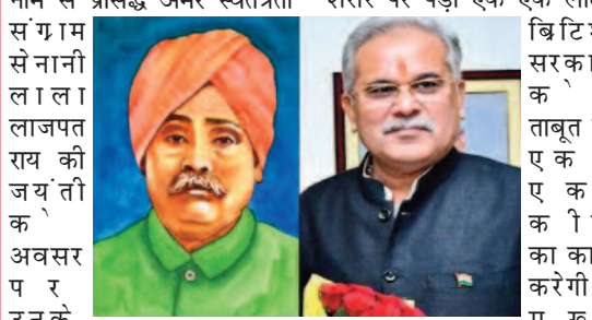
परवाह नहीं की। ब्रिटिश हुकूमत का विरोध करते हुए उन्होंने अपने जान न्यौछावर कर दिए। लाला जी ने कहा था 'मेरे शरीर पर पड़ी एक-एक लाठी सेंगाम से नानी लाला लाजपत राय की जयंती के अवसर पर उनके छायाचित्र पर पुष्प अर्पित कर उन्हें नमन किया। मुख्यमंत्री ने लाला लाजपत राय के स्वतंत्रता संग्राम में अतुलनीय योगदान को याद करते हुए कहा कि लाला जी ने स्वाधीनता के लिए संघर्ष करते हुए अपने प्राणों की भी

रायपुर, 28 जनवरी 2023 (ए)। मुख्यमंत्री श्री भूपेश बघेल ने आज यहाँ अपने निवास कार्यालय में पंजाब केसरी के नाम से प्रसिद्ध अमर स्वतंत्रता संग्राम सेनानी लाला लाजपत राय की जयंती के अवसर पर उनके छायाचित्र पर पुष्प अर्पित कर उन्हें नमन किया। मुख्यमंत्री ने लाला लाजपत राय के स्वतंत्रता संग्राम में अतुलनीय योगदान को याद करते हुए कहा कि लाला जी ने स्वाधीनता के लिए संघर्ष करते हुए अपने प्राणों की भी