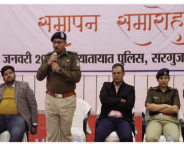
जनवरी से 17 जनवरी तक कई जागरूकता कार्यक्रम आयोजित किए गए हैं, जिससे क्षेत्र में रहने वाले आम नागरिक, छात्र-छात्राएं, आंटी,