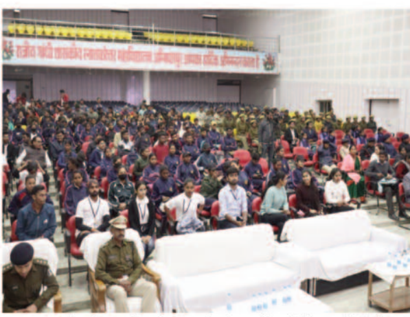
बस चालको परिचालको सहित काफी संख्या में लोगों को इसका लाभ प्राप्त हुआ है, सरगुजा पुलिस द्वारा आम नागरिकों के बेहतर सुविधा हेतु

सरगुजा पुलिस द्वारा त्रिनेत्र हेलपलाइन नंबर शुरूआत करने की योजना की भी जानकारी दी गई जिसमें कोई भी आम नागरिक या छात्र छात्रा यातायात नियमों की अवहेलना करने वाले व्यक्तियों के विरुद्ध शिकायत दर्ज करा सकता है, स्कूल बच्चों के दुर्घटना वाहन चलाने हेतु पूर्णतः प्रतिबन्ध आदेश कलेक्टर सर द्वारा निदेश जारी किये गए हैं, साथ ही हम सबको सड़क सुरक्षा की ओर चर्चा करने कि आवश्यकता है। स्कूली बच्चों द्वारा कलेक्टर