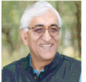
स्वास्थ्य मंत्री फहराएंगे पीजी कॉलेज ग्राउंड में राष्ट्रीय ध्वज