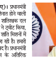
आर्मी ने हैशटैग अंबेई, हैशटैग यूएनआईएफएफपीएम में हैशटैग संयुक्तराष्ट्र मिशन में महिला हैशटैग

शांतिरक्षकों की अपनी सबसे बड़ी टुकड़ी को तैनात करती है। टीम यूएन के इंडे के तहत अत्यधिक परिचालन और चुनौतीपूर्ण इलाकों में से एक में महिलाओं और बच्चों को राहत और सहायता प्रदान करेगी। संयुक्त राष्ट्र में भारत के स्थायी मिशन ने शुक्रवार को एक बयान में कहा कि महिला शांति सैनिकों की पलटन को संयुक्त राष्ट्र अंतरिम सुब्बा बल, अभय (यूनिस्फम) में भारतीय बटालियन के हिस्से के रूप में अंबेई में तैनात किया जाएगा।