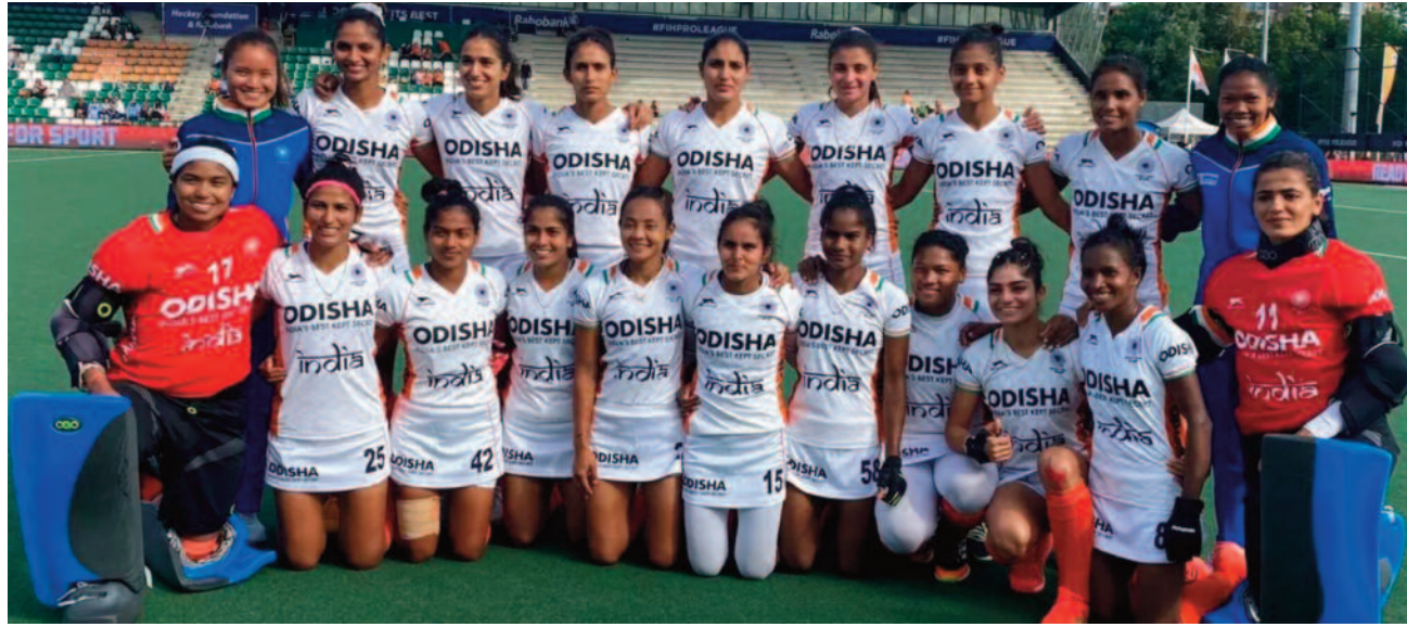
महिला राष्ट्र कप 2022 का उद्घाटन संस्करण जीता था।

नई दिल्ली, 06 जनवरी 2023। हॉकी इंडिया ने केपटाउन में 16 जनवरी, 2023 से शुरू होने वाले दक्षिण अफ्रीका के आगामी दौरे के लिए भारतीय महिला टीम की घोषणा की जिसमें अनुभवी स्टाफ और पूर्व कप्तान रानी रामपाल ने अंतरराष्ट्रीय हॉकी में वापसी की। बेल्जियम के खिलाफ एफआईएच महिला हॉकी प्रो लीग 2021/22 मैच के बाद पहली बार अनुभवी फारवर्ड टीम में वापस आया।