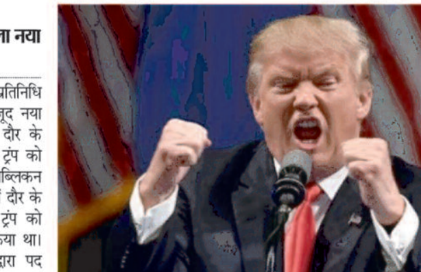
ट्रंप के एक वोट मिलने पर लगे ठहाके

वोट मिला। 11वें दौर के बाद भी नहीं मिला नया सदन अध्यक्ष संयुक्त राज्य अमेरिका की प्रतिनिधि सभा के काफी प्रयासों के बावजूद नया अध्यक्ष पांचवें दिन और 11वें दौर के मतदान के बाद भी नहीं मिला। ट्रंप को एकमात्र वोट फ्लोरिडा के एक रिपब्लिकन मैट गेट्ज ने दिया। गेट्ज ने 11वें दौर के मतदान में औपचारिक रूप से ट्रंप को हाउस स्पीकर के लिए नामित किया था। वर्तमान स्पीकर नैसी पेलोसी द्वारा पद