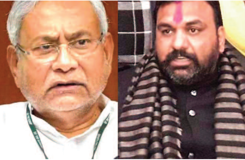
उन्हें लाठी चार्ज की जानकारी नहीं है, यह दुर्भाग्यपूर्ण स्थिति है। उन्होंने