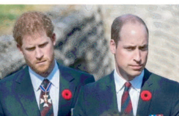
प्रिंसेस डायना की मौत को लेकर उठाए सवाल

प्रिंस हैरी की यह किताब अगले हफ्ते बाजार में आने वाली है लेकिन किताब का स्पैनिश भाषा का वर्जन गुरुवार को ही लीक हो गया। जिसके बाद से मीडिया में इसकी चर्चा है। मीडिया रिपोर्ट्स के अनुसार, इस किताब में प्रिंस हैरी ने अपने भाई प्रिंस विलियम के साथ हुए झगड़े, पिता किंग चार्ल्स के साथ अपने रिश्तों और अपनी मां प्रिंसेस डायना को लेकर अहम खुलासे किए हैं।