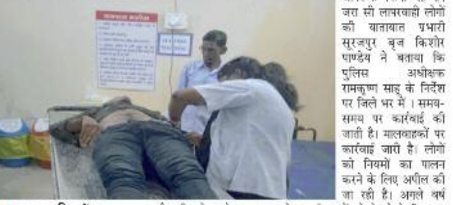
यातायात नियमों का उल्लंघन व लापरवाही ज्ञान पर भारी एक वर्ष में 228 की हुई मौत

ऑरकार पाण्डेय सूरजपुर, 01 जनवरी 2023 (घटती-घटना)। लगातार बढ़ती सड़क दुर्घटनाओं पर अकुश लगाने पुलिस व यातायात विभाग द्वारा चलाए जा रहे यातायात जागरूकता अभियान के व्यापक चोते वर्ष 2022 में सड़क दुर्घटनाओं में आंशिक कमी आई है। वहीं पुलिस व यातायात विभाग की टीम द्वारा साल भर यातायात नियमों का उल्लंघन करने वाले वाहन चालकों के विरुद्ध चालानी कार्यवाही करते हुए दुर्घटनाओं पर लगातार जांच की करती है। बिना हेलमेट व एक बाइक पर तीन सवार होकर नियमों का उल्लंघन कर रहे हैं। यातायात