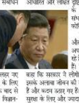
कहा कि सरकार ने लोगों की सुरक्षा को ही प्राथमिकता दी है। इसके अलावा जीवन की रक्षा के लिए हर संभव प्रयास किए गए हैं और कठम उठाए गए हैं। जिनपिंग ने कहा कि लोगों को अपनी सुरक्षा के लिए और ज्यादा सचेत होने की जरूरत है।

बीजिंग 01 जनवरी, 2022। नए साल के अपने संबोधन में चीनी राष्ट्रपति शी जिनपिंग ने कहा, चीन नई कोविड लहर में कड़ी चुनौतियों का सामना कर रहा है। यह एक आसान यात्रा नहीं रही है। देश को अभूतपूर्व कठिनाइयों और चुनौतियों का सामना करना पड़ रहा है। हालांकि चीन के असाधारण प्रयासों ने अभूतपूर्व चुनौतियों पर काबू पाने में मदद की है।