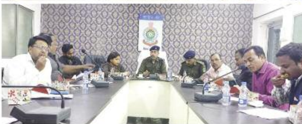
बनाकर रखना बताया गया।