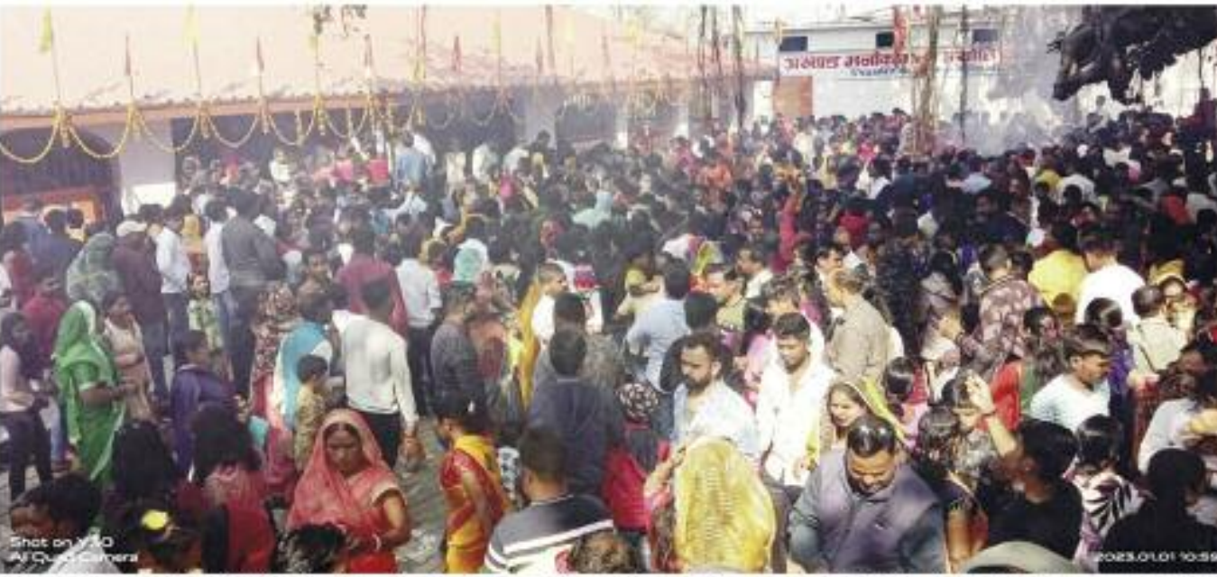
लोग अपने-अपने परिवार के साथ नजर आए। नए साल का स्वागत लोगों ने संस्कृत्य व खेर-सवाटे के साथ किया। 31 दिसंबर की रात से ही युवाओं द्वारा जत्र मनाने की तैयारी की गई थी। 12 जमकर मस्ती की। संजय पार्क व वाटर पार्क में युवाओं की काफी भीड़ थी। नए

युवाओं ने दोस्तों के साथ सेल्फी ली। कई लोगों ने अपने पूरे परिवार के साथ पाकों में ही पिकनिक का आनंद उठाया। बीते साल की कड़वी यादों को भूलकर 1 जनवरी को लोग जगह-जगह अपने परिवार और ईंट मित्रों के साथ मिलकर खुशियां मनाई। इस दौरान लोगों ने नमकर मौज-मस्ती की। कुछ परिवारों ने शहर के संजय पार्क, वाटर पार्क में अपनी खुशियां एक-दूसरे से बांटी तो अंबिकापुर लोग अपने-अपने परिवार के साथ पिकनिक स्पॉट पर लोग अपने-अपने परिवार के साथ नजर आए। नए साल का स्वागत लोगों ने