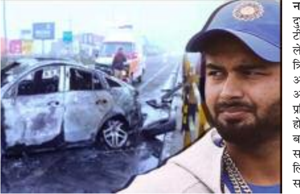
नयी दिल्ली, 01 जनवरी 2023। कार दुर्घटना के बाद ऋषभ पंत के 'लिंगामेंट टायर' के बारे में स्थिति स्पष्ट नहीं हुई है लेकिन अगर बीसीसीआई (भारतीय क्रिकेट बोर्ड) के सूत्रों की मानें तो वह आस्ट्रेलिया के खिलाफ चार टेस्ट मैचों की आगामी श्रृंखला में नहीं खेल पायेंगे। पंत प्रतिस्पर्धी क्रिकेट से लंबे समय तक बाहर हो सकते हैं और इस समय कोई भी तारीख बताना जल्दबाजी होगी। नयी चयन समिति के लिये बॉर्डर गावस्कर ट्रॉफी के लिये दो विकेटकीपर बल्लेबाजों का चयन सबसे बड़ी चुनौतियों में से एक होगा।