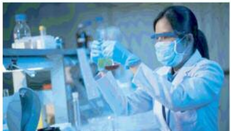
एक यात्रा फर्म के अनुसार, चीन में कोविड के कारण होने वाली मौतों में प्रतिदिन नौ हजार लोगों की वृद्धि हुई है। रिपोर्ट में यह भी कहा गया है कि ब्रिटिश आधारित रिसर्च फर्म एयरफिनिटी ने चीन में कोविड से मरने वालों की संख्या देगुना हो गई है, क्योंकि संक्रमण से मरने की संख्या बढ़ी है। नवंबर में जीरो कोविड पॉलिसी को हटाने के बाद कोविड मामलों में वृद्धि हुई है। वहीं से जीरो कोविड पॉलिसी लागू थी। यदि नई बुधवार को यह बात इटली के अधिकारियों ने भी कही। चीन में मिलन (इटली का शहर) जाने वाली दो उड़ानों के करीब आधे यात्रियों का कोविड टेस्ट पॉजिटिव आया। सार्वजनिक स्वास्थ्य विशेषज्ञों ने बताया कि अमेरिका ने इस उपाय (अमेरिका में प्रवेश के लिए कोविड निगेटिव टेस्ट) की घोषणा क्यों की। यह एक व्यवहारिक दृष्टिकोणिक समाधान नहीं है।

वाशिंगटन, 01 जनवरी 2023। चीन में कोरोना के मामलों में रिकॉर्ड वृद्धि के बीच रोग नियंत्रण और रोकथाम केंद्र (सीडीसी) ने घोषणा की कि देश में चीन के साथ-साथ हांगकांग और मकाऊ से आने वाले सभी यात्रियों को निगेटिव टेस्ट रिपोर्ट जरूरी होगा। अमेरिकी मीडिया ने रविवार को यह जानकारी दी। सीडीसी ने एक बयान में कहा कि चीन में कोविड-19 के मामलों में उछाल के बीच सीडीसी अमेरिका में कोविड-19 के प्रसार को धीमा करने के लिए इस कदम की घोषणा कर रहा है। चीन से पर्यटन और पारदर्शी महापरीषद विज्ञान और वायरल जैविकी अनुक्रम डाटा की कमी जवाब दे रही है। सीडीसी ने कहा, पांच जनवरी से चीन से आने वाले अंतरराष्ट्रीय यात्रियों को अमेरिका में