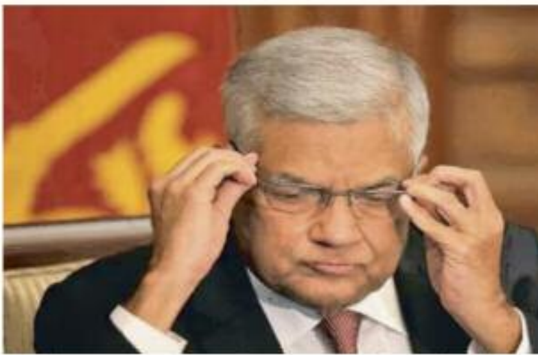
वहीं उन्होंने कहा कि 2023 में इस अर्थव्यवस्था को पूरी तरह से बदलने की योजना बना रहे हैं। छ माघों पर जमीनी स्तर से काम करेंगे। लोगों को समस्याओं को जगेंगे। वहीं वैश्विक स्तर पर रिश्ते सुधारने की कोशिश

कोलंबो, 01 जनवरी 2023। श्रीलंका के राष्ट्रपति रानिल विक्रमसिंघे ने रविवार को कहा कि 2023 नवद्वी की तंगी वाले देश के लिए एक महत्वपूर्ण वर्ष होगा क्योंकि उनका शासन संकटग्रस्त अर्थव्यवस्था को पुनर्जीवित करने के लिए बहुत आवश्यक प्रोत्साहन देने के लिए सख्त प्रयास कर रहा है।