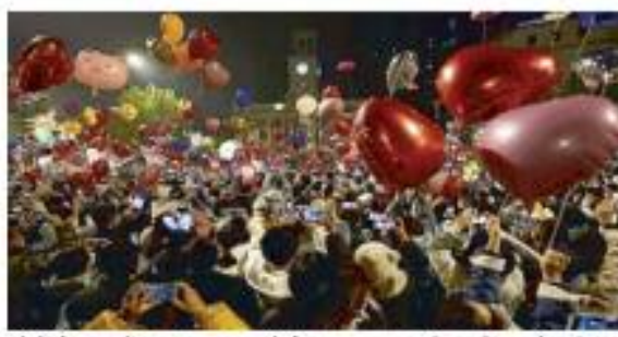
लोगों के मन से डर भगाना चाहते हैं। वहीं एक महिला ने कहा कि मुझे पहले डर लगा कि मैं फिर से कहीं संक्रमित न हो जाऊं लेकिन फिर मैंने सड़कों पर भारी संख्या में लोगों को देखा फिर मैं खुद को रोक नहीं सकी।

बीजिंग, 01 जनवरी 2023। कोरोना महामारी के साए के बीच दुनिया के कई देशों में लोग नए साल का जश्न काफ़ी उदास से मना रहे हैं। महामारी के खतरे के बीच कई लोग सड़क पर भी उतरे दिखे। लेकिन सबसे हैरान करने वाले दृश्य चीन से सामने आए हैं जहां कोराना विस्फोट के कारण मच रही तबाही के बावजूद लाखों की संख्या में लोग सड़कों पर उतरे नजर आए। भारी संख्या में लोग गुब्बारे छोड़ने के साथ-साथ आतिशबाजी करते दिखे। कई लोग एक दूसरे के गले लगाते भी दिखे। हालांकि, इस दौरान सभी लोग मस्क लगाए हुए दिखे।