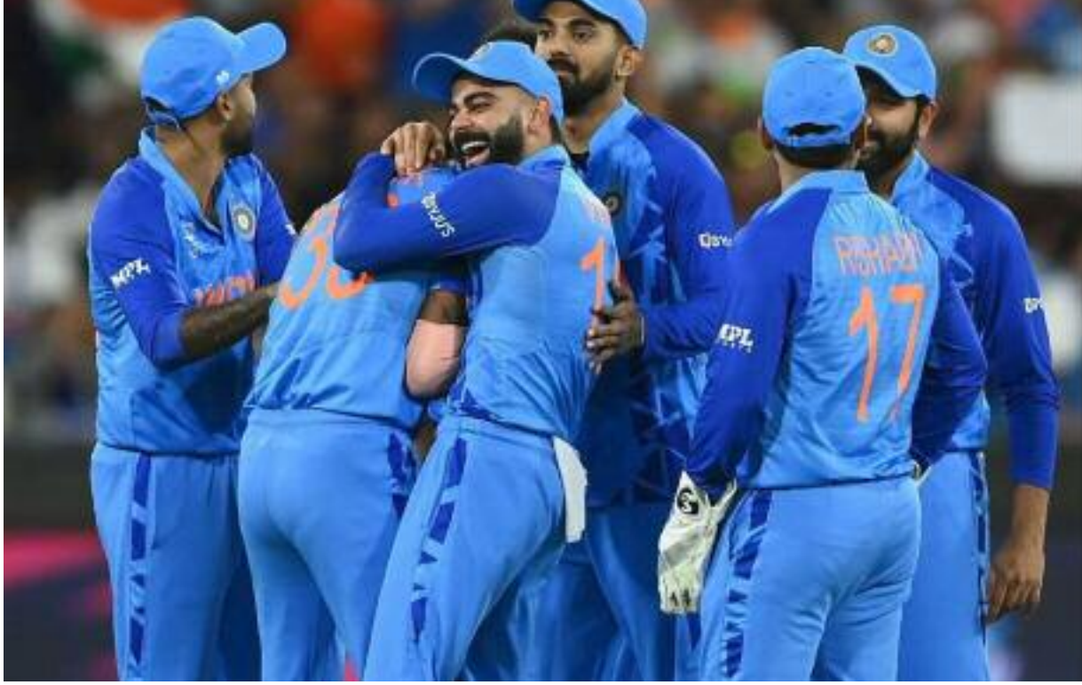
नयी दिल्ली, 01 जनवरी 2023। भारतीय क्रिकेट टीम वर्ष 2023 में कई खास टूर्नामेंटों में हिस्सा लेने वाली है जिसमें विश्व कप और एशिया कप जैसे टूर्नामेंट का होना भी शामिल है। भारतीय टीम इस वर्ष सबसे पहली सीरीज श्रीलंका के खिलाफ खेलने वाली है। तीन

जनवरी से घरेलू सीरीज का आयोजन होगा इन टीमों से भिड़ेगी टीम भारतीय क्रिकेट टीम इस बार श्रीलंका, ऑस्ट्रेलिया, न्यूजीलैंड, साउथ अफ्रीका, वेस्टइंडीज के साथ सीरीज खेलेगी। भारत को इस वर्ष कई घरेलू सीरीज खेलनी है। वहीं कुछ मुकाबले विदेशी सरजमा पर भी खेले जाएंगे। ऐसा रहेगा भारतीय टीम का शेड्यूल जनवरी में श्रीलंका का दौरा - पहला टी20- 3 जनवरी, मुंबई - दूसरा टी20- 5 जनवरी, पुणे - तीसरा टी20- 7 जनवरी, राजकोट - पहला वनडे- 10 जनवरी, गुवाहाटी - दूसरा वनडे- 12 जनवरी, कोलकाता - तीसरा वनडे- 15 जनवरी, तिरुवनंतपुरम न्यूजीलैंड का भारत दौरा (जनवरी-फरवरी) - पहला वनडे- 18 जनवरी, हैदराबाद - दूसरा वनडे- 21 जनवरी, रायपुर - तीसरा वनडे- 24 जनवरी, इंदौर - पहला टी20- 27 जनवरी, रांची - दूसरा टी20- 29 जनवरी, लखनऊ - तीसरा टी20- 1 फरवरी, अहमदाबाद ऑस्ट्रेलिया का भारत दौरा (फरवरी-मार्च) - पहला टेस्ट- 9 से 13 फरवरी, नागपुर - दूसरा टेस्ट- 17 से 21 फरवरी, दिल्ली - तीसरा टेस्ट- 1 से 5 मार्च, धर्मशाला - चौथा टेस्ट- 9 से 13 मार्च, अहमदाबाद - पहला वनडे- 17 मार्च, मुंबई - दूसरा वनडे- 19 मार्च, विशाखापत्तनम - तीसरा वनडे- 22 मार्च, चेन्नई इस सीरीज के बाद आईपीएल का आयोजन होगा। संभावना है कि आईपीएल का आयोजन अप्रैल और मई के महीने में किया जाएगा।