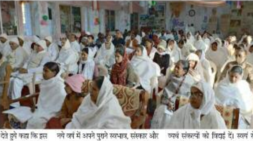
सरगुजा संभाग की सेवा केंद्र संचालित ब्रह्माकुमारी विश्व दीदी नये वर्ष की शुभप्रार्थनाएं एवं बधाई देते हुए कहा कि इस नये वर्ष में अपने पुराने स्वभाव, संस्कार और व्यर्थ संस्कृत्यों को विदाई दें। स्वयं से खुश

यात्र करे जिसमें अपना सुधार हो और दूसरों से भी बहुत प्यार करें, जिसमें शमा भाव हो और पुराने सब गीले- शिक्के भूलकर, सभी को गलतियों को माफ कर नये उमंग-उत्साह से नये जीवन की शुरुआत करें। इस नये वर्ष में अपने जीवन का कुछ लक्ष्य बनाये और उस लक्ष्य को आशावादी, लगन, अथक परिश्रम और दृढ़ता से प्राप्त करें और कोई न कोई पुण्य कर्म करके सभी से दुआएं प्राप्त करें। अपने सोच को सभी के प्रति सकारात्मक और समर्थ बनाये। क्योंकि स्वार्थसंगत विचार ही आत्मविश्वास को बढ़ाता है, एकताता की शक्ति को बढ़ाती है जिससे लक्ष्य को सहज से प्राप्त किया जा सकता है।