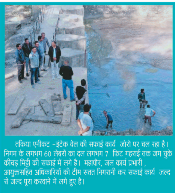
तकिया एनीकट - इटैक वेल की सफाई कार्य जोरो पर चल रहा है। निगम के लगभग 60 लेबर्स का दल लगभग 7 फिट गहराई तक जम चुके कीवड मिट्टी की सफाई में लगे हैं। महापौर, जल कार्य प्रभारी, आयुक्तसहित अधिकारियों की टीम सतत निगरानी कर सफाई कार्य जल्द से जल्द पूरा करवाने में लगे हुए हैं।