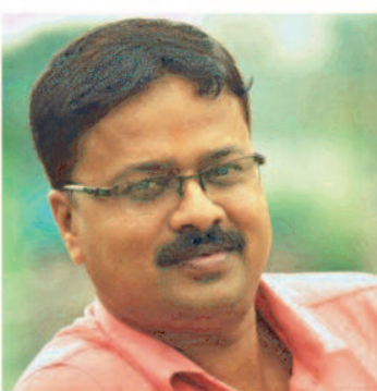
शेष नहीं रह जाता है।

अतः मेरे द्वारा पुनः सुप्रीम कोर्ट, हाई कोर्ट,