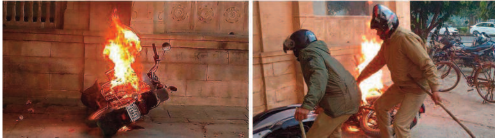
विवाद पनप गया!

गोली चलाने का आरोप लगा छत्रों ने किया पथराव