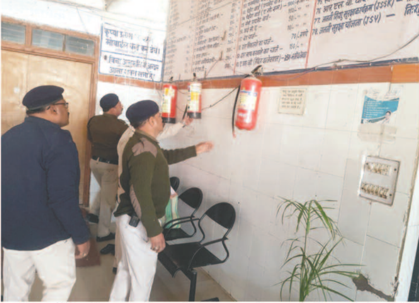
एमसीएच का निरीक्षण किया। जांच में फायर सेफ्टी की गई कमियां पाई गईं।