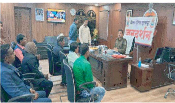
कहा, जिसके आधार पर पुलिस उन्हें पकड़ सके साथ ही उनकी सम्पत्तियों की कुर्की भी कराई जा सके। पुलिस अधीक्षक ने बताया कि प्रशासन व पुलिस चिटफण्ड के मामलों को लेकर गंभीरतापूर्वक कार्य कर रही है। प्राप्त जानकारी के आधार पर पुलिस के द्वारा लगातार दबिश दी जा रही है।