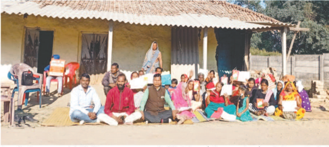
दिया की राशि आ जाएगा। तो दे देंगे लेकिन राशि नहीं मिलने के कारण महिलाओं का खाना- पीना, सोना तक हाराम हो गया है कर्ज के कारण आर्थिक एवं मानसिक पिड़ों में जुड़ रहे मुहल्ले वासी। आखिर राशि मिलेगा तो मिलेगा कब धरना में बैठे मोहल्ले वासियों के साथ सामाजिक कार्यकर्ताओं का कहना है कि काग्रेस सरकार के 4 साल हो गए और यही है

हम बार-बार गृह्यार लगाते हैं लेकिन हमारा सुनने वाला कोई नहीं होता। इसलिए वार्डवासियों ने सोमवार को सामाजिक कार्यकर्ताओं के नेतृत्व में वार्ड नंबर 9 में धरना प्रदर्शन किया। वहीं वार्डवासियों का कहना है कि मोहल्ले के कुछ लोगों का नाम आया है पर ये लोग लोग उधार में सामान लेकर प्रधानमंत्री आवास बना भी रहे हैं लेकिन उनको राशि नहीं मिल रही है। निगम का चक्र लगाते हैं निगम वाले फोटो लेकर भी जा चुके हैं हर रोज यह बोलकर टाल-मटोल करते हैं कि पैसा आ जाएगा। लेकिन आज तक पैसा नहीं आया है। महिलाओं ने कर्ज लेकर घर बनाना शुरू कर