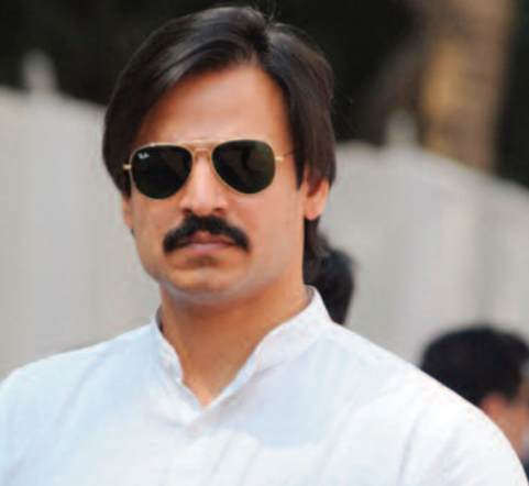
डायरेक्टर फराह खान के चैट शो 'तेरे मेरे बीच में' में इस बात को स्वीकार किया था कि इस घटना के बाद उनका करियर तबाह हो गया था। उनके मुताबिक, रातों-रात उन्हें फिल्मों से बाहर कर दिया गया, साइनिंग अमाउंट वापस ले लिया गया और अर्वाइस शो में उनकी एंट्री पर बैन लगा दिया गया

डायरेक्टर फराह खान के चैट शो 'तेरे मेरे बीच में' में इस बात को स्वीकार किया था कि इस घटना के बाद उनका करियर तबाह हो गया था। उनके मुताबिक, रातों-रात उन्हें फिल्मों से बाहर कर दिया गया, साइनिंग अमाउंट वापस ले लिया गया और अर्वाइस शो में उनकी एंट्री पर बैन लगा दिया गया ऐश्वर्या राय के जिंदगी में आते ही हुआ बवाल 2002 में फिल्म 'कंपनी' से बॉलीवुड डेब्यू करने वाले विवेक ओबेरॉय 2003 में 'बयों हो गया नाज' में अपनी को-स्टार रही ऐश्वर्या राय के साथ अफेयर की खबरों के कारण चर्चा में आ गए थे। उस दौरान ऐश्वर्या का सलमान से ब्रेक हुआ था और उन्हें विवेक के साथ उनकी नजदीकियां नागवार गुजरी थीं। यह विवादाित लव-हेट ट्रांगल काफी चर्चा में रहा था। क्योंकि सलमान और विवेक के बीच झगड़े की बात सामने आने के बाद ऐश्वर्या ने अपने आपको विवेक से भी अलग कर लिया था।