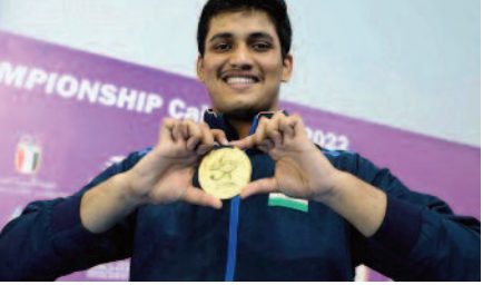
प्रेसिडेंट्स कप 2022 की शीर्ष एथलीट 2022 विश्व चैम्पियन के हिस्सा से हिस्सा लेते हैं जिसकी पुरस्कार राशि इस साल 792,000 यूरो थी। प्रत्येक स्पर्धा में 66,000 यूरो की पुरस्कार राशि थी जिसमें विश्व संचालन संस्था आईएसएसएफ के प्रमुख