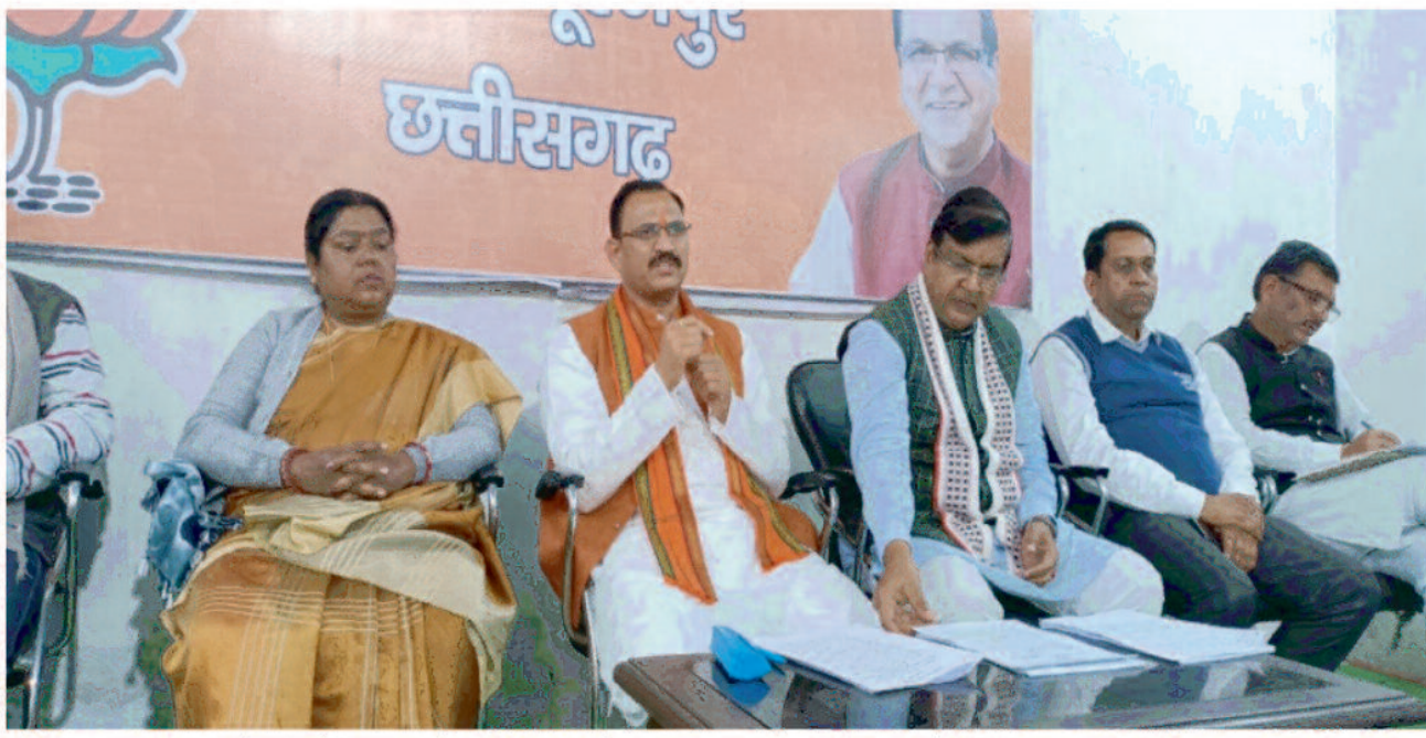
कांग्रेस के चार वर्षों के कार्यकाल में सरकार की आर्थिक स्थिति बर्हाल हो गई है। कांग्रेस ने इन चार वर्षों में 60 हजार करोड़ का कर्ज ले चुकी है। प्रदेश में बेरोजगारी चरम पर है। छत्तीसगढ़ में स्टार्ट अप योजना देश में 22वें स्थान पर है। बेरोजगारी भत्ता का वादा करने के बावजूद चार साल पूरे होने पर बेरोजगारी भत्ता का पता नहीं है। सरकार विभिन्न बर्ती परीक्षाओं को स्थगित कर युवाओं को धोखा दे रही है। उन्होंने कहा कि छत्तीसगढ़ की मातृशक्ति को प्रदेश सरकार धोखा दे रही है। स्वयं सहायता समूहों से रेडीड्यूट का काम छिन लिया गया। छत्तीसगढ़ का हालत बदतर है चार साल में

व रेत के अवैध कारोबार में सरकार के संरक्षण में अधिकारी व कुछ व्यापारियों का गिराह मिलकर खनिज संपदाओं का अवैध दोहन कर रहा है तथा कमीशनखोरी का खेल पूरे प्रदेश में खेला जा रहा है। पूरे प्रदेश में कानून व्यवस्था पूरी तरह ध्वस्त हो गई है। दिनदहाड़े न्यायधानी में जिस तरह कांग्रेस पदाधिकारी की गोली मारकर हत्या कर दी जाती है इससे आम आदमी के सुरक्षा का अंदाजा लगाया जा सकता है। छत्तीसगढ़ में पिछले चार वर्षों में 06 हजार से अधिक महिलाओं से अनाचार की शिकायतें सामने आई हैं। नेशनल क्राइम ब्यूरो के अनुसार पर व फिरोती में चौथे नंबर पर है। कांग्रेस का घोषणापत्र झूठ का पुलिंदा साबित हो गया है। घोषणा पत्र में किए पूर्ण है। आज भी किसानों व महिला समूहों का शराबबंदी के वादे से सरकार मुकर रही है। का ऋण माफी का वादा अधूरा है।