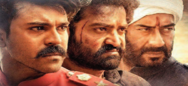
तमिल, कन्नड़, मलयालम और हिंदी में रिलीज हुई थी। इसमें अलिया भट्ट और अजय देवगन ने भी अहम भूमिका निभाई है। इसने गोलडन ग्लोब अवॉर्ड्स 2023 में बेस्ट नॉन इंग्लिश फिल्म और बेस्ट ऑरिजनल सॉंग को श्रेणी में दो नॉमिनेशन हासिल किए हैं। आरआरआर को अटलांटा फिल्म क्रिटिक्स सर्कल द्वारा बेस्ट इंटरनेशनल पिक्चर के रूप में सम्मानित किया गया है। सेटन अवॉर्ड्स 2022 में बेस्ट

एसएस राजामौली के निर्देशन में बनी फिल्म आरआरआर आए दिन एक के बाद एक उपलब्धियां हासिल कर रही हैं। पिछले दिन इसे गोलडन ग्लोब्स में दो श्रेणियों के लिए नॉमिनेशन मिला और अब इस फिल्म को क्रिटिक चॉइस अवॉर्ड्स 2023 के लिए पांच नॉमिनेशन मिले हैं, जिसके बाद फिल्म की टीम की खुशी का ठिकाना नहीं है। निर्माताओं ने सोशल मीडिया पर यह जानकारी दी है। क्रिटिक्स चॉइस अवॉर्ड्स 2023 में भी आरआरआर ने इतिहास रच दिया है। इसे बेस्ट पिक्चर, बेस्ट डायरेक्टर, बेस्ट विदेशी भाषा फिल्म, बेस्ट विजुअल एफेक्ट और बेस्ट सॉंग (नातु नातु) जैसी पांच श्रेणियों में नॉमिनेट किया गया है। आरआरआर के आधिकारिक इंस्टाग्राम पेज पर लिखा गया है, एक और दिन और आरआरआर के लिए एक और माइलस्टोन। इस खबर से फिल्म के प्रशंसक सातवें आसमान पर हैं। क्रिटिक्स फिल्म चॉइस अवॉर्ड्स में सर्वश्रेष्ठ कंटेन्ट और प्रदर्शन को सम्मानित किया जाता है। आरआरआर 1920 के दशक में दो भारतीय क्रांतिकारियों अहली सीताराम राजू और कामाराम भोम के इर्द-गिर्द बुनी गई है। राम चरण और जूनियर एनटीआर की मुख्य भूमिका वाली यह फिल्म 24 मार्च को दुनियाभर में तेलुगु,