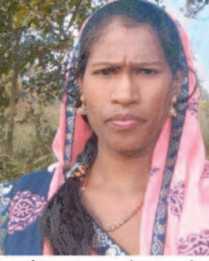
डॉक्टरों द्वारा मृतका की जांच की

- संवाददाता - उदयपुर, 16 दिसम्बर 2022 (घटती-घटना)।