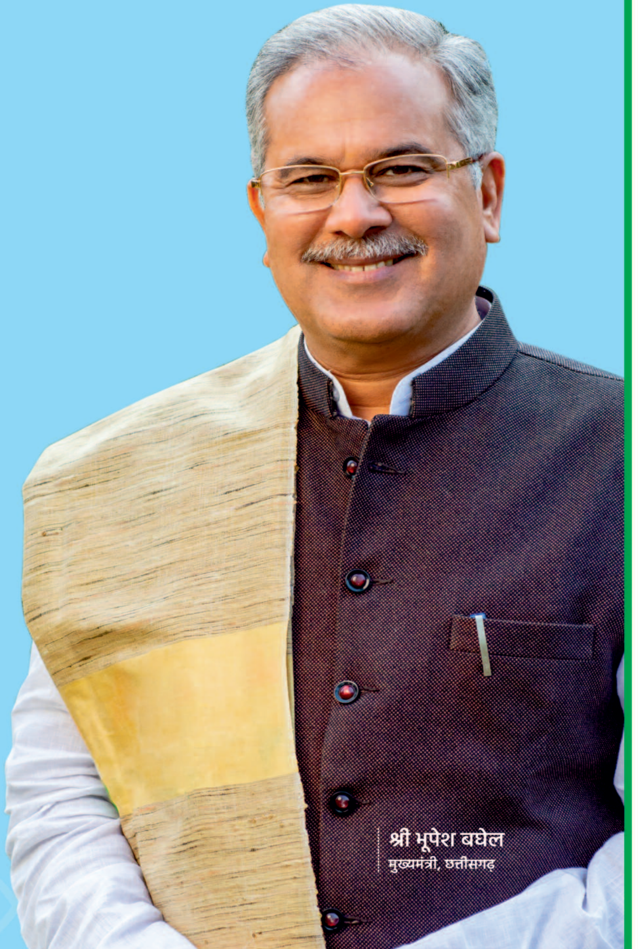
श्री भूपेश बघेल मुख्यमंत्री, छत्तीसगढ़