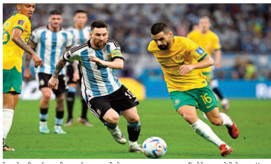
रोनाल्डो की पुर्तगाल टीम क्वार्टर फाइनल से बाहर हो गई और विश्व

दोहा, 16 दिसम्बर 2022। अपना दूसरा और आखिरी विश्व कप फाइनल खेलने जा रहे लियोनेल मेस्सी पर पूरे देश की उम्मीदों का दारोमदार होगा। आठ साल पहले वह खिताबी मुकाबले में चूक गए थे लेकिन उन जख्मों को अब दोबारा हरा नहीं होने देना चाहेंगे। अर्जेंटीना ने तीन दशक से अधिक समय से विश्व कप नहीं जीता है। मेस्सी का सपना लुसैल स्टेडियम पर रिवार को होने वाले फाइनल में फ्रांस को हराकर खिताब जीतने का है क्योंकि अपने सुनहरे कैरियर में इसके अलावा वह सब कुछ जीत चुके हैं। इसके साथ ही वह इस दौर के महानतम खिलाड़ियों के मुकाबले में क्रिस्टियानो रोनाल्डो को मीलों पीछे छोड़ देंगे जो अभी तक विश्व कप नहीं जीत सके हैं। 37 वर्ष के