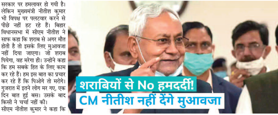
शराबियों से No हमदर्दी! CM नीतीश नहीं देंगे मुआवजा

पटना, 16 दिसंबर 2022 (ए)। बिहार में जहरीली शराब के सेवन से बहुत से लोगों की मौत हो गयी है। इसी के साथ बिहार के राजनितिक गलियारों में भी खलबली मची हुई है। बिहार के छपरा में जहरीली शराबकांड में मृतकों की संख्या बढ़ती जा रही है। अबतक 53 लोगों की मौत हो चुकी है। कई लोगों के आंखों की रोशनी भी चली गई है। वहीं विपक्षी बीजेपी नीतीश कुमार सरकार पर हमलावर हो गयी है। लेकिन मुख्यमंत्री नीतीश कुमार भी विपक्ष पर पलटवार करने से पीछे नहीं हट रहे हैं। बिहार विधानसभा में सीएम नीतीश ने साफ कहा कि शराब से अगर मौत होती है तो इसके लिए मुआवजा नहीं दिया जाएगा। जो शराब पियेगा, वह मरेगा ही। उन्होंने कहा कि हम सबके हित के लिए काम कर रहे हैं। हम इस बात का प्रचार कर रहे हैं कि पिछले तो मरोगे। गुजरात में इतने लोग मर गए, एक दिन बात हुई बस। उसके बाद किसी ने चर्चा नहीं की। सीएम नीतीश कुमार ने कहा कि