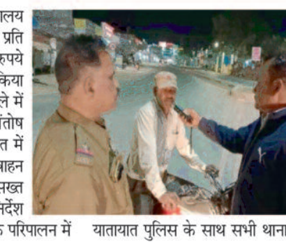
यातायात पुलिस के साथ सभी थाना