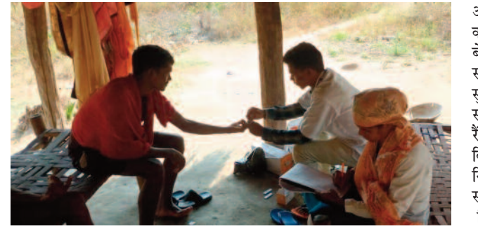
सुकमा ,03 दिसम्बर 2022(ए)। नीति आयोग द्वारा

अक्टूबर माह में जारी आकांक्षी जिलों की डेल्टा रैकिंग में सुकमा जिले ने बेहतर प्रदर्शन करते हुए देश में प्रथम स्थान हासिल किया है। आकांक्षी जिला सुकमा को अक्टूबर माह के लिए स्वास्थ्य और पोषण के क्षेत्र में प्रथम रैंक मिला है। प्रशासन एवं स्वास्थ्य विभाग द्वारा किए जा रहे प्रयासों से निश्चित ही जिले में स्वास्थ्य एवं पोषण संबंधी मापदण्डों में बेहतरी हुई है। जिले में गर्भवती महिलाओं की एएससी रजिस्ट्रेशन में 4 प्रतिशत की बढ़ोतरी