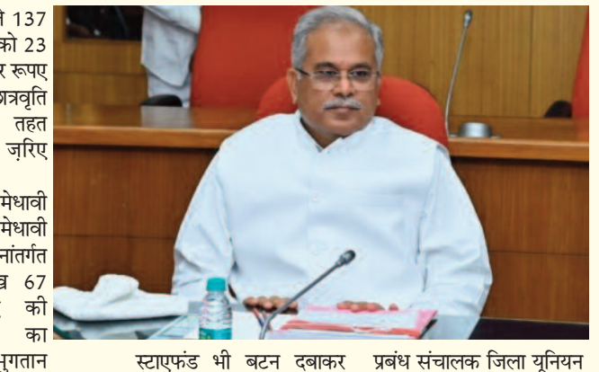
प्राप्त करने वाले 137 छात्र-छात्राओं को 23 लाख 35 हजार रूपए प्रतिभाशास्त्री छात्रवृत्ति योजना के तहत डीबीटी के जरिए प्रदाय की। इसी तरह 61 मेधावी विद्यार्थियों को मेधावी छात्रवृत्ति योजनांतर्गत कुल 1 लाख 67 हजार रूपए की छात्रवृत्ति का ऑनलाइन भुगतान किया। व्यवसायिक और गैर व्यवसायिक पाठ्यक्रम में शिक्षा के लिए तेंदूपत्ता संग्राहक परिवार के 30 बच्चों को 1 लाख 55 हजार रूपए का

कवर्धा ,03 दिसम्बर 2022(ए)। मुख्यमंत्री भूपेश बघेल ने आज वर्चुअल मोड में विभिन्न योजनाओं के तहत कबीरधाम जिले के 238 हितग्राहियों को 43 लाख 17 हजार 500 रूपए की राशि ऑनलाइन भुगतान किया। मुख्यमंत्री बघेल ने शहीद महेंद्र कर्मा तेंदूपत्ता संग्राहक सामाजिक सुरक्षा योजना के तहत जिले के 10 हितग्राहियों को 16 लाख 60 हजार 500 रूपए की सहायता राशि का ऑनलाइन डीबीटी किया। उन्होंने साथ ही जूलि के तेंदूपत्ता संग्राहक परिवार के 75 प्रतिशत अंक से अधिक