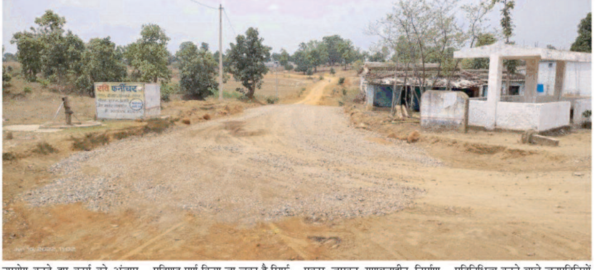
उपयोग करते हुए कार्य को अंजाम दिया गया है। बताया कि मुख्य मार्ग ठगणा से सिंचित होते हुए दुग्गी पटना को जोड़ने वाले उक्त सड़क मार्ग का नवनिर्माण व उन्नयन कार्य का ढेकेदार को मिला है लेकिन ढेकेदार की मनमानी के कारण कार्य बिना डब्ल्यू एम एम प्लांट के इस सड़क का निर्माण कार्य लगभग डब्ल्यू एम एम का 100/ प्रतिशत पूर्ण किया जा चुका है सिर्फ डमरीकरण कार्य बाकी है। जिसका मौके पे जाकर जांच करने पर सारी सच्चाई सामने आ जाएगी। लेकिन ऐसा नहीं हो पा रहा है, जिससे होने वाले कार्य की मजबूती पर प्रश्नचिन्ह लग रहा है। जबकि इस कार्य का देखरेख करने वाले संबंधित अधिकारी ढेकेदार के हाथों की कठपुतली बन उनके इशारे पर नाचते नजर आते हैं, तो वही क्षेत्र का

लोक निर्माण विभाग के अधिकारी पर ढेकेदार पड रहा है भारी ढेकेदार के द्वारा मनमाने तरीके से कराया जा रहा बैकटुपर मुख्य मार्ग ठगणा से सिंचित सड़क मार्ग का नव निर्माण एवं, पुल- पुलिया निर्माण कार्य में गुणवत्ताहीन सामग्री का उपयोग, लोक निर्माण विभाग के अधिकारियों के सामने ढेकेदार कर रहा है सड़क की लम्बाई चौड़ाई और मोटाई में घेले अधिकारियों को जानकारी के बाद भी नहीं कर रहे हैं कार्यवाही लोक निर्माण विभाग के राज्य मंत्री के द्वारा गुणवत्ता विहीन सड़क निर्माण कार्य कराये जाने पर कड़ी कार्यवाही करने के निर्देश के बाद भी सड़क निर्माण कार्य धड़ले से गुणवत्ता विहीन निर्माण किया जा रहा है सड़क निर्माण कार्य में ढेकेदार के द्वारा डब्ल्यू एम एम का निर्माण समग्री बिना डब्ल्यू एम एम प्लांट के और बिना पेंवर मशीन से बिना ग्रेडिंग के कार्य कराया जा रहा है। जबकि यहां सड़क निर्माण कार्य लोक निर्माण विभाग के अधिकारियों की सारी जानकारी और इनके सह पर कराया जा रहा है सड़क की निर्माण समग्री किस डब्ल्यू एम एम प्लांट से कया कया सामग्री किस किस मात्रा में मिल कर आ रही है इसकी जाच करने की जरूरत कभी नहीं समझी अधिकारियों ने जिससे इनके किए गए निरीक्षण पर प्रश्न चिन्ह लगा रहा है अधिकारी सिर्फ करते हैं निरीक्षण का दावा