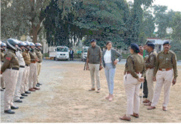
एवं महिलाओं के विरुद्ध हो रहे अपराधों की रोकथाम के लिए महिला पेट्रोलिंग टीम का गठन करना एवं महिला अपराधों पर प्रभावी नियंत्रण हेतु टीम को हर ज़रूरतमंद महिला