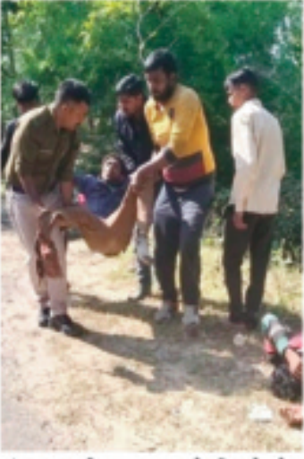
मंगलवार की सुबह घर से निकले थे। दोपहर करीब 12 बजे वे अपने एक साथी

अंबिकापुर-प्रतापपुर मार्ग पर मंगलवार को दोपहर एक तेज रफ्तार कार ने पहले 2 बाइक में से सवार 5 युवकों को टकरा मारी, फिर अनियंत्रित होकर पेड़ से जा भिड़ी। हदसे में कार सवार युवक की मौकें पर ही मौत हो गई, जबकि कार चालक व एक बाइक में सवार 2 युवक गंभीर रूप से घायल हो गए। वहीं दूसरी बाइक में सवार 3 युवकों को भी चोट आई है। सूचना पर पहुंची पुलिस ने शव बरामद कर पोएम के लिए भिजवाया, जबकि घायलों को अस्पताल में भर्ती कराया। कार चालक समेत 3 घायलों को आईसीयू में भर्ती कराया गया है।