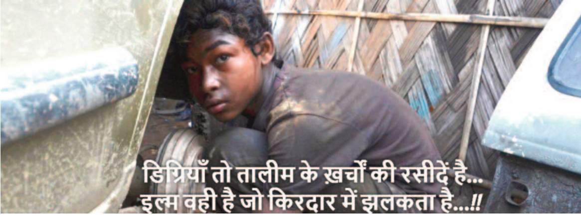
डिग्रियाँ तो तालीम के खर्च की रसीदें है... इल्म वही है जो किरदार में झलकता है...!!

चलेगा। साथियों बात अगर हम किताबी शिक्षित और किताबी अनपढ़ व्यक्तियों की करें तो, बहुत अंतर है। किताबी अनपढ़ आदमी केवलकुलेटर चलाता नहीं जानता साग हिसाब किताब उंगलियों से करना पड़ता है पढ़ा-लिखा आदमी विना केवलकुलेटर के चार में से दो घटने के लिए भी अपनी उंगली नहीं धिसता। किताबी अनपढ़ व्यक्ति के पास अपने अनुभव के अतिरिक्त कुछ नहीं होता जबकि पढ़ा-लिखा साथियों शायद इसीलिए किताबी पढ़े-लिखे अनपढ़ों की संख्या बढ़ती जा रही है। पिछले कुछ दशकों में शिक्षा का स्तर काफी बढ़ गया है पर शिक्षा की वैल्यू खत्म होती जा रही है। ध्यान दे तो बाद आता है जहाँ कुछ साल पहले ग्रेजुएशन ही काफी था, आज पोस्ट ग्रेजुएशन, वका