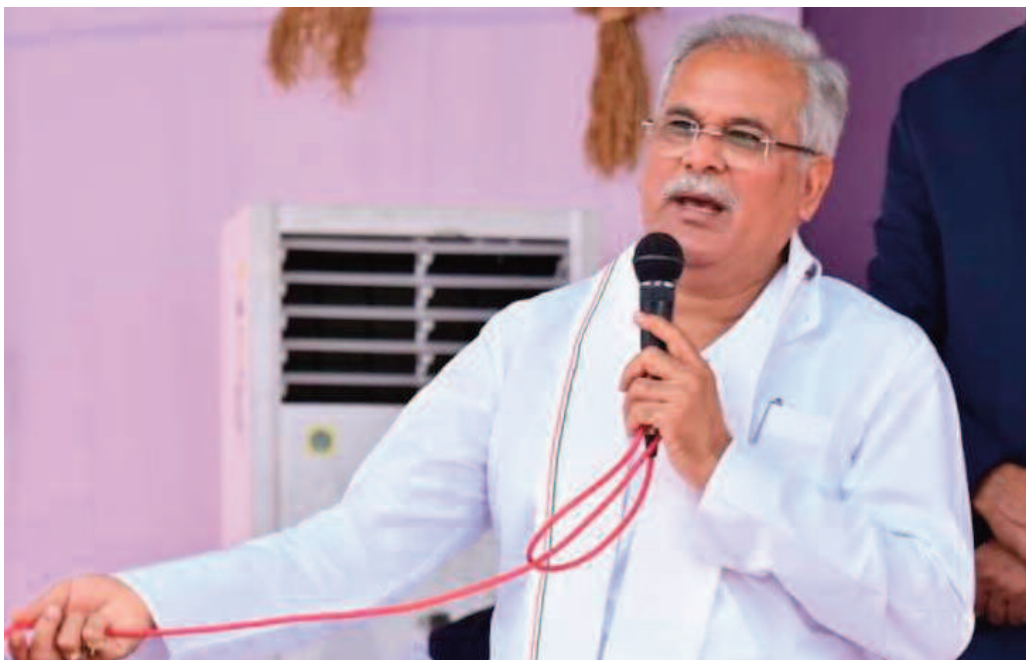
दरअसल पूछताछ के नाम पर ईडी और इनकम टैक्स जैसी एजेंसियां इन दिनों कईयों को समन देकर तलब कर रही हैं।

मुख्यमंत्री भूपेश बघेल ने बैक टू बैक 6 ट्वीट कर अधिकारियों को निर्देश दिया है कि जिस तरह से भयाक्रांत कर सेंट्रल एजेंसियां कार्रवाई कर रही हैं, उसकी सूचना केंद्र सरकार को दी जाये। साथ ही मुख्यमंत्री ने कहा कि जिस किसी से भी पूछताछ हो, उसकी विडियोग्राफी करायी जाये। मुख्यमंत्री ने कहा कि कानूनी रूप से पूछताछ और कार्रवाई में सहयोग दिया जायेगा, लेकिन मारपीट और धमकी के आधार पर पूछताछ जैसी शिकायतें आगे मिलेंगी, तो राज्य की पुलिस विधिक रूप से कार्रवाई हेतु विवश होगी।